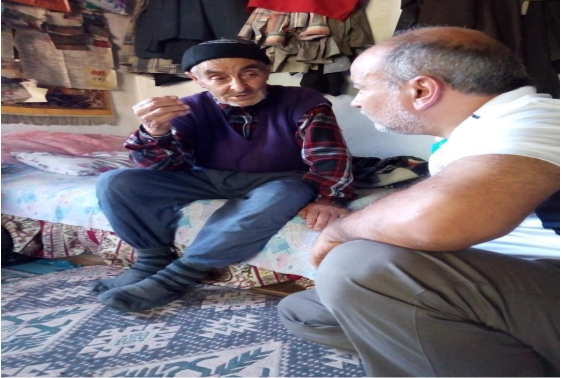
Resim 19: Halk Hekimi Kırık Çıkıkçı