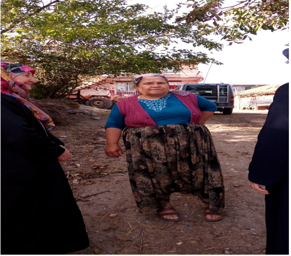
Resim 18: Kırık Çıkık Ocağı