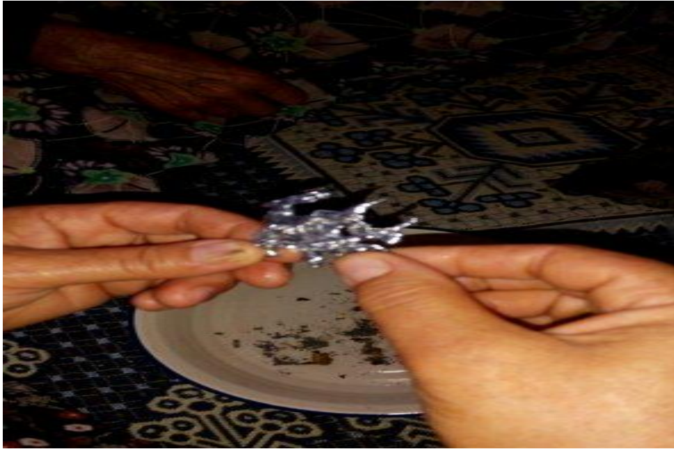
Resim 13: Dökülen Kurşunun Şekline Bakarak Yorum Yapma