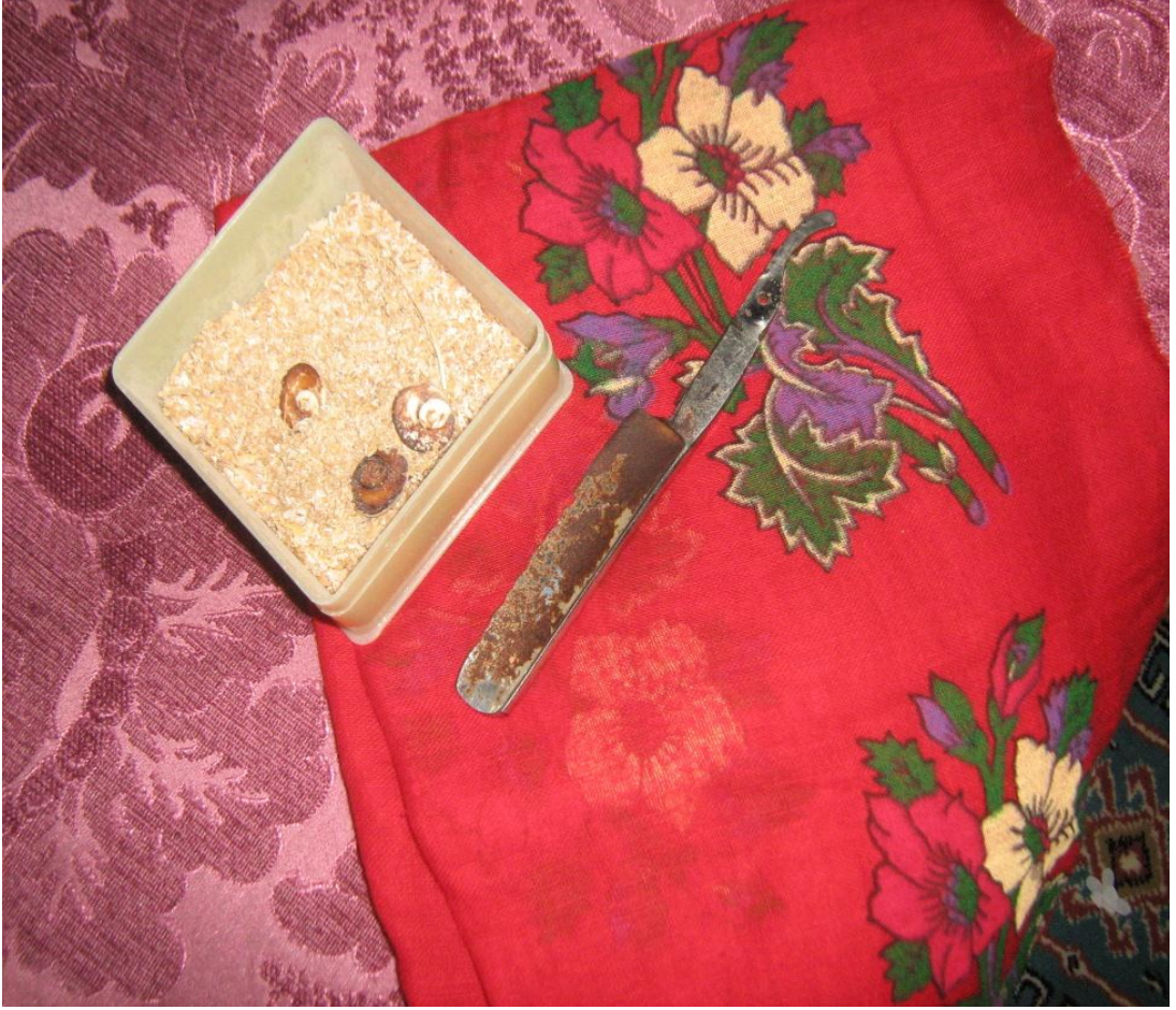
Resim 8: Al Bez