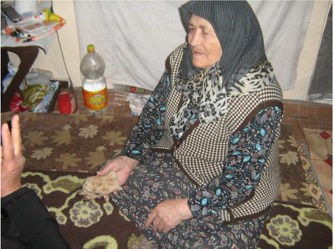
Resim 5: Göbek Fıtığı (Keçe sarma)