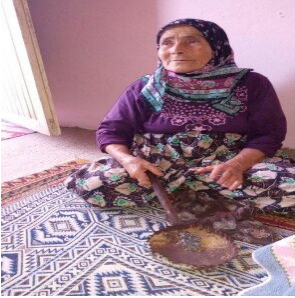
Resim 12: Kursun Dökme