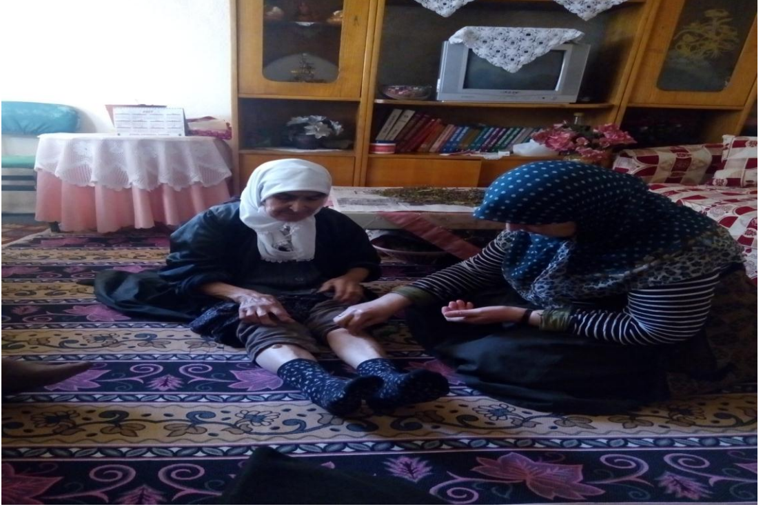
Resim 2: Yılcık Ocağı