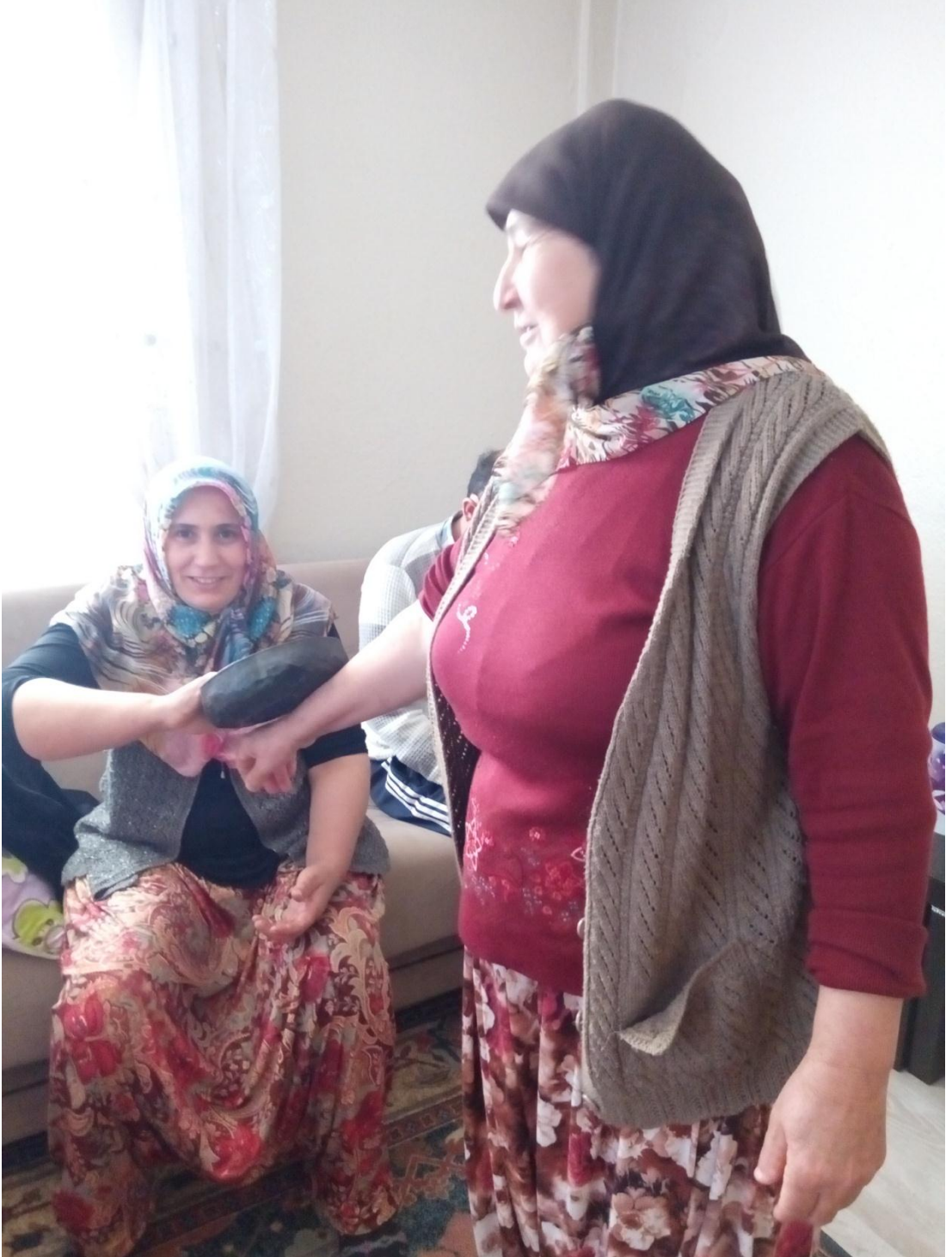
Resim 17: Bezme Ocađı