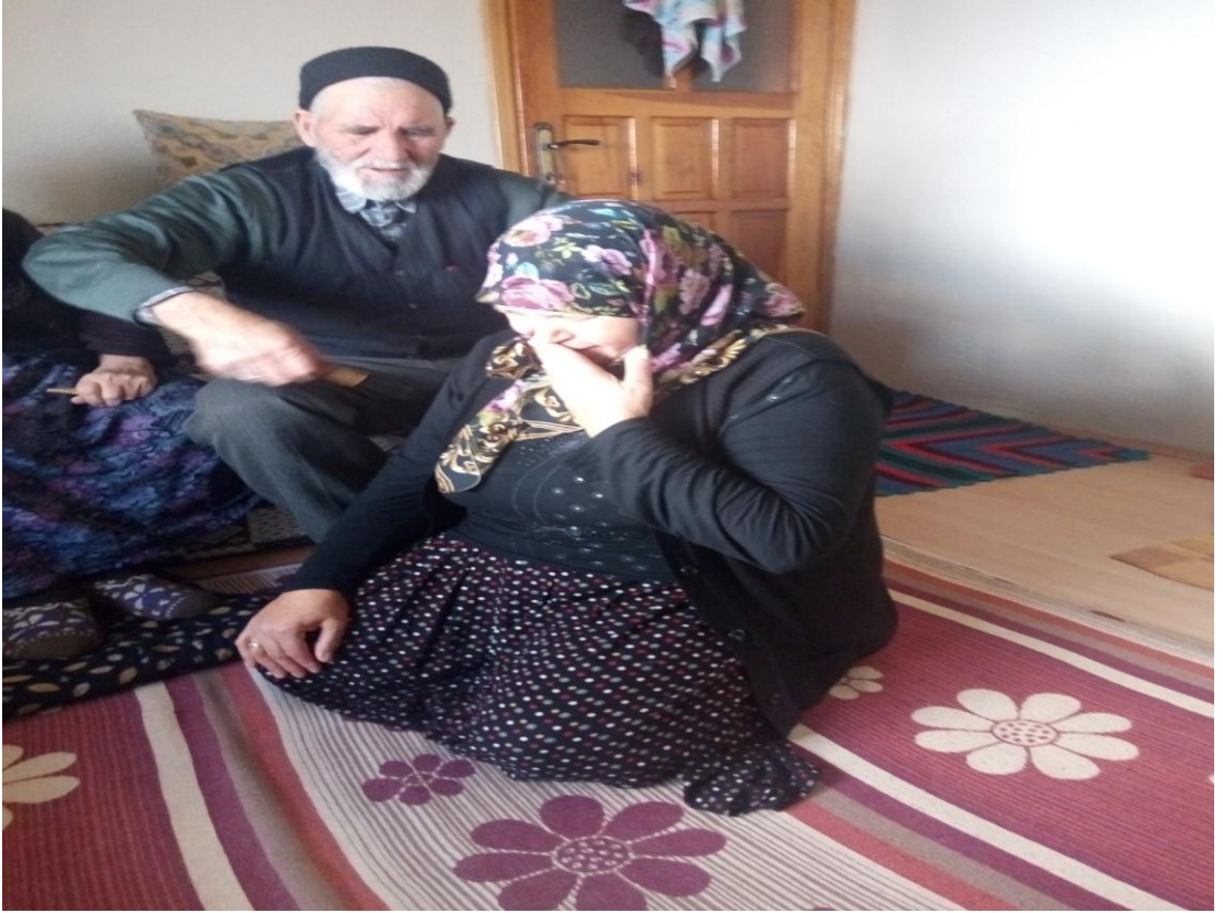
Resim 3: Yılcık Ocağı