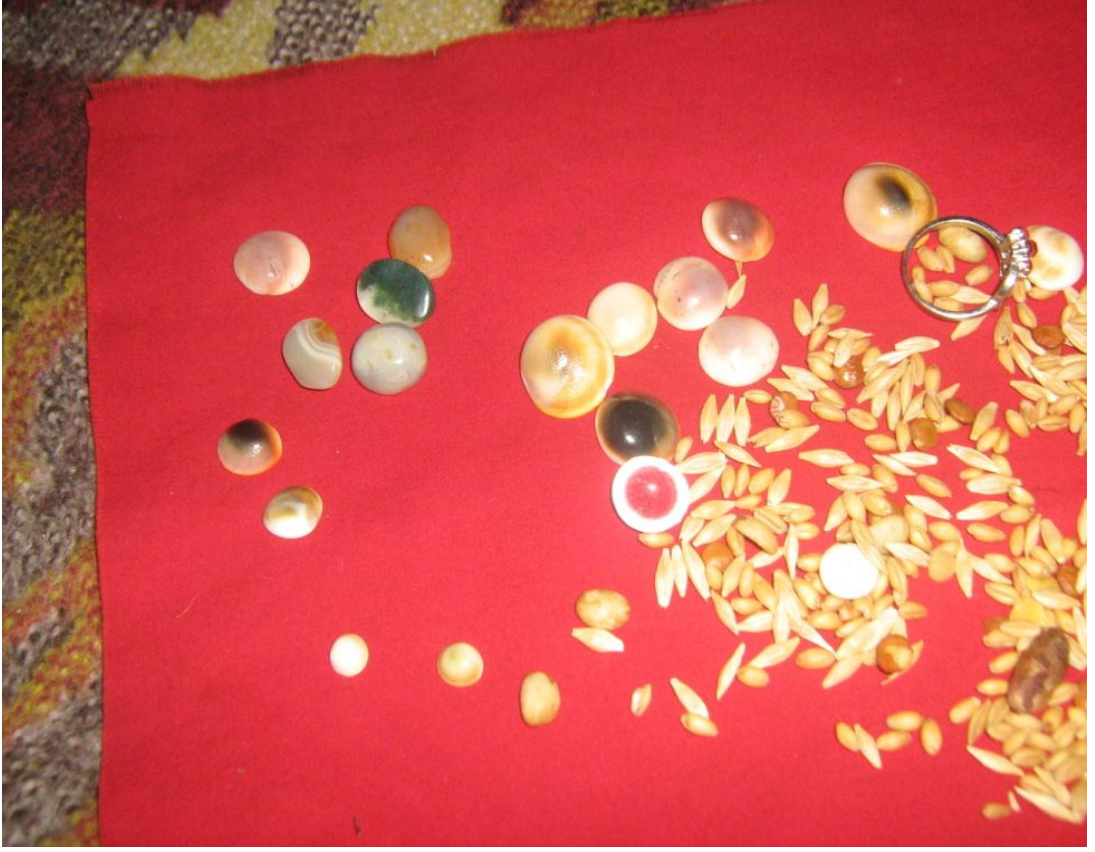
Resim 6: Yılcık Taşları