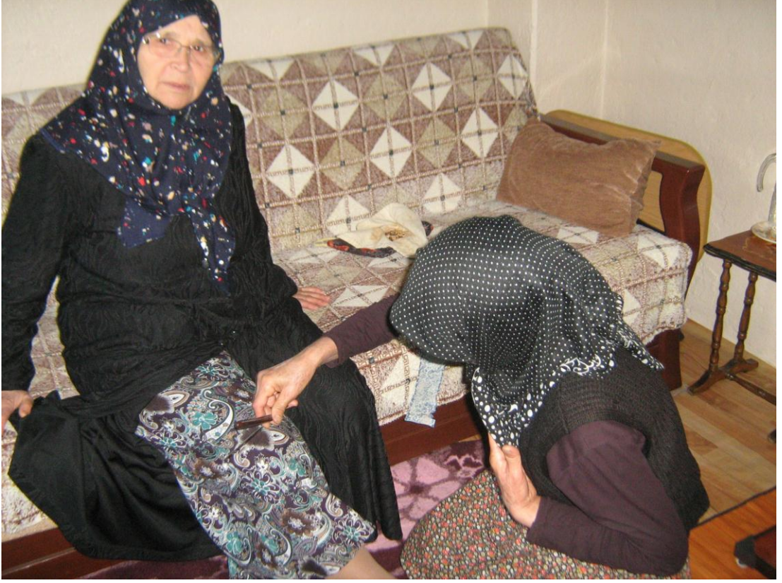
Resim 4: Çevirme Ocağı