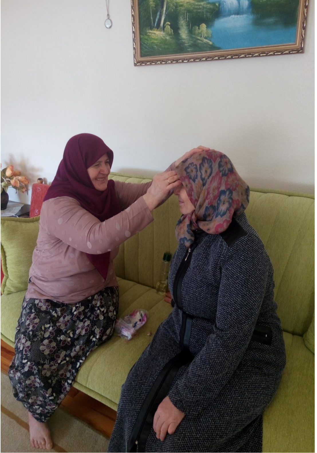
Resim 21: Sarılık Ocađı