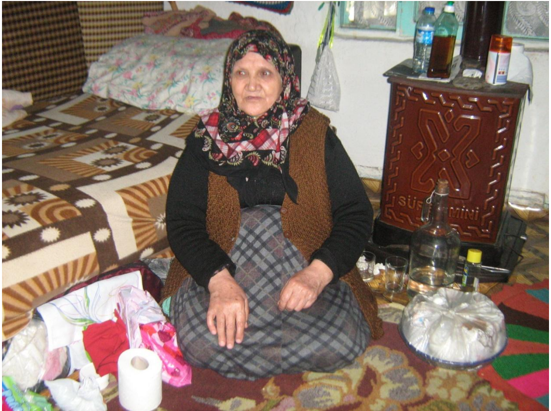
Resim 11: Pek Çok Hastalığı Sağaltan Ocaklı (KK.6)