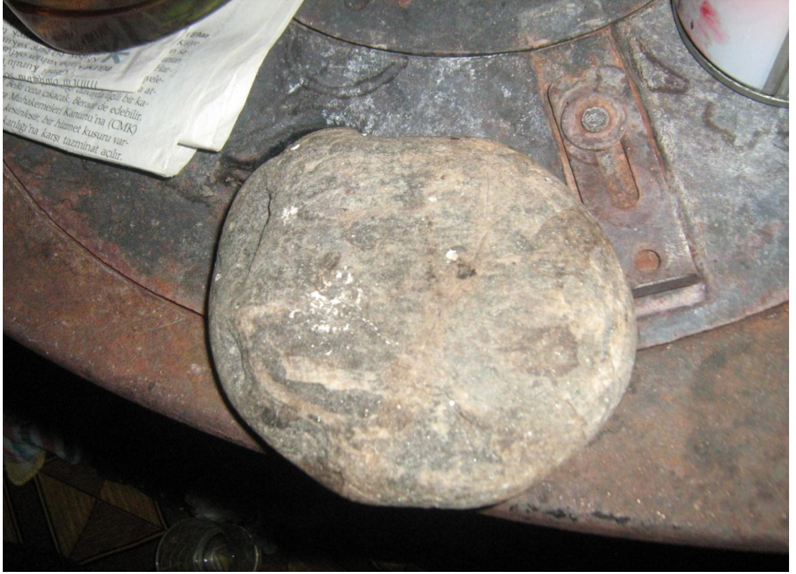
Resim 10: Köstebek Ocağında Kullanılan Taş