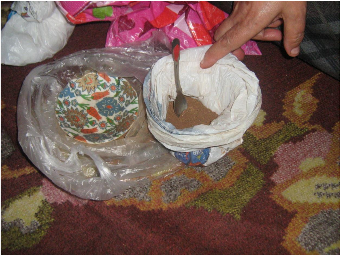
Resim 9: Gece Yanığı İçin Köstebek Toprağı