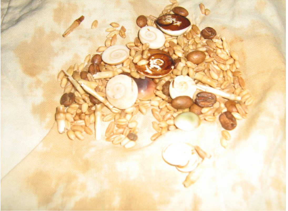
Resim 7: Yılcık Taşları