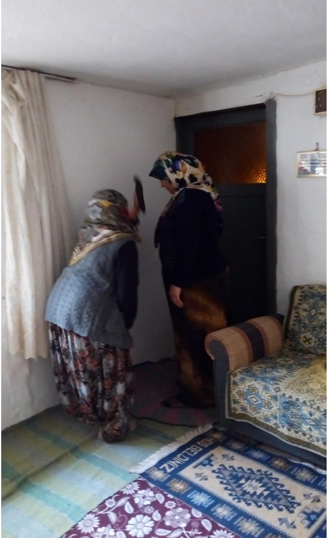
Resim 16: Siyahlama Ocađı