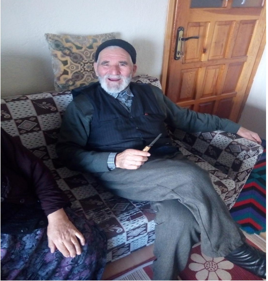
Resim 1: Yılcık Ocağı