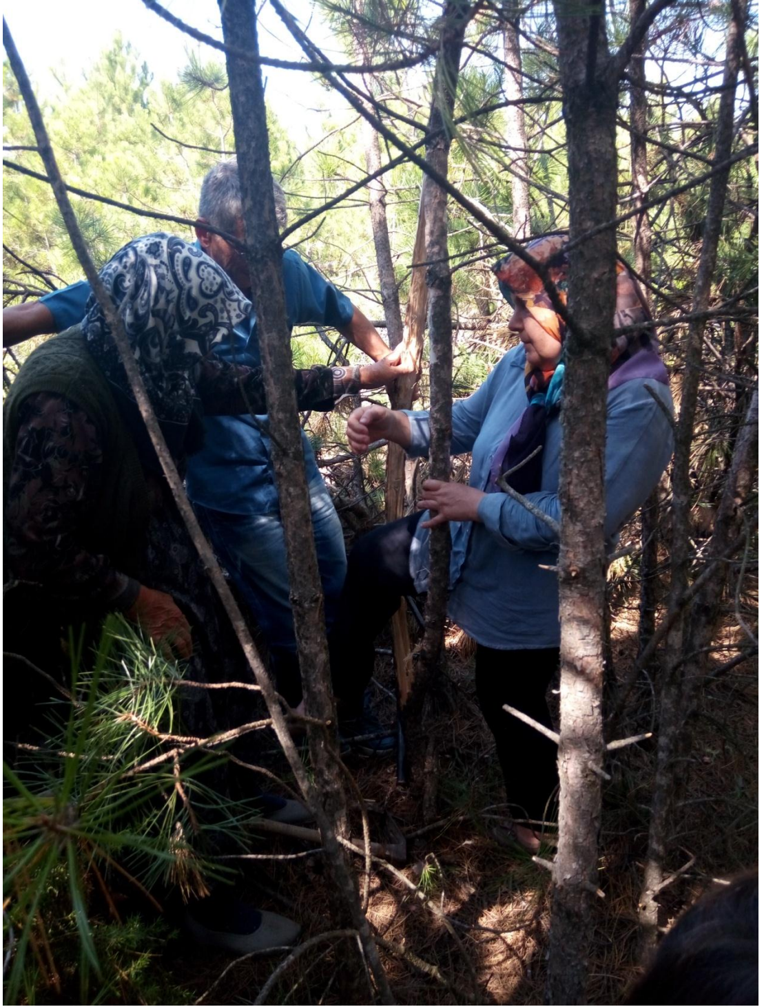
Resim 20: Yarımlık Ocağı