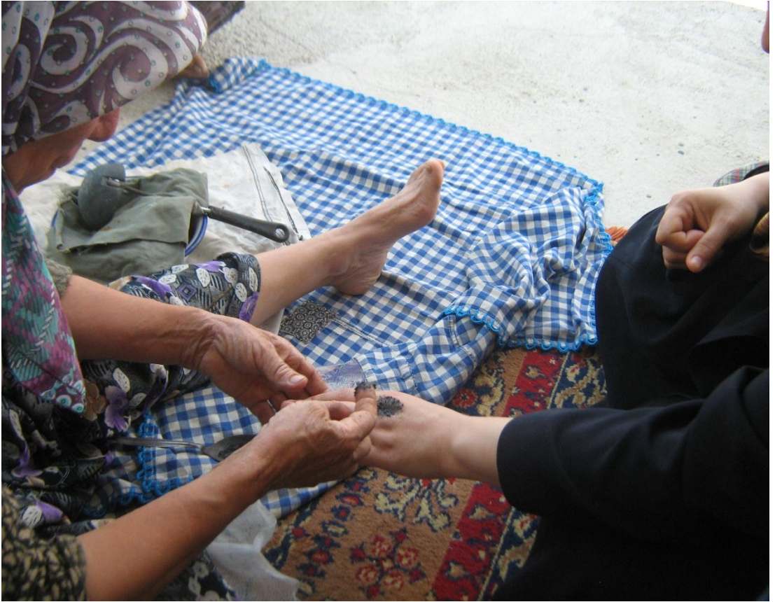
Resim 15: Temre Tedavisi