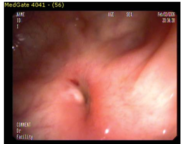
Resim 1. Anastomotik darlık.

postoperatif yedinci günde taburcu edildiği ve patoloji sonucunun tubülovillöz adenom olarak rapor edildiği saptandı. Muayenesinde göbeği soldan dönen dokuz cm'lik median kesisi mevcuttu. Barsak sesleri sağ alt kadranda minimal artmıştı. Polikliniğimize başvurusundan 15 gün önce dış merkezde yapılan tüm karın bilgisayarlı tomografisinde transvers kolonda beş cm'lik segmentte duvar kalınlaşması, kolonoskopisinde ise transvers kolonda lümeni tama yakın tıkayan darlık mevcuttu. Hastayla görüşülerek yeni bir kolonoskopi ve gereğinde aynı seansta dilatasyon yapılmasına karar verildi. Dört mg midazolam ve 40 mg petidin HCL ile sedoanaljezi uygulanarak yapılan kolonoskopisinde hepatic fleksura yerleşiminde eski anastomoz yeri olarak düşünülen, kolonoskopun geçişine izin vermeyen, yaklaşık iki mm'lik lümeneye sahip, üzerinde granülasyon dokusu mevcut olan çepeçevre darlık mevcuttu (Resim 1).