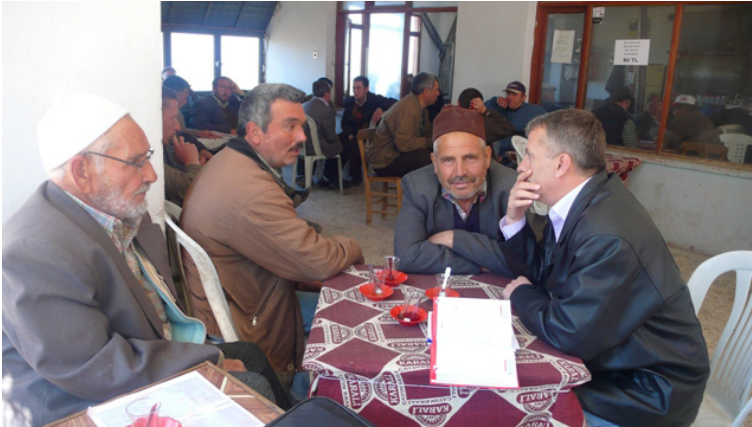
Foto 2. Hacıhüseyinler Köyü arazi çalışması

Hayvancılık faaliyetine bağlı olarak ortaya çıkan yaylaların yoğun olarak bulunduğu dağlık alanlardan biri de; Ege Bölgesi'nin kuzeyde Marmara Bölgesi ile sınırını oluşturan Madra Dağı kütesinin yüksek kesimleridir.