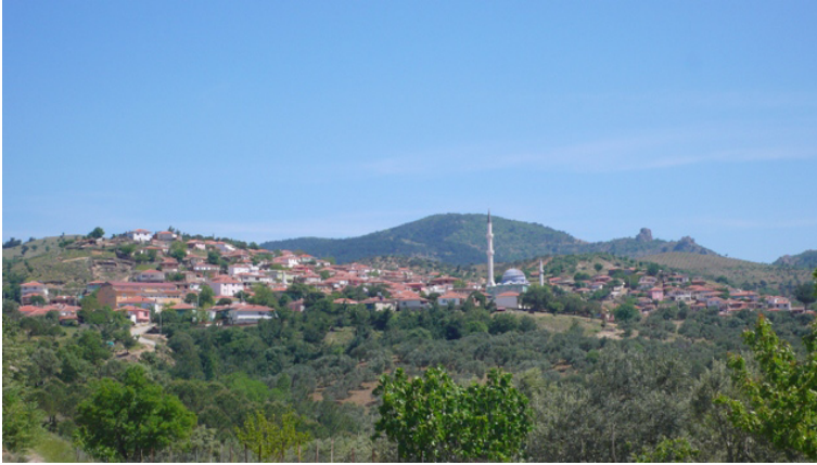
Foto 1. Hacıhüseyinler Köyü

Bu çalışmanın konusu Madra Dağı'ndaki Hacıhüseyinler Köyü sakinlerinin geleneksel yayla göçü faaliyetleridir. Madra Dağı'nın kuzeybatı yamacında bulunan Hacıhüseyinler Yaylası, Gömeç ilçesine bağlı Hacıhüseyinler Köyü halkının geleneksel hayvancılık ekonomisi kapsamında kullandığı yazlık mera alanıdır (Foto 1).