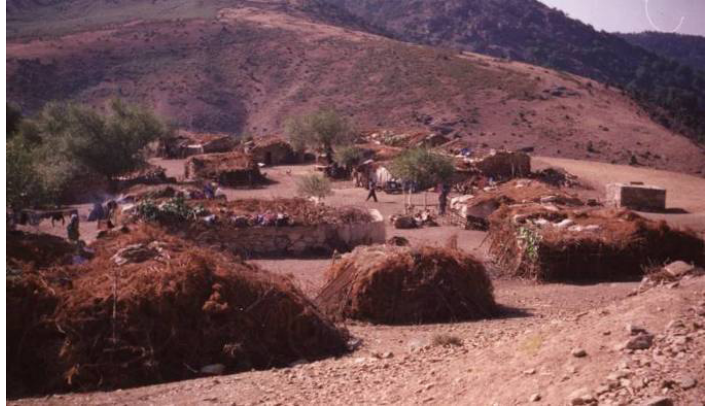
Foto 3. Hacıhüseyinler Yaylası

Geleneksel hayvancılık ekonomisinin yazlık otlak alanı olarak kullanılan Hacıhüseyinler Yaylası, Madra Dağı'nın daha nemli ve serin olan, alçak zondaki kuraklığa karşılık yazın hayvan otlatmaya uygun meraların yer aldığı,