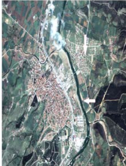
Fotoğraf 1: Karşıyaka Mahallesi'nin (dikey ok) kuş bakışı görünümü. Yatay ok Susurluk Çayını göstermektedir (Susurluk Belediyesi Fotoğraf Arşivi).