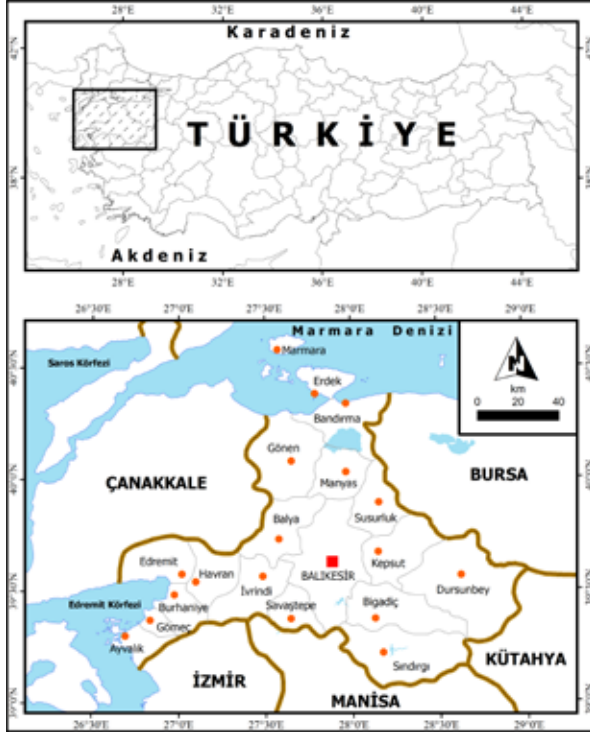
Şekil 1: Çalışma alanı lokasyon haritası

ve bunlara ait mahalleler dikkate alınmamaktadır. Balıkesir ilinde ilçe merkezi olan yerleşmelere ait toplam 187 mahalle bulunmaktadır. Balıkesir 39 mahalle ile en çok mahallesi olan şehir yerleşmesi iken, Balya ilçe merkezi sadece iki mahalleden oluşmaktadır.