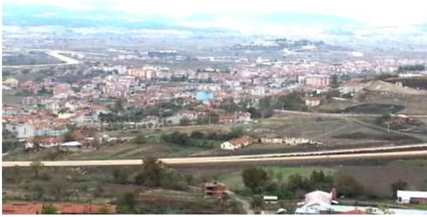
Fotoğraf.1- Bigadiç Ovası'nın Doğusunda Kurulan Bigadiç Şehrinden Bir Görünüm

yamaçlarına geçildiği için yapılaşma bu kesimde sona ermektedir (Fotoğraf 1).