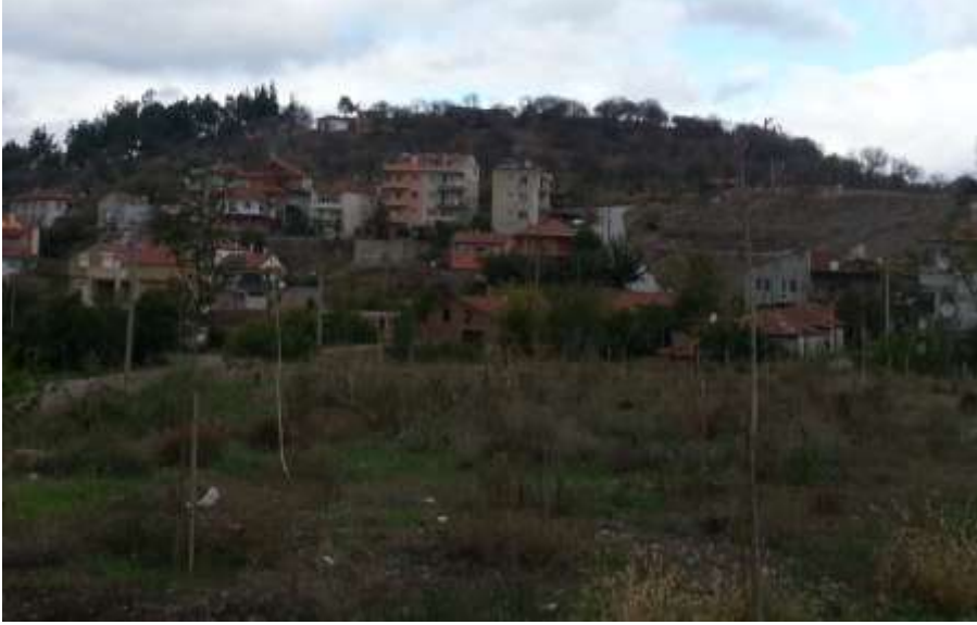
Fotoğraf.2- 1986 Yılında Sit Alanı İlan Edilen Bigadiç Kalesi Kalıntıları

Bizanslılar tarafından XI. yüzyılda inşa edilen kale, Yunan işgali sırasında karargâh olarak kullanılmıştır. Kalenin sadece dış sur kalıntılarının bir kısmı günümüze kadar gelebilmiştir. Kalenin iç kesimi toprak altında kalmıştır. Kale yaklaşık 155.000 m 2 olup, bulunduğu alan imara kapalıdır.