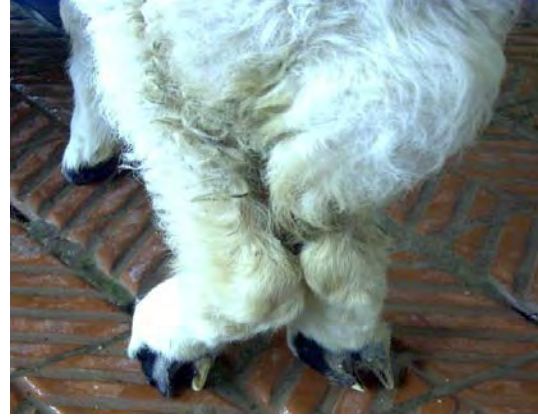
Şekil 3. Kuzularda arka bacak deformitesi.