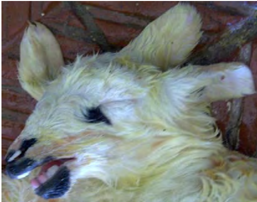
Şekil 2. Kuzuda üç kulak.