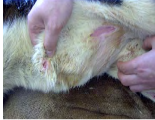
Şekil 4. Bir kuzuda atresia preputia.