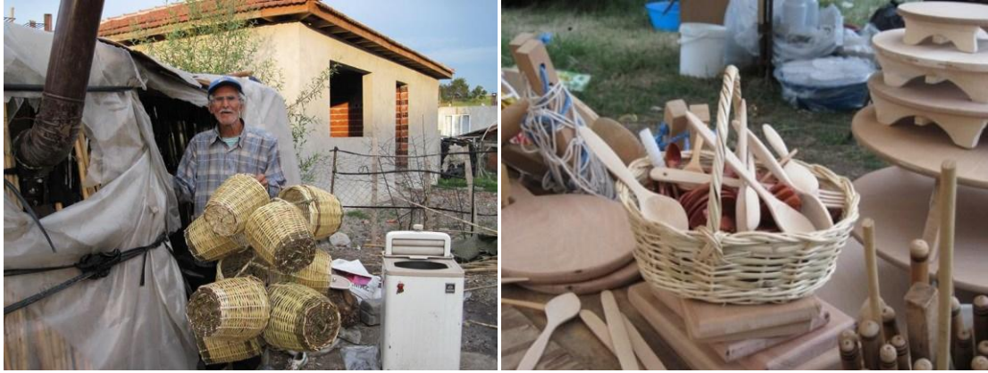
Şekil 2. Yöresel pazarlar – el sanatı ürünleri

Manyas yöresinde kurulan pazarların yanı sıra çevre alanlarda kurulan yerel pazarlarda çeşitli periyotlarla defalarca gezilmiştir. Yöresel pazar gezilerinde satılan kaşık, sepet, sele, nazarlık ve süpürge gibi çeşitli el sanatları ürünleri fotoğraflanmıştır (Şekil 2). Alınan örneklere birer numara verilerek, ürünün yerel adı, nasıl yapıldığı, yapımında hangi bitkilerin kullanıldığı ve yapım aşamaları kayıt altına alınmıştır.