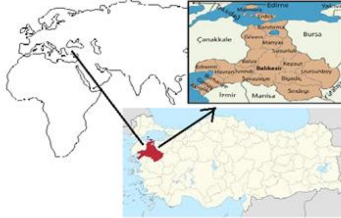
Şekil 1. Çalışma Alanı – Manyas/Balıkesir

Araştırma alanı “ Flora of Turkey” deki kayıtlara göre A1 (A) karesinde yer alır. Yöre bitki coğrafyası bakımından Akdeniz fitocoğrafik bölgesinde yer almakla birlikte, Avrupa-Sibirya ve İran-Turan fitocoğrafik bölgelerinin de bazı elemanlarını barındırmaktadır. Manyas, Türkiye'nin kuzeybatısında, Marmara Bölgesinin sınırları içerisinde, Balıkesir iline bağlı bir ilçedir. Doğusunda Bandırma ve Susurluk, batısında Gönen ve Balya, kuzeyinde Manyas Gölü, güneyinde Balya ve Balıkesir bulunur (Şekil 1). Manyas ilçesinin yüzölçümü yaklaşık olarak 586 km 2 olup, merkez ilçenin yüzölçümü ise 6 km 2 dir. İlçenin 44 köy ve 3 beldesi bulunmaktadır. Manyas ilçesi, Manyas Gölü'nün güneyinde yer alan en düz ve en verimli ovaların bitip tepelerin başladığı bölgede bulunmaktadır. Deniz seviyesinden yüksekliği 55 metredir. Nüfusun ve konut ihtiyacının artmasıyla büyümektedir. İlçe merkez nüfusu 5455 civarındadır.