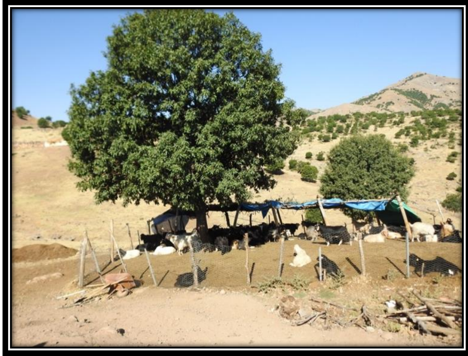
Şekil 29. Kurbanlık Keçiler

Kanlı adağın yanı sıra insanların minnet ve adak için adadığı kansız adaklar da vardır. Bunlar; oruç, niyaz ve lokmadır. Bunlar da niyete bağlı yapılan ritüeller arasındadırlar. Un, süt ve tereyağından yapılan “Niyaz” inançta önemli bir rol tutar. Niyaz; ziyaretlere giderken, oruç tutarken, adak adarken, kötü bir olaydan sonra, kirvelik tutulurken, nikâh kıyılırken yapılıp dağıtılan bir yiyecektir (Şekil 30). Günlük ibadetlerin her alanında hazırlanarak dağıtılır. Kansız kurban olarak sayılan diğer ürün ise lokmadır. Niyaz dışındaki her türlü dağıtılan ürüne “lokma” denir.