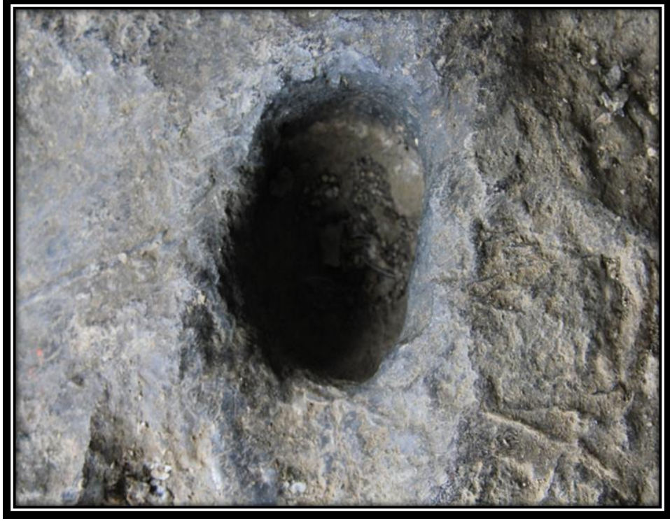
Şekil 15. Düzgün Baba'nın Asasına Ait Olduđuna İnanılan Baston İzi

Mağara içerisinde bulunan “Sır Çeşmesi” olarak adlandırılan kısımdan çok az su çıkmaktadır. Bölge halkının inancı ve rivayetlerine göre bu sudan sadece kalbi temiz olanlar içebilir (Şekil 16). Farklı zamanlarda yapılan arazi çalışmalarında Sır Çeşmesindeki suyun azaldığı görülmüştür. Ziyaretçiler suda görülen bu azalmayı, mekâna olan inancın azalması ile bağdaştırmıştır. Doğal süreçlerle meydana gelebilecek bir olgu olan suyun azalması olayını ziyaretçiler kültürel formlarla açıklamaya çalışmaktadır.