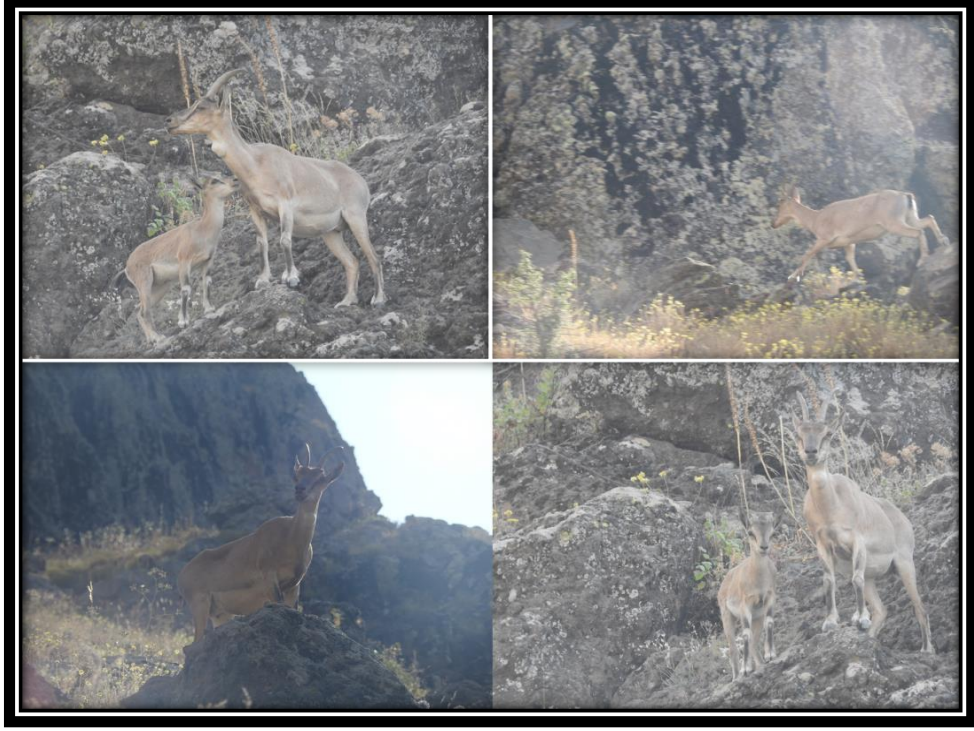
Şekil 34. Düzgün Baba'daki Yaban Hayatı