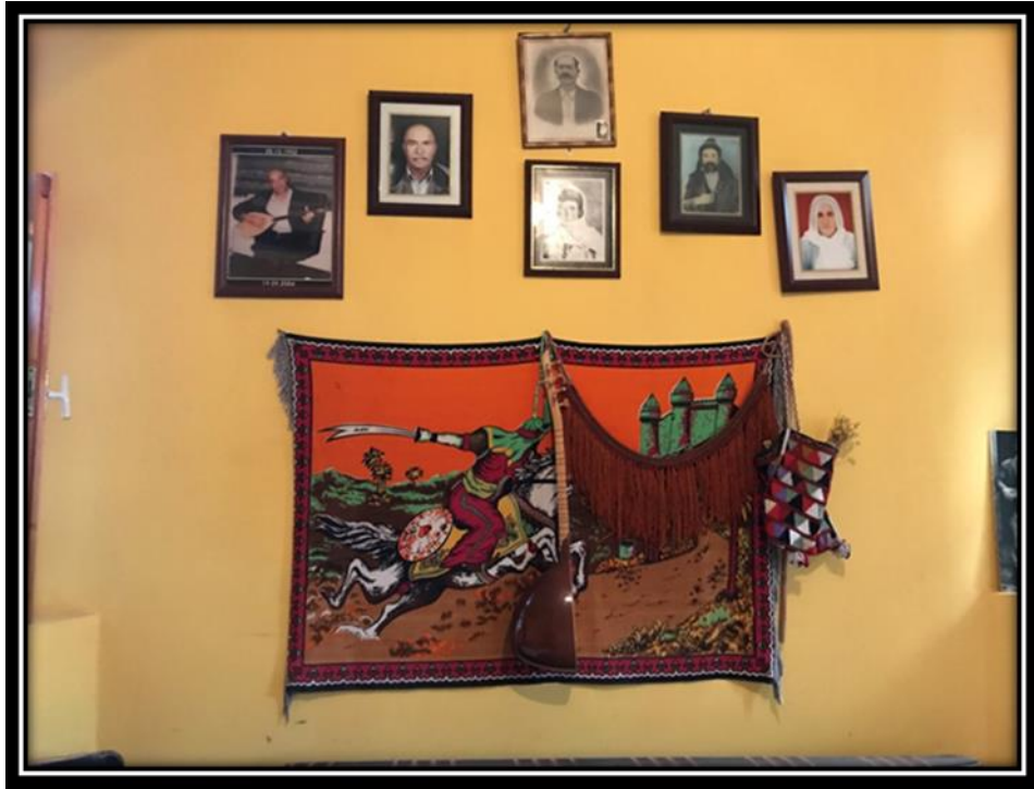
Şekil 5. Kureyş Baba ocağına hizmet eden bireylere ait fotoğraflar

Kureyş'in önemli bir değer olarak sayılması, bölgeye Aleviliği yayan ilk erenlerden olmasının yanı sıra Kureyş'in Düzgün Baba ile kurulan baba-oğul ilişkisidir. Kureyş Baba'nın zamanında keramet gösterdiğine inanan halk, Kureyş Baba ziyaretinin kerametlerinin günümüzde de var olduğuna inanmaktadır. Bu düşünce şifa ve şefaet bulmak ya da Hak yoluna girmek isteyenleri hala mekâna çekmektedir. Kureyş Baba ocağının hizmeti Kureyşan aşiretine bağlı bir aile tarafından altı yüzyıldır görülmektedir. Bu hizmeti ise Hak yoluna giren aile bireyi devralmaktadır (Şekil 5).