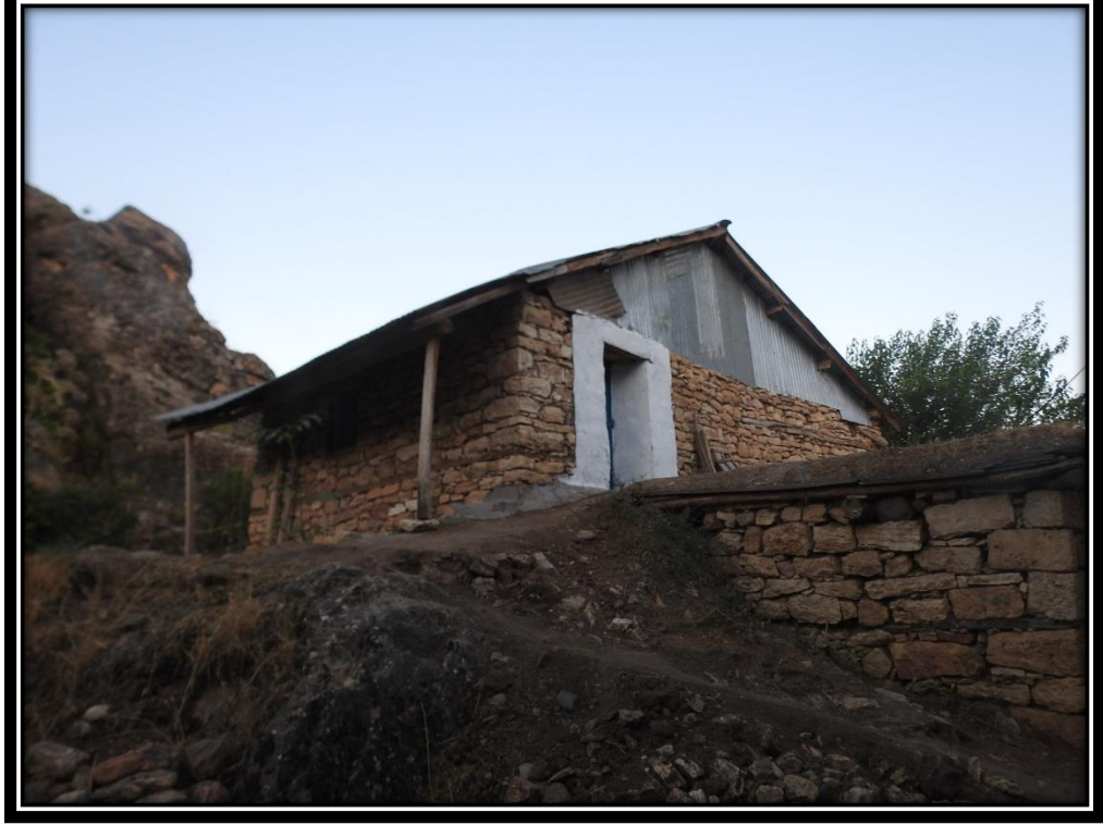
Şekil 25. Moro Sur Ziyaret Alanı

Bölgede diğer ziyaret alanlarında olduğu gibi Moro Sur için anlatılan rivayetler bulunmaktadır. Bunlardan biri şu şekildedir: İki kardeş olan Moro Sur (Kızıl Yılan) ve Moro Şia (Kara Yılan) Doluca Köyü'nde rivayet edilen bir kayanın üzerinde yarışa girerler. Yarış ise kayanın dibine en hızlı kimin varacağı ile ilgilidir. İki kardeş yarış yaparlar ve kızıl yılan kayayı delip geçerken, karayılan kızıl yılanın gerisinde kalır. Karayılan bunun üzerine Tunceli'nin Mazgirt ilçesine gider. Moro Şia'nın ziyareti Mazgirt ilçesinde bulunmaktadır.