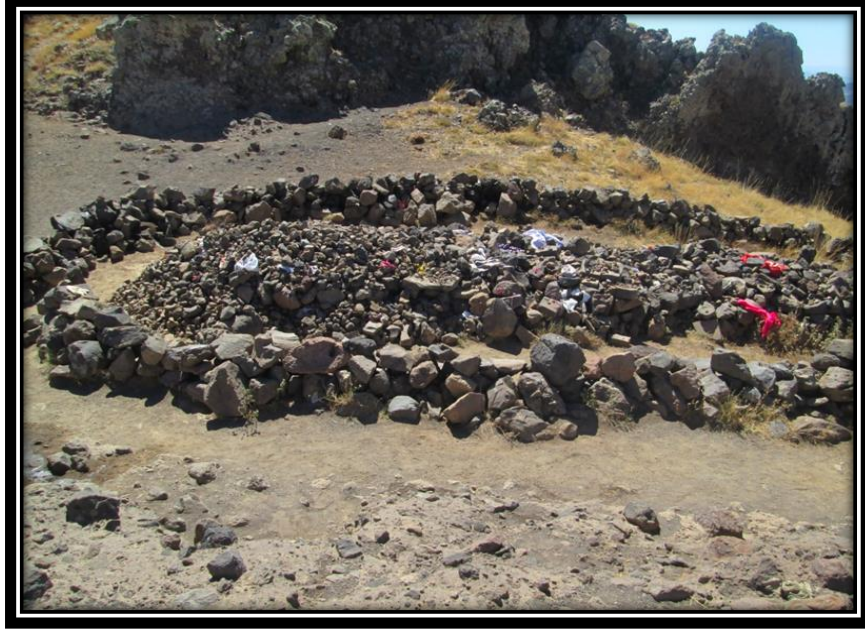
Şekil 18. Düzgün Baba'nın Sembolik Mezarı (2068 m.)

Ali aşkının birliğini yansıtırken, Beşler; Hz. Muhammed, Hz. Ali, Hz. Fatıma, Hz. Hasan ve Hz. Hüseyin'dir. Yediler ise; Hz. Muhammed, Hz. Ali, Hz. Fatıma, Hz. Hasan ve Hz. Hüseyin, Hz. Hatice, Hz. Selmanı Pak Hazretleri ile birlikte hak yolunda iman eden ulu âşık olarak adlandırılır (Düzgün, 2016). Bu eylem bir nevi âşık olanları anmak adına yapılır (Şekil 18).