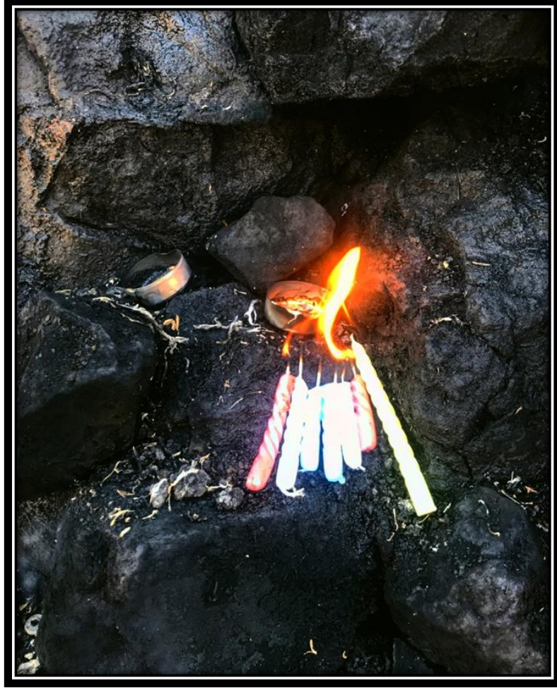
Şekil 31. Mum Yakma