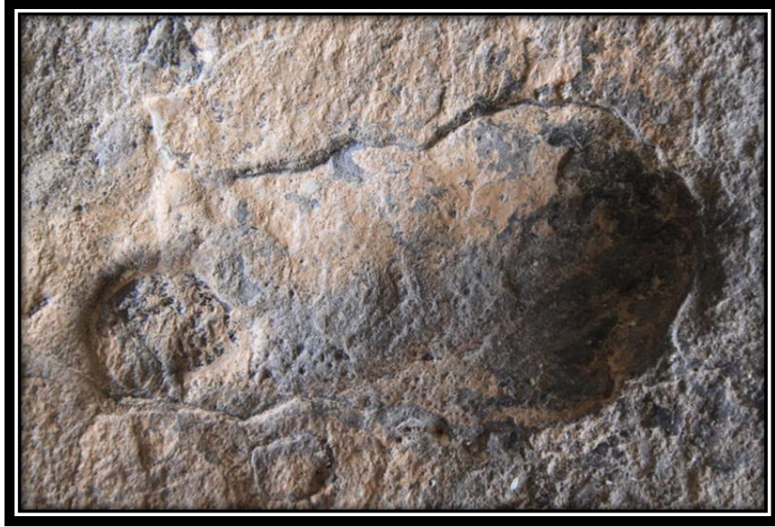
Şekil 17. Düzgün Baba'ya Ait Olduğu Söylenen Sembolik Ayak İzi

İkinci mağarada Düzgün Baba'ya ait olduğu söylenen sembolik bir ayak izi de mevcuttur (Şekil 17).