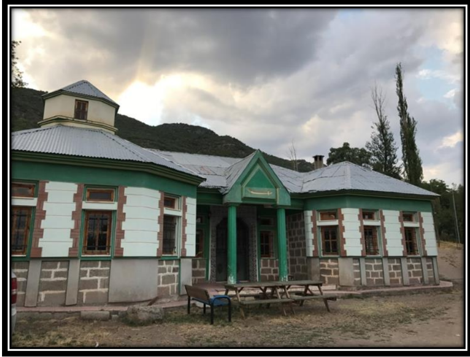
Şekil 4. Kureyş Baba Türbesi

Kureyş Baba ziyareti Nazimiye ilçesine bağlı Bostanlı köyünde bulunmaktır. Bölgede önemli seyit ailelerinden olan Kureyş'in ocağıdır. Erzincan, Erzurum, Adıyaman, Muş gibi illerde bu ocağa bağlı taliplerde vardır (Gezik ve Çakmak, 2010). Kureyş Babanın Seyid soyundan olması, bölgeye ziyaretçi potansiyelini arttıran bir etken oluşturmuştur. Bölgede yapılan araştırma sonucunda, Nazimiye ilçesinde Düzgün Baba ziyaretinden sonra ziyaretin tanınma düzeyi en yüksek ikinci ziyaret alanı burasıdır (Şekil 4).