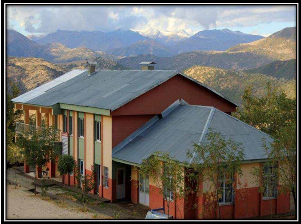
Şekil 9. Düzgün Baba Cem Evi

Kutsal mekâna gelen ziyaretçiler genellikle günü birlik ziyarette bulunurlar. Bu durum ziyaret alanında günlük rutin eylemleri oluşturmuştur. Ziyaretçiler güneşin doğuşuyla birlikte mekâna gelerek kurbanlarını seçer ve kesilmesi için kurbanlar için oluşturulan kesimhaneye gider. Pir'in kurban duası vermesi üzerine kurbanları kesilir ve çıralık dağıtılır. Ardından dağa tırmanmak isteyen ziyaretçiler, Düzgün Baba Cem Evi'nin önüne gelir ve bölge halkının rehberliği eşliğinde dağa tırmanırlar (Şekil 9).