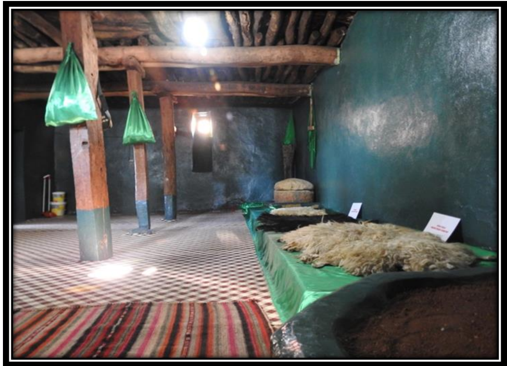
Şekil 24. Kal Ferhat Ziyaretinin İç Mekân Görünümü