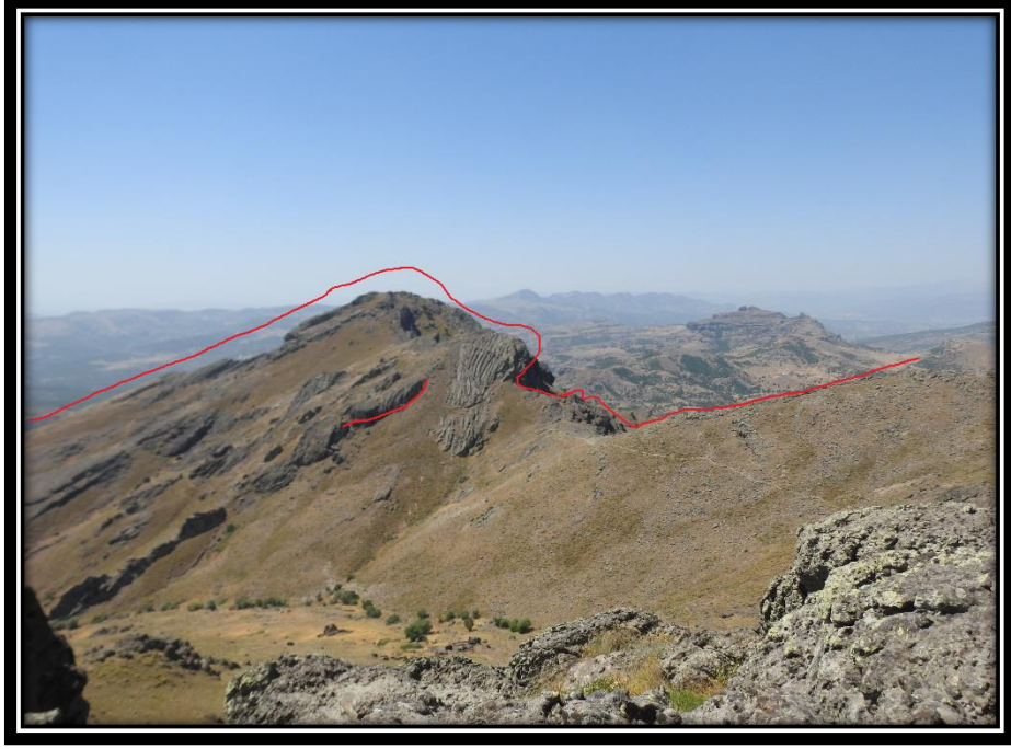
Şekil 19. Ana Haskar Dağı (Düzgün Baba Dağı'ndan Görünümü)

Günübirlik ziyaretlerin gerçekleştiği bu ziyaret alanında ziyaretçiler; kurban kesme, adak adama ritüellerinin ardından, Ana Haskar dağına tırmanıp, Ana Haskar çeşmesinden teberik alarak ritüellerini tamamlarlar (Şekil 20).