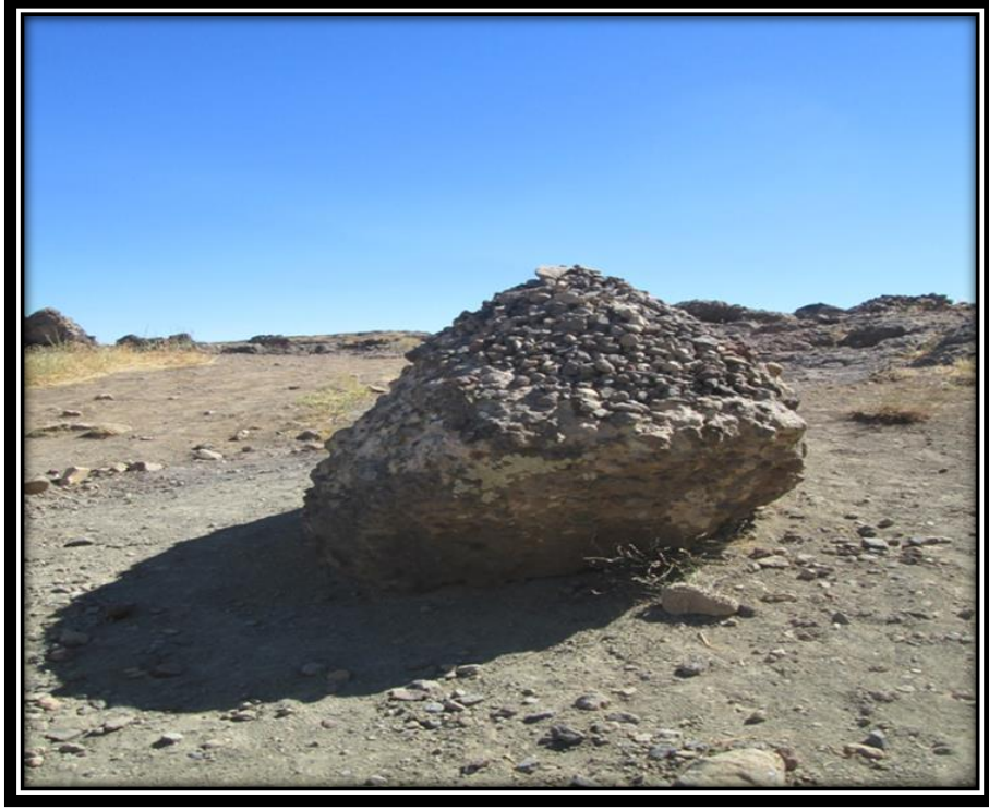
Şekil 11. Düzgün Baba Dağı Dilek Taşı (1861 m.)

İnsanların, Düzgün Baba Dağı'nı tırmanışı esnasında güzergâhlarında iki önemli mağara bulunmaktadır. Mağara kültürünü yansıtan bu morfolojik yapılardan ilkinin Çile Mağarası oluşturur. Hak yoluna giren bireylerin çile çekmek için kaldığı bu mağara 2000 m. yükselti de bulunur. Çile, bireyin halktan uzaklaşıp, Hak ile bütünleşmek adına yapılan nefsi terbiye eylemidir. Odak grup görüşmelerinde bilirkişilerin anlatımlarına göre bu mağara eski zamanlarda hak yoluna girmek isteyen ya da bedensel arınma ve şifa bulmak isteyen insanların inzivaya çekildikleri bir alanken, günümüzde günöbirlik gelen ziyaretçilerin uğradıkları, niyaz ve lokma dağıttıkları, kurbanlarını kesip, kısmen de olsa cem ritüelini uyguladıkları bir alan olarak kullanılmaktadır (Şekil 12).