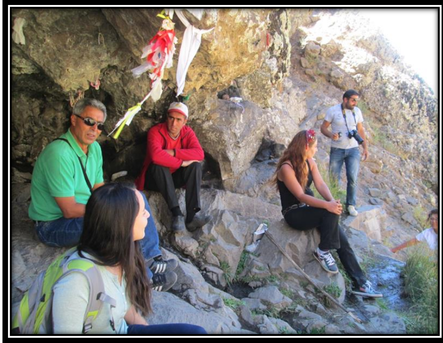
Şekil 20. Ana Haskar Çeşmesi ve Ziyaretçileri (1833 m.)

Günübirlik ziyaretlerin gerçekleştiği bu ziyaret alanında ziyaretçiler; kurban kesme, adak adama ritüellerinin ardından, Ana Haskar dağına tırmanıp, Ana Haskar çeşmesinden teberik alarak ritüellerini tamamlarlar (Şekil 20).