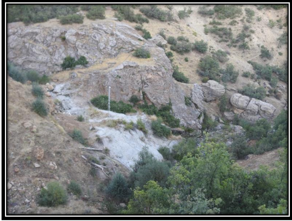
Şekil 27. Moro Sur Kaplıca Alanı