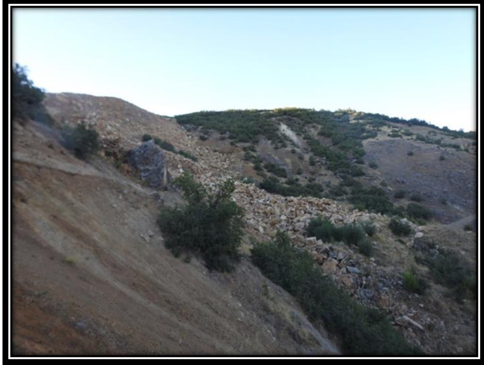
Şekil 26. Moro Sur Kaplıca Alanında Meydana Gelen Çökme

iřletmenin olmaması gerektiđini bildirmişlerdir. Çünkü yerel halka göre ziyaret alanları kutsal ruha aittir. Bu mekânlarda ticari iřletmelerin olmaması gerekir. Ancak bu iřletme ticari faaliyetlerini sürdürmeye devam etmiştir. 2017 yılının mart ayı içerisinde, ziyaret alanına yakın bir yerdeki mermer iřletmesinin çökmesi sonucu Moro Sur Kaplıcası göçük altında kalmıştır. Kutsal mekânın fiziki hasara uğraması sonucu bölgeye gelen ziyaretçi sayısında azalmalar olmuştur. Fiziki ortama yüklenen değerler, fiziki ortamın tahribata uğramasıyla birlikte değer kaybetmiştir. Kısaca fiziki mekânın şekil deđişimine uğraması, kültürel değerlerin de deđişikliđini beraberinde getirmiştir. Öyle ki yerel halk, çökmenin yaşandıđı tarihten itibaren insanların ziyaret alanına gelmediđini belirtmiştir. Hatta ziyaretçilerin gelmemesine bađlı olarak burada açılmış olan ticari iřletme de faaliyetlerine son vermiştir (Şekil 26).