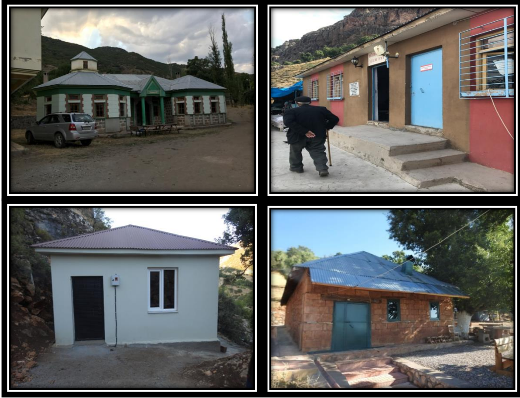
Şekil 33. Ziyaretçiler İçin Yapılmış Olan Konaklama Mekânları

bireyler, kutsal mekâna geldikleri günün gecesinde rüyalarında evliyalarından kendilerine yol göstermelerini isterler. Bu eylemin gerçekleştirilebilmesi için mekânda ziyaret haricinde insanlara hizmet amaçlı konaklama yerleri inşa edilmiş ve ziyarete bağlı eklenti alanları oluşturulmuştur. Bölgede Hızır Taşı haricinde bütün kutsal mekânlarda ziyaretçilerin konaklayacağı alanlar oluşturulmuştur (Şekil 33).