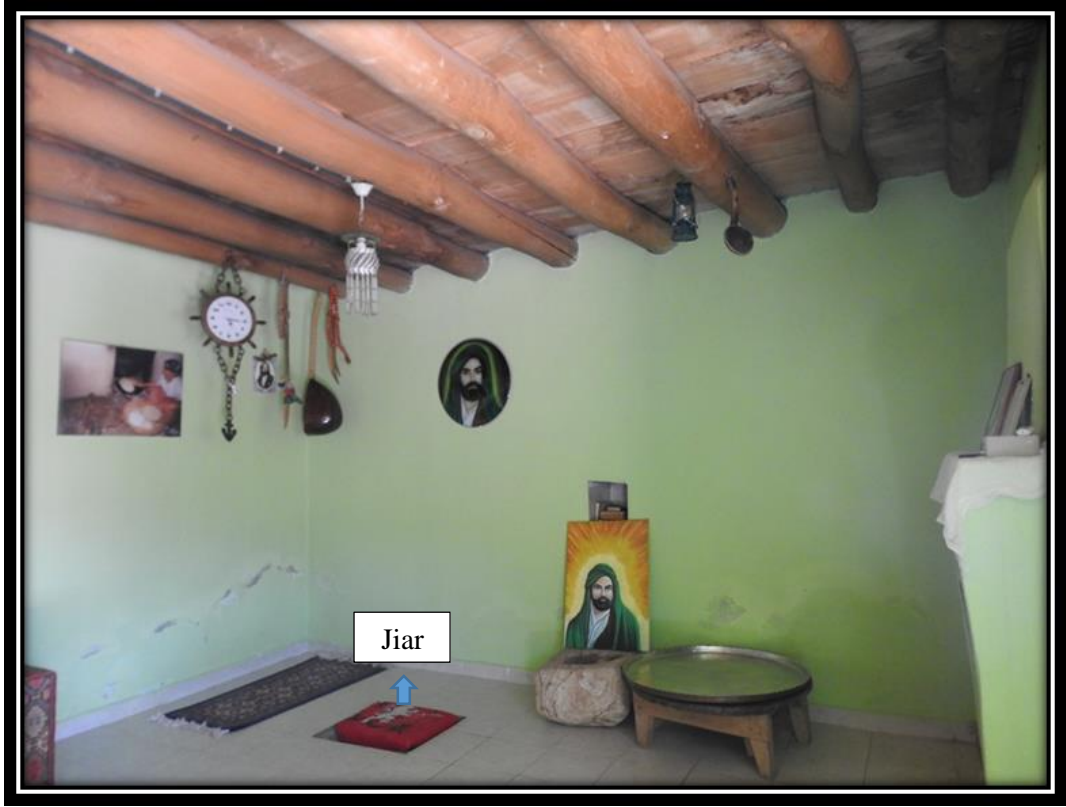
Şekil 22. Khalmem Ziyaret Alanı