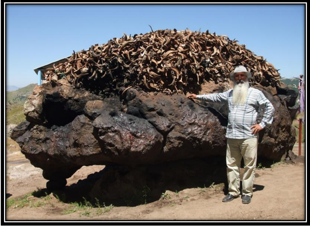
Şekil 21. Mekânda Kesilen Adak Hayvanların Boynuzlarının Biriktirilmesi (Ana Haskar Cem Evi Bölümü)

mekâna tekrar gelerek mekâna bırakılan herhangi bir koçbaşını alarak evlerinin girişine asarlar (Şekil 21).