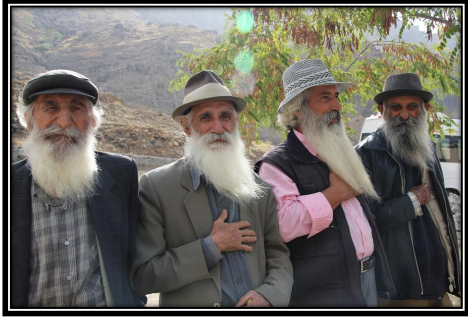
Şekil 2. Düzgün Baba Ziyaret Alanı Alevi Dedeleri

Nazimiye'deki kutsal mekânlar arasında talip ve Pir ilişkisi bulunmaktadır. Nazimiye bölgesine geçmiş zamanda gelen ve Pir sıfatını taşıyan Kureyş Baba'ya bölgede Khalmem, Kal Ferhat ve Mora Sur'un talip olduğu bölge halkı tarafından anlatılmaktadır. Rivayetlere göre bir zamanlar yaşadıkları savunulan bu erenlerin birbirlerinin kerametlerine şahit olması üzerine ikrar vermişlerdir. Batini âlemin erenleri olan bu ziyaretler arasında hala pir ve talip ilişkilerinin sürdüğüne inanılır. Günümüzde hak yoluna giren kişilere ise örnek makam teşkil etmektedir. Bu algı ile birlikte ziyaretler, inanç yönünden kültürel kimliği besleyen bir alan haline dönüşmüştür.