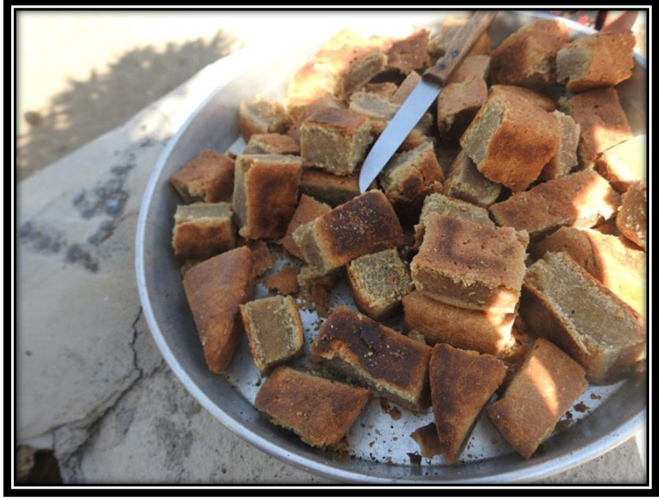
Şekil 30. Niyaz