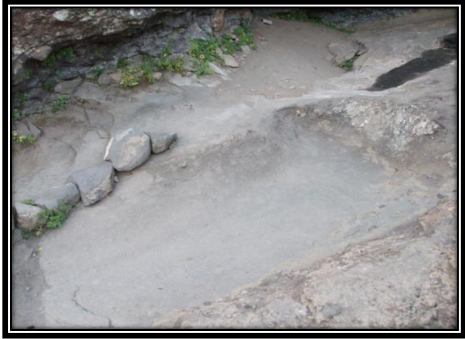
Şekil 14. Düzgün Baba'nın Yatağı