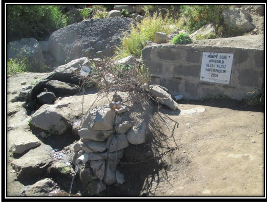
Şekil 10. Düzgün Baba Dağı Ceviz Çeşmesi (1808 m.)

Ceviz Çeşmesi'nden sonraki durak ise "Dilek Taşı"dır (Şekil 11). 1861 m. yükseklikte bulunan Dilek Taşı, insanların belli bir mesafede durarak, ellerine aldıkları taşı dilek dileyip, attıkları taştır. Attıkları taş kayanın üzerinde durursa dileklerinin kabul olacağına, durmazsa dileklerinin kabul olmayacağına inanılır. Bu ritüelin nereden geldiği ve nasıl oluştuğu bölge halkı tarafından bilinmemekle beraber, bilirkşi olarak adlandırdığımız dede veya pirlere tarafından hurafe olarak görülmektedir.