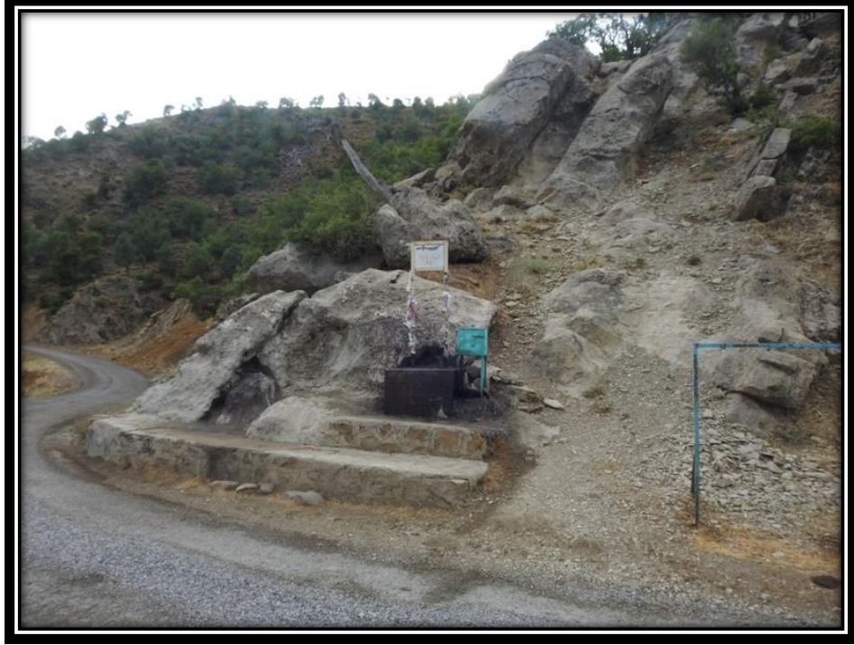
Şekil 28. Hızır Taşı

Düzgün Baba'ya gidiyoruz. Bu ziyareti görmüşken mum yakıp dilek dilemek istedik çıralık bıraktık (C.K.,Yaş;43, Almanya, 2017).