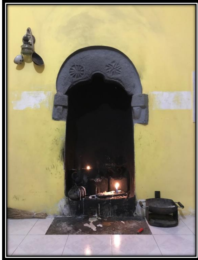
Şekil 6. Kureyş Baba Ocağı Çıra/Mumların Yakıldığı Kubbeyi Rahman alanı

Çıra nuru uyandırmak için yakılır. Şimdilerde mum yakılmakta ama mum normalde yakılmaz. Burası kubbeyi rahman kapısı yani cennetin kapısıdır. Burada çıra yakılarak nura seslenilir. Nur Allah'tır. İnsanlar şifa ve şefaet için mum ya da çıra yakarlar (F.G., 53 yaş, Nazimiye).