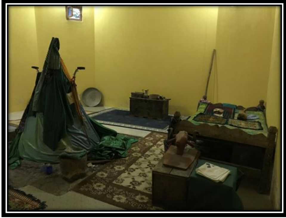
Şekil 7. İlk Cemin Tutulduğu Ve Pirlerin Kişisel Eşyalarının Bulunduğu Odadan Bir Görüntü

İnsanları dergâhına toplayan bu ziyaret bölgedeki diğer ziyaretlerde de olduğu gibi bir insanların yaşamlarındaki arayışına karşılık bulmak istediği ve atalarından gelen geleneklerin sürüldüğü kültür bölgesi konumundadır.