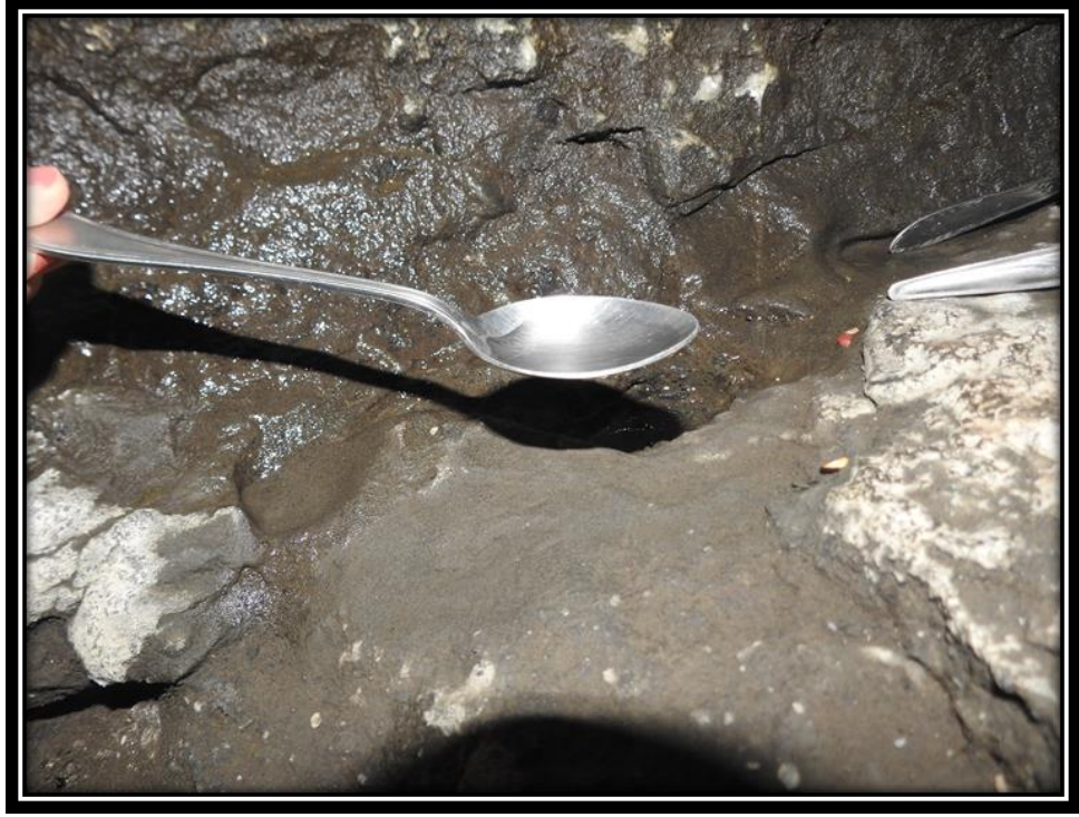
Şekil 16. Düzgün Baba Dağı'nda İkinci Mağarada Bulunan Sır Çeşmesi

İkinci mağarada Düzgün Baba'ya ait olduğu söylenen sembolik bir ayak izi de mevcuttur (Şekil 17).