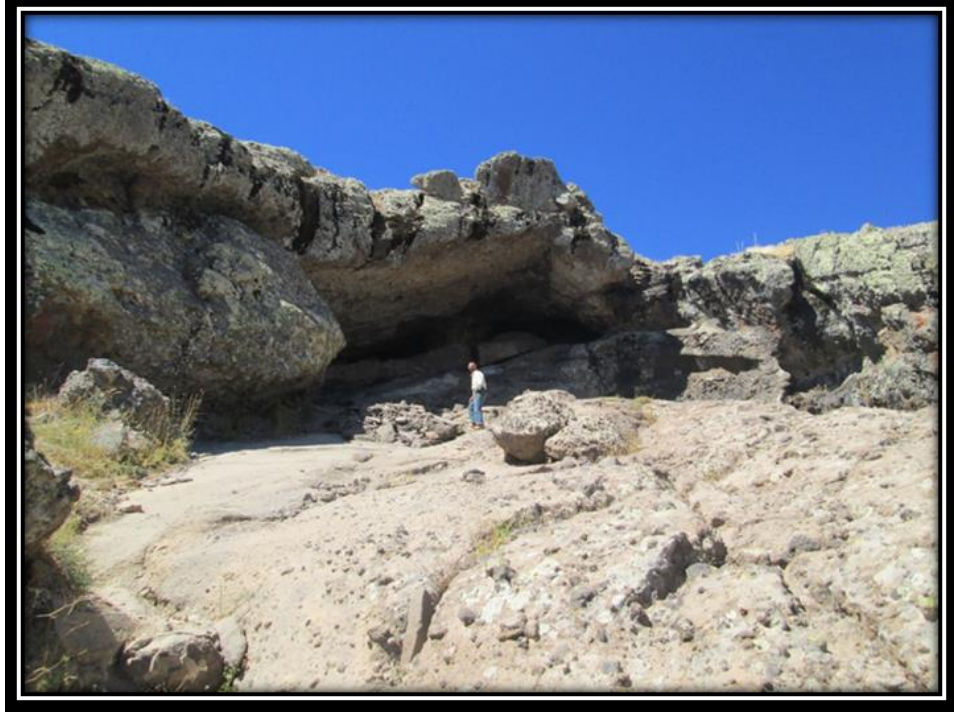
Şekil 13. Düzgün Baba Dağında Bulunan İkinci Mağaranın Giriş Bölümü