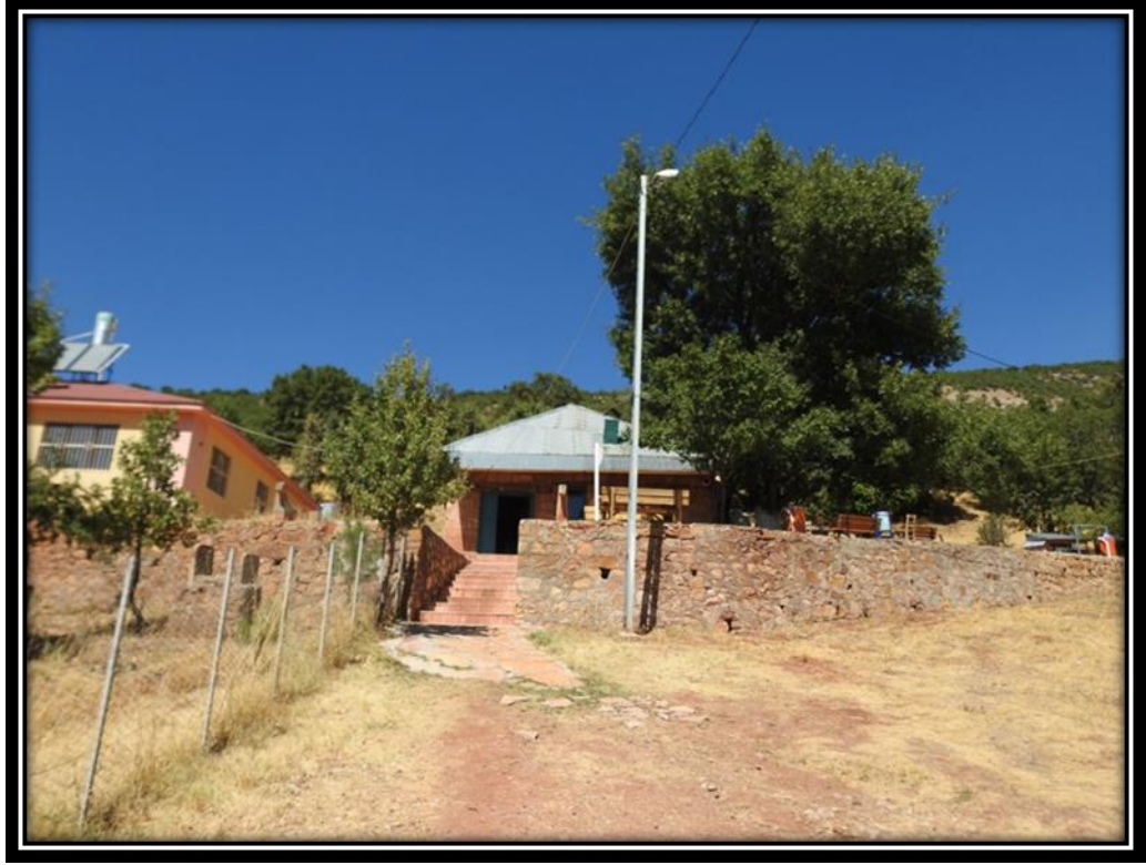
Şekil 23. Kal Ferhat Ziyaret Alanı