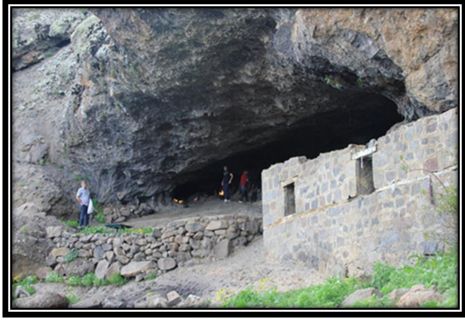
Şekil 12. Düzgün Baba Dağında Bulunan Birinci Mağara “Çilehane” (2000 m.)

İkinci mağara ise 2038 m. yükseltide bulunan ve Düzgün Baba'nın yaşadığı rivayet edilen mağaradır. Mağara içerisinde, Düzgün Baba'ya ait olduğu düşünülen sembolik bir yatak, Düzgün Baba'nın esasına ait olduğuna inanılan baston izinin yanında, iyi ve kötü insanı ayırt ettiğine inanılan sır çeşmesi olarak anılan bir kaynak suyu vardır (Şekil 13). Ziyaretçilere Düzgün Baba ile ilgili aktarılan bilgiler ışığında ona ait olduğu düşüncesini yansıtan sembolik şekiller bireylerin mekân ile ilişkisini güçlendirici pozisyonudur.