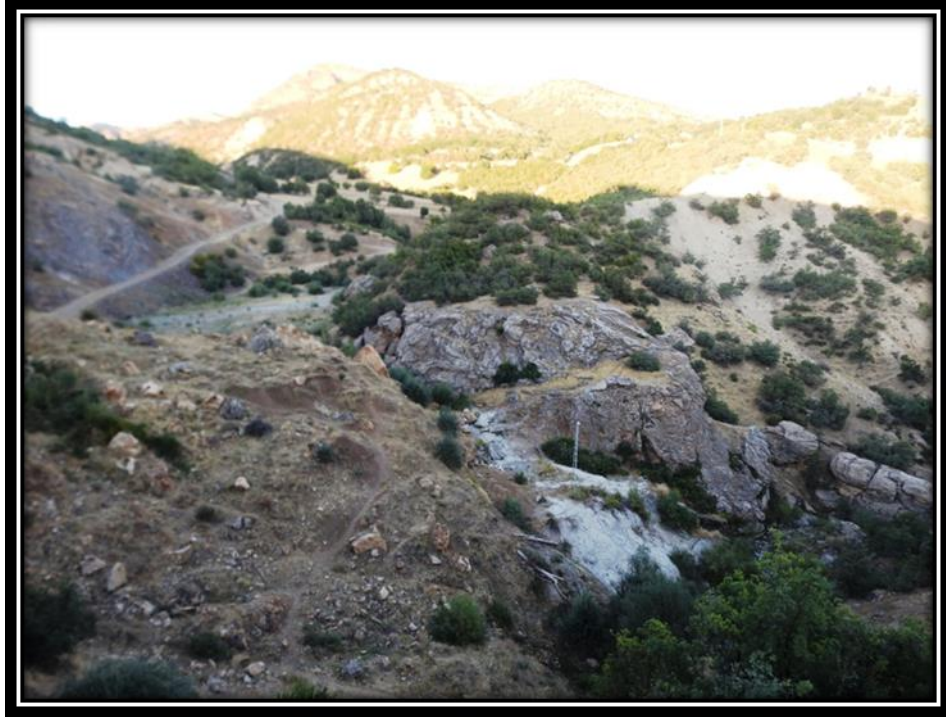
Şekil 3. Mora Sur Kaplıca Alanı Mermer Ocağının Etkileri

Morasur ziyaretinin yakınına taş ocağı açıldı. Mermer çıkarmak için, biz istemedik kimse dinlemedi bizleri, sonra taş ocağı ziyaretin kaplıcası üzerine çöktü (Şekil 3). Taş ocağını işletenler kaçtı gitti. Şimdi bu ziyaret bize küser gider. Koruyamadık onu, mekâna zarar verdiler. Şimdi eskisi kadar kimse gelmiyor (A.H., Yaş;31, Tunceli, 2017).