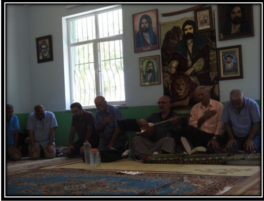
Şekil 32. Düzgün Baba Cem Evinde Tutulan Sohbet Cem'inden Yansımalar

herhangi belirlenen bir gün ve zaman aralığı yoktur. Bu durum tamamen Cem için uygun koşulların gerçekleşmesiyle alakalı bir durumdur.