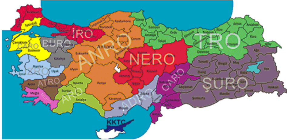
Şekil 3. Odaların Yetki Çevreleri