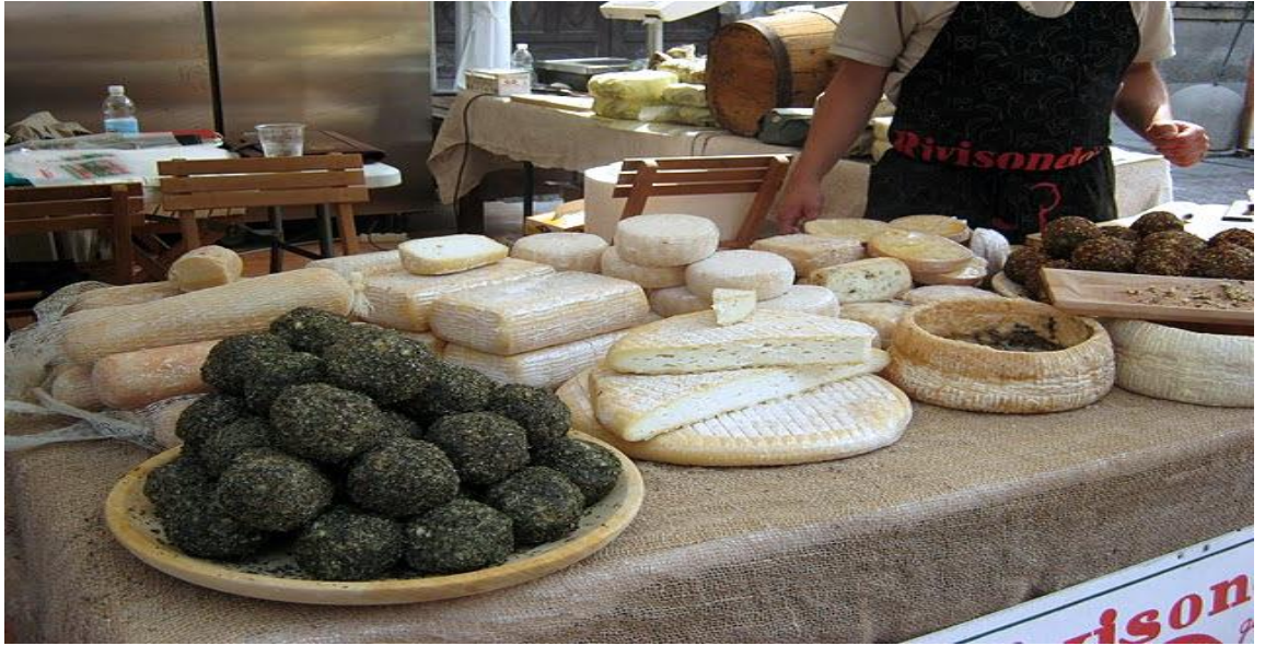
Kaynak: (Formaggio Kitchen, 2017).

Bra’da peynir imalathaneleri bir hayli yaygındır. Kentte peynire ve peynirciliğe olan ilginin artması imalathanelerinin de artmasına sebep olmuş bu nedenle yerli hayvancılıkta kalkınmıştır. Bu sayede bölgede işsizlik sorunu da