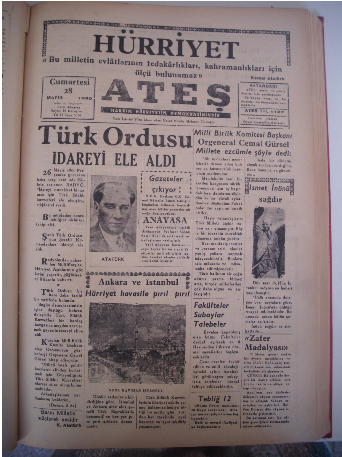
Resim 3: Ateş Gazetesi 28 Mayıs 1960