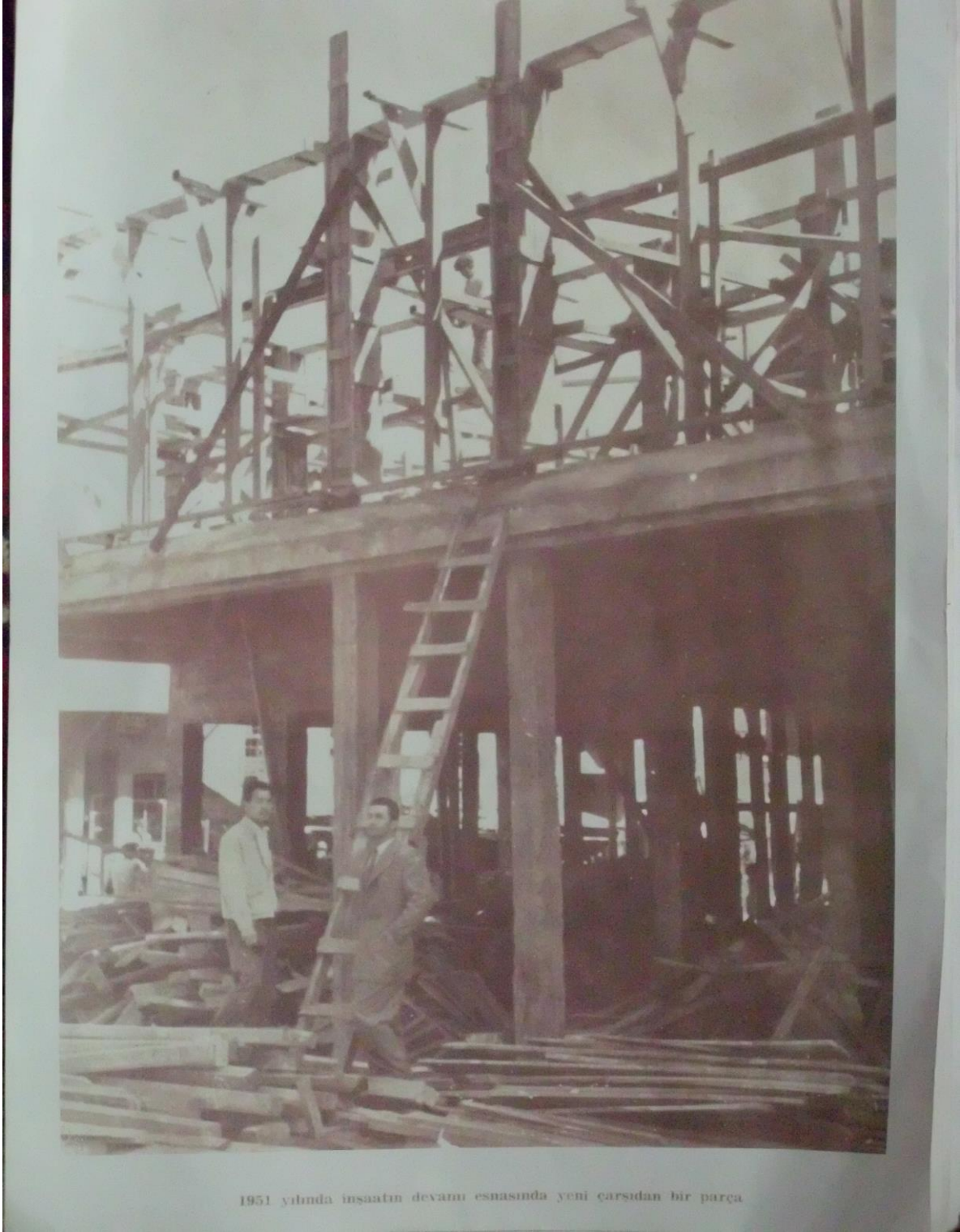
Resim 8: Ağustos 1950 tarihinde yanan çarşının inşaatı.