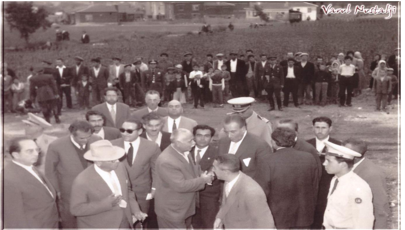
Resim 11: 1958 yılında yapılan açılış törenine Celal Bayar, Adnan Menderes ve Refik Koraltan katılmıştır.