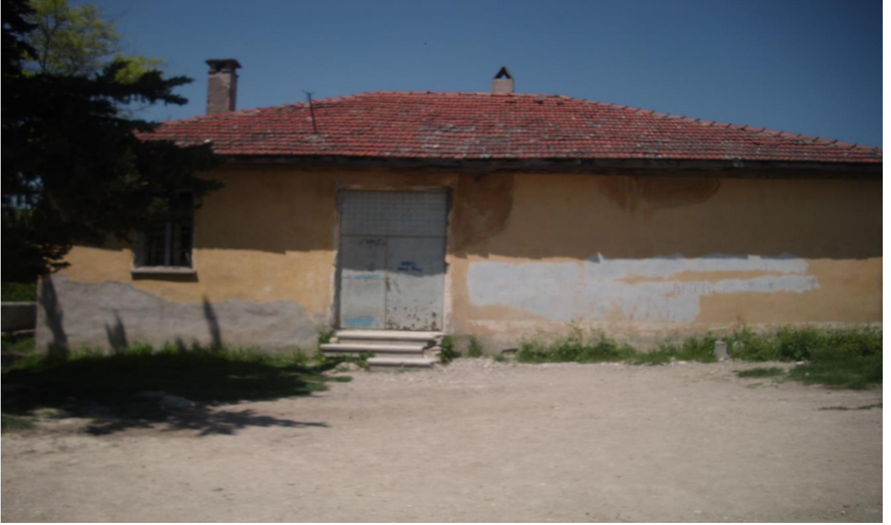
Resim 12: 1951 Yılında yapımına karar verilen Güvem Çepni Köyü İlk Öğretim Okulu.