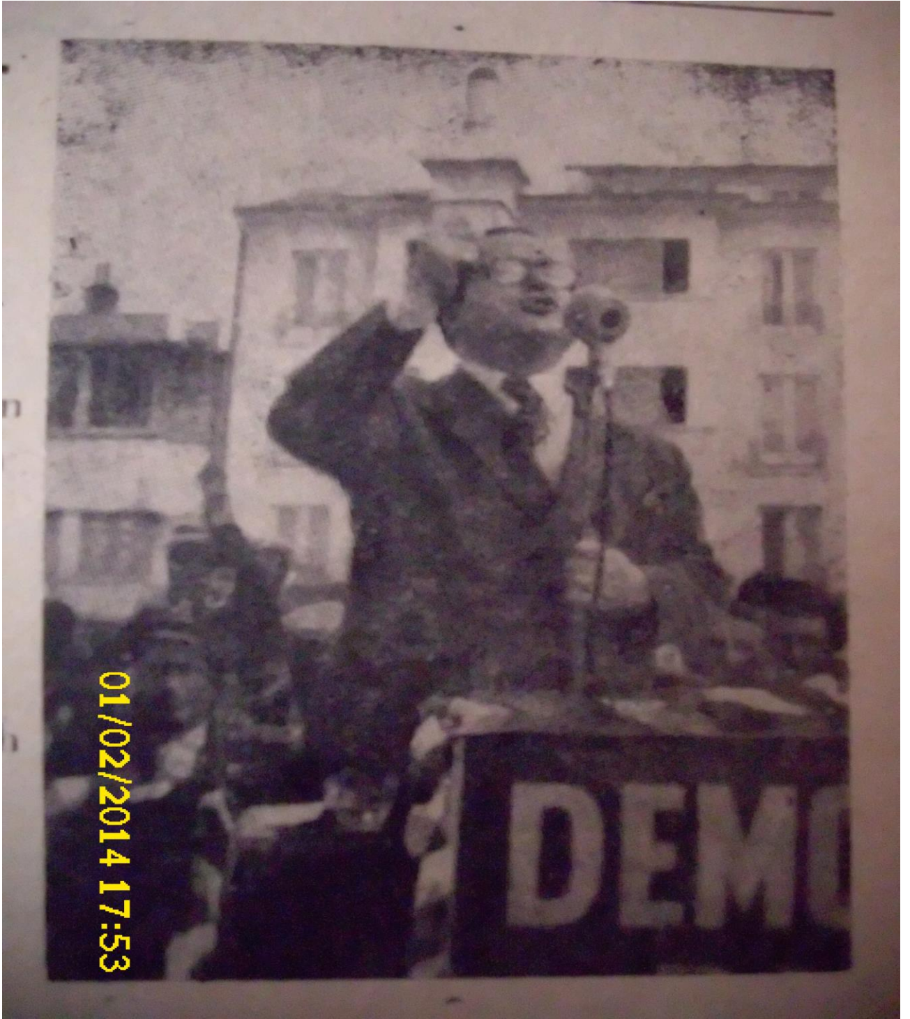
Resim 4: Sırrı Yırcalı'nın Demokrat Parti Balıkesir Seçim Mitingi, Balıkesir Postası, Mayıs 1954.