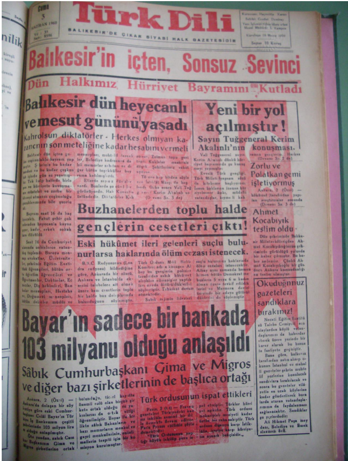
Resim 2: Türk Dili Gazetesi 3 Haziran 1960