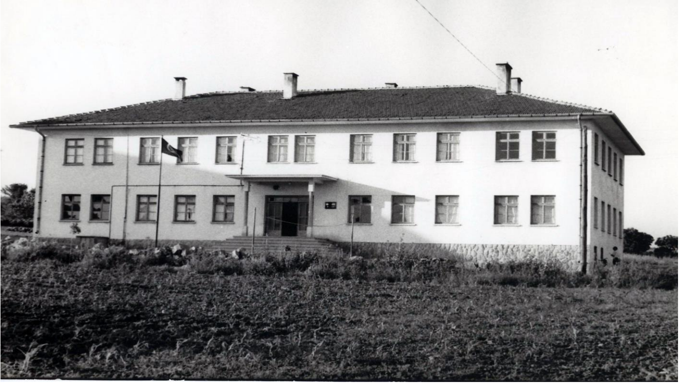
Resim 10: 1958 yılında açılan Balıkesir (Anadolu) İmam Hatip Lisesi.