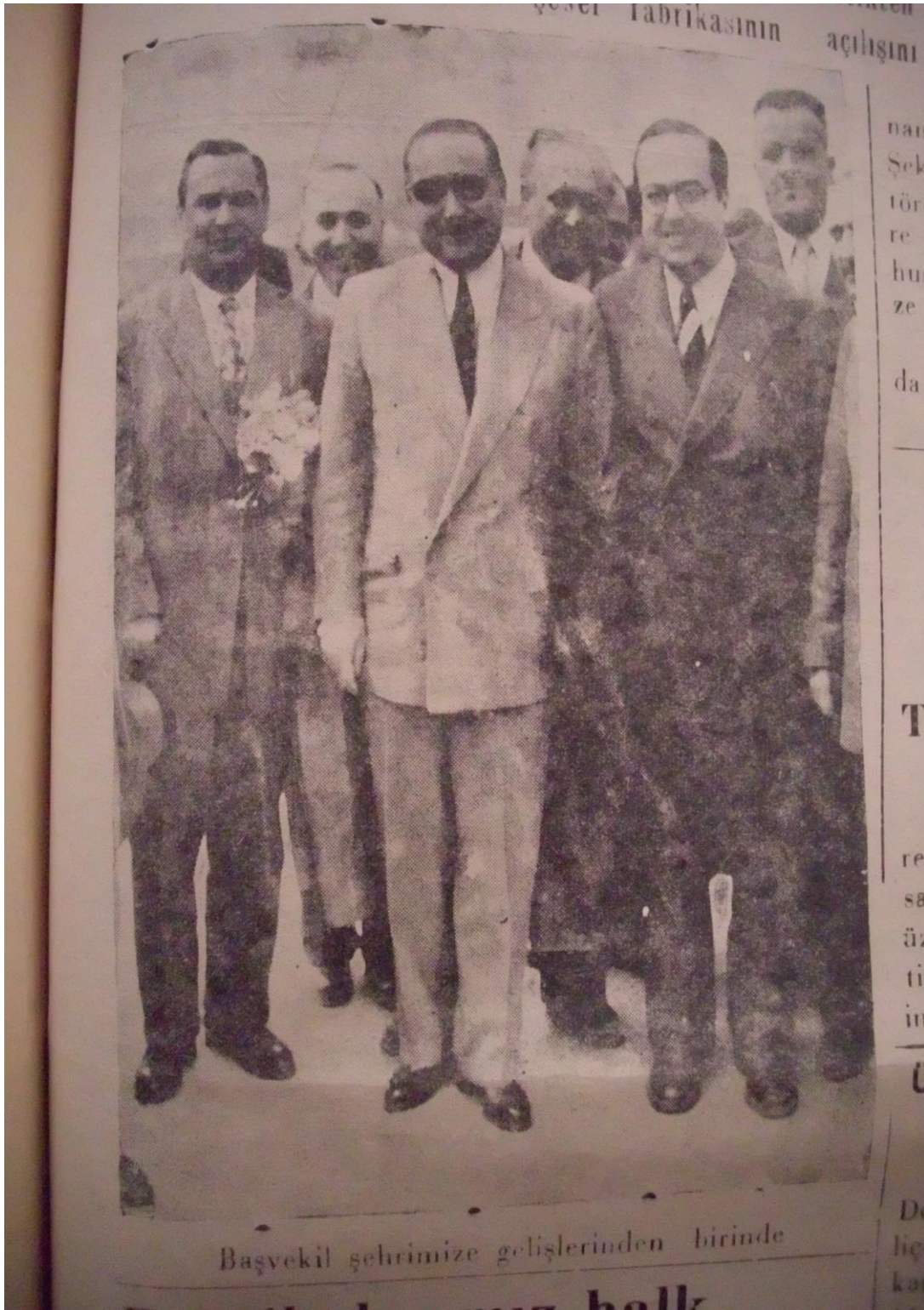
Resim 5: Adnan Menderes'in Balıkesir'i ziyareti Sırrı Yırcalı ile birlikte. Balıkesir Postası, 28 Eylül 1955.