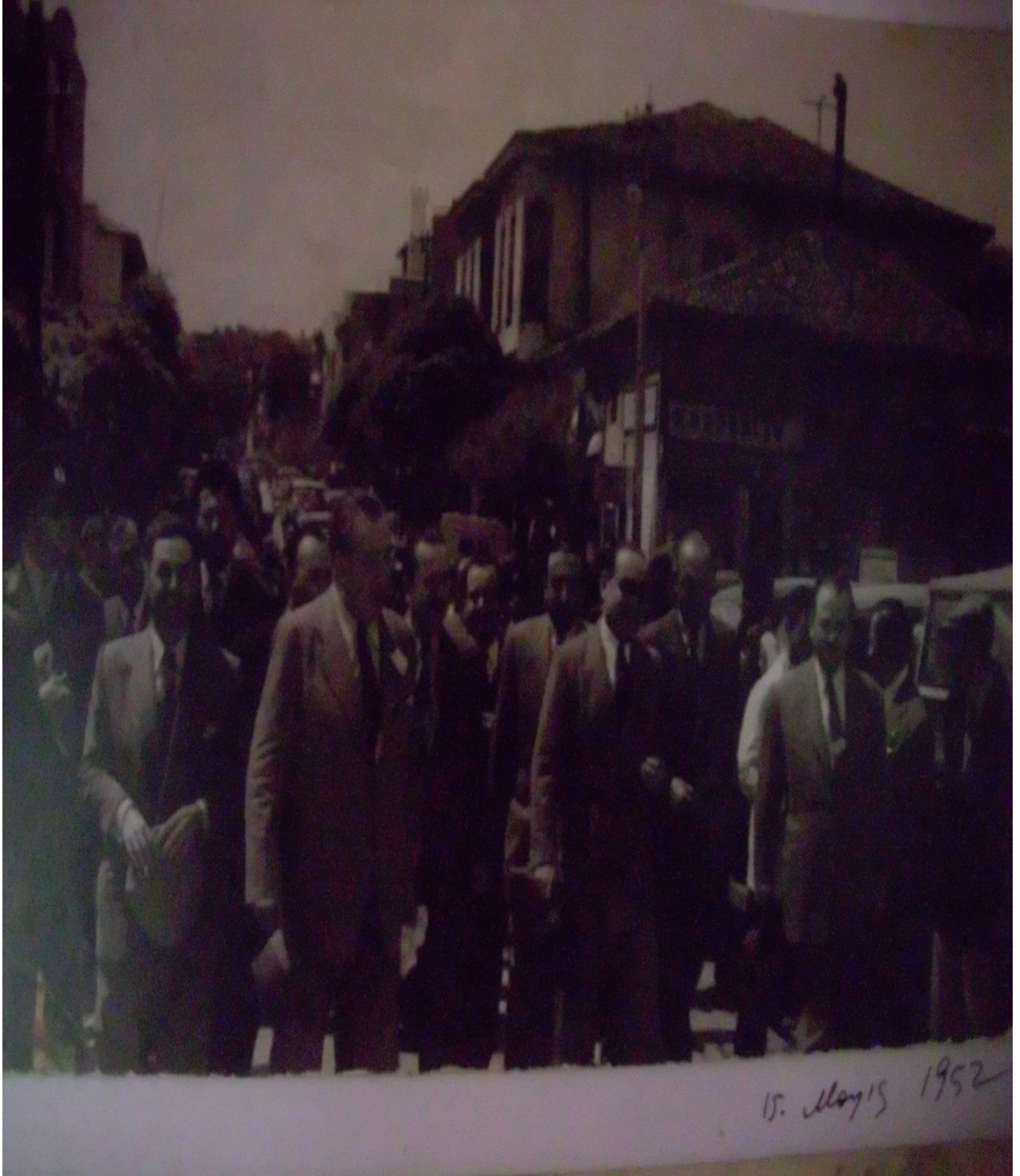
Resim 7: Adnan Menderes'in yeni yapılan arşının açılış töreni için Balıkesir ziyareti.