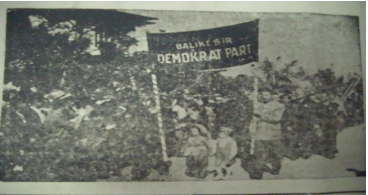
Resim 13: Balıkesir Demokrat Parti Mitingi, Ateş gazetesi 1954 Mayıs.