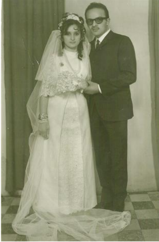
FOTOĞRAF 34: Safranboludan Eski Bir Gelin Damat Fotođrafı