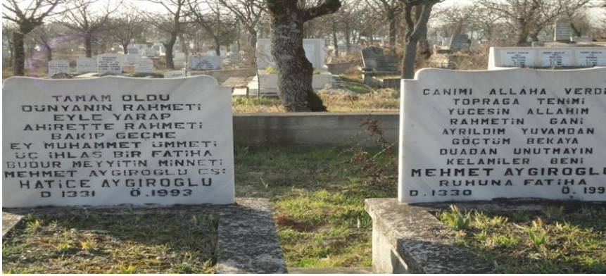
FOTOĞRAF 67: Ziyarete Gelenlerden Dua İsteyen Bir Mezar Taşı