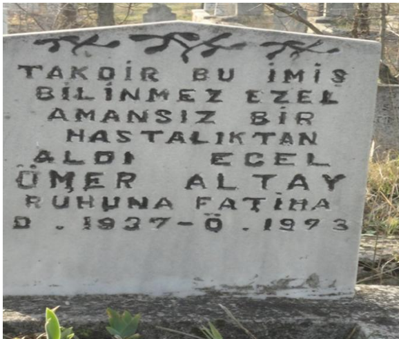
FOTOĞRAF 80: Ölüm Sebebini Amansız Hastalığa Bağladığını Belirten Mezar Taşı