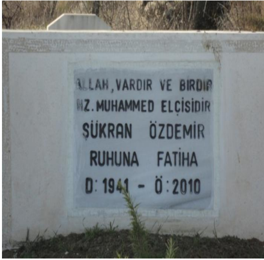
FOTOĞRAF 73: İslamiyetin Amentüsü Olan Kelime-i Şehâdetin Anlamının Yazıldığı Mezar Taşı (Özel arşiv)