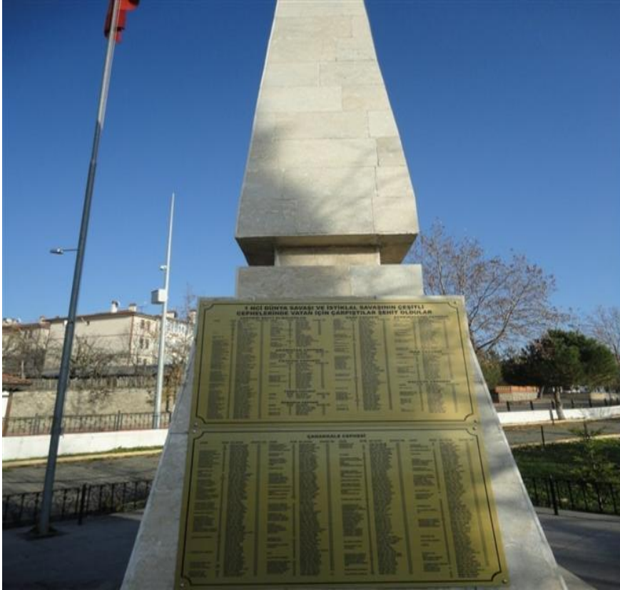
FOTOĞRAF 61: Terörle Mücadele Ederken Şehit Düşen Safranbolulu Gençler İçin Dikilen Anıt Mezar