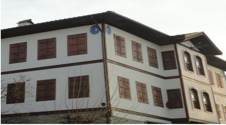
FOTOĞRAF 86: Evin Nazardan, Kötülüklerden Korunması İçin Asılmış Bir Geyik Boynuzu ve Nazar Boncuğu Şeklinde Boyanmış Bir Hilal Resmi