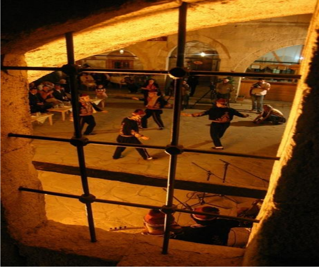
FOTOĞRAF 30: Safranbolu Cinci Hanında Seymen Oyunu Gösterisi 5