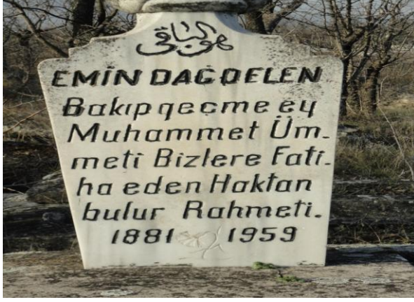
FOTOĞRAF 75: Mezarlığı Ziyarete Gelenlerden Dua İsteyen, Dua Edenlerin de Allahtan Rahmet Göreceğine İnanan Bir Mezar Taşı