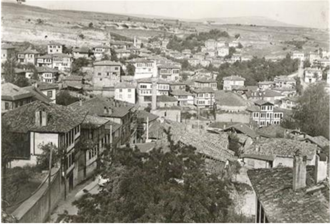
FOTOĞRAF 3: Yıllar Önce Çekilmiş Bir Safranbolu Fotoğrafı 1