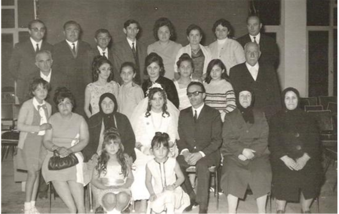
FOTOĞRAF 37: Safranboluya Ait Eski Bir Düğün Fotoğrafı 2