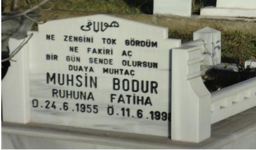
FOTOĞRAF 65: Ölümün Zengin Fakir Ayırmaksızın Herkese Geleceğini ve Herkesin Duaya Muhtaç Olduğunu Anlatan Bir Mezar Taşı