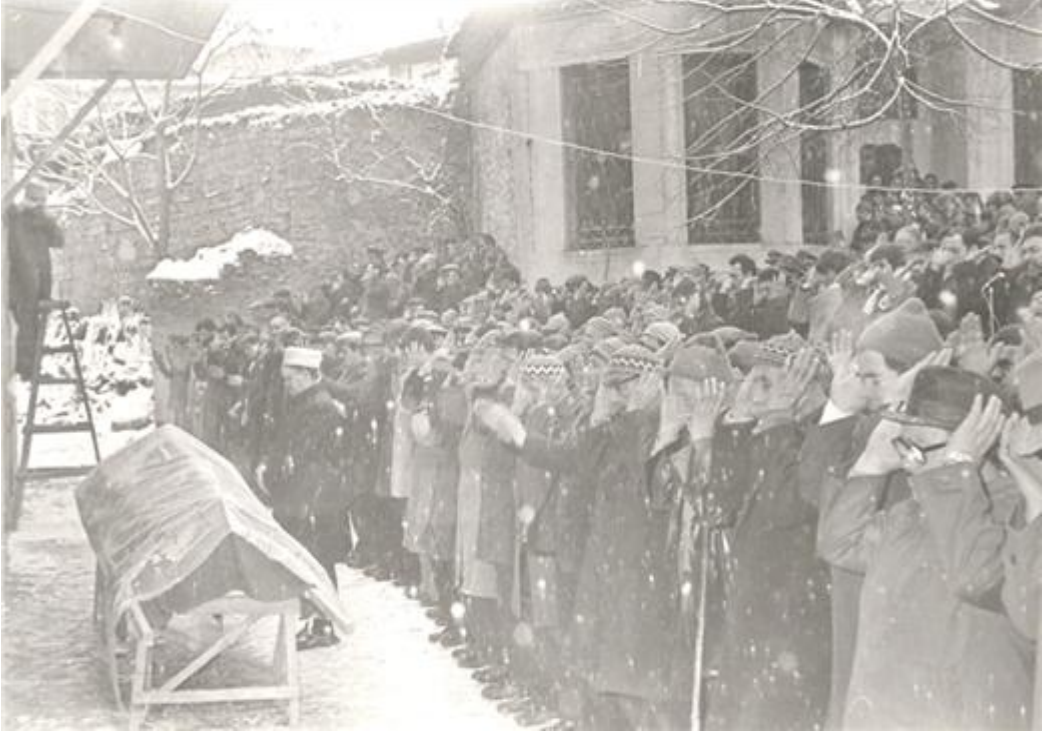
FOTOĞRAF 62: Safranboludaki Bir Cenaze Namazına Ait Fotoğraf