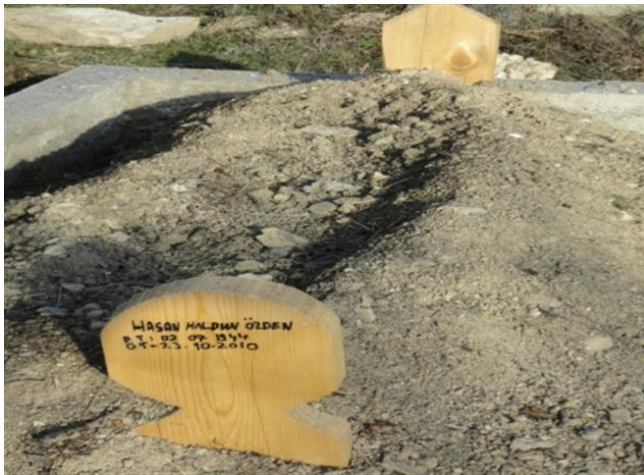
FOTOĞRAF 71: Fotoğrafın Çekildiği Tarihte Yeni Vefat Etmiş Olan Merhumun Tahtadan Yapılmış Mezar Taşı