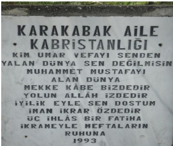
FOTOĞRAF 77: Dünyanın Fani Olduğunu, Peygamberimiz Hz. Muhammed'i Bile Aldığını Belirten Bir Mezar Taşı