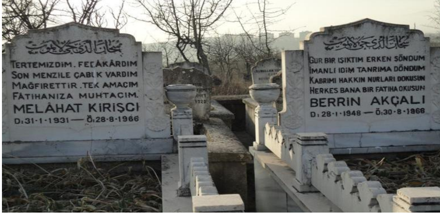
FOTOĞRAF 78: Ahirete Erken Göçtüğünü Düşünen ve Ziyaretçilerden Dua İsteyen Mezar Taşları