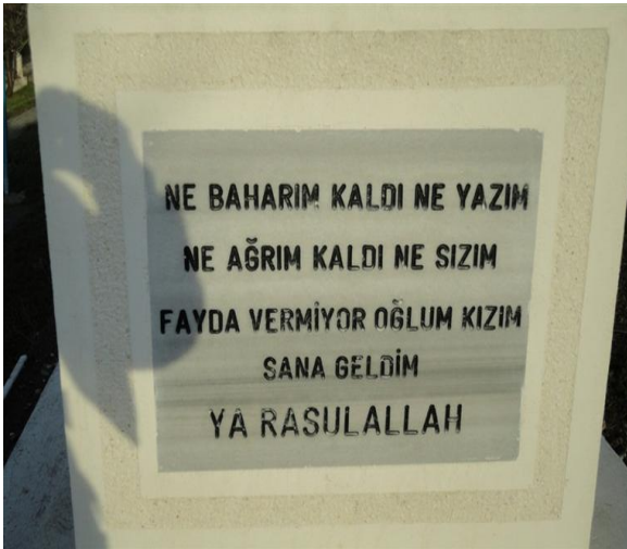
FOTOĞRAF 83: Ölümüm Tüm Üzüntülerden Uzaklaşmak Olduğunu Anlatan Bir Mezar Taşı