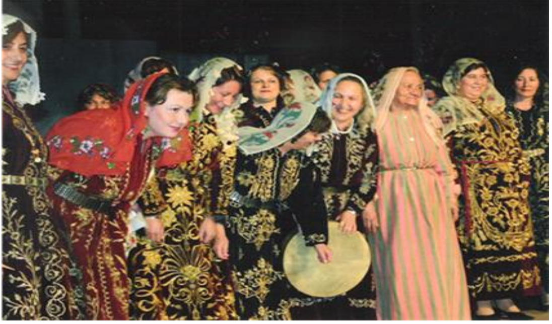
FOTOĞRAF 33: Tefebaş (Bindallı) Giymiş Kadınlar