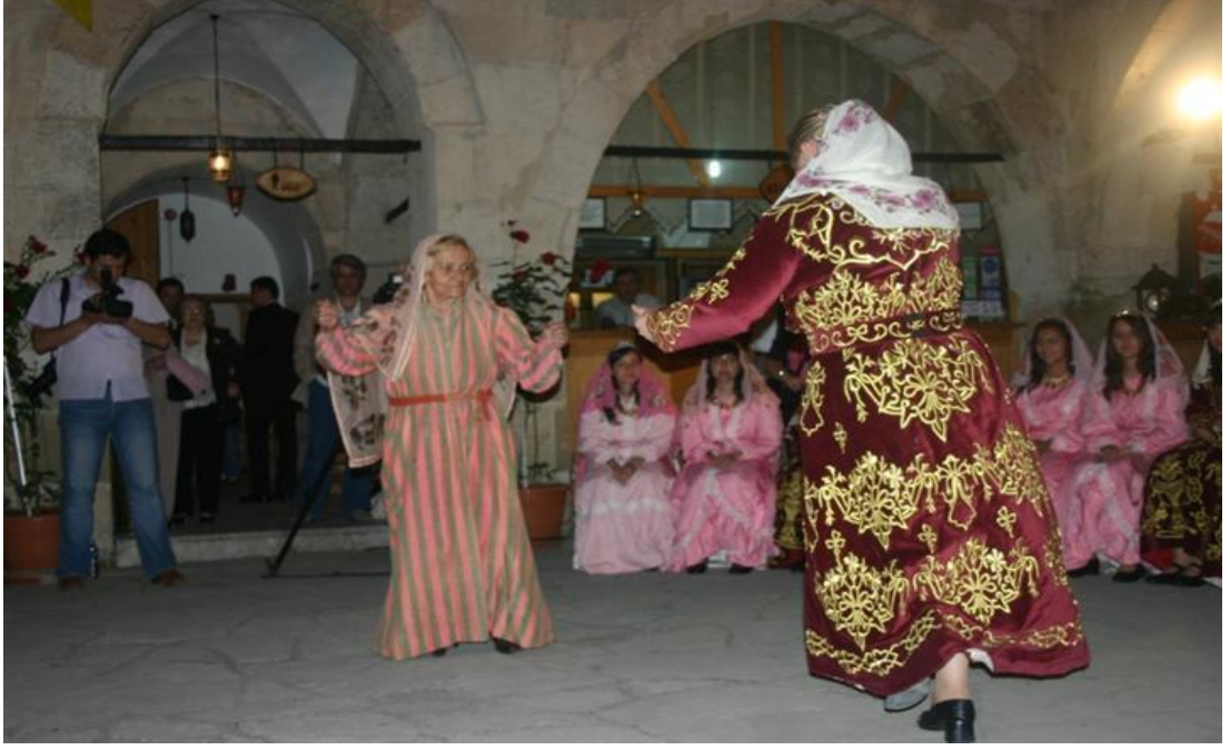
FOTOĞRAF 23: Safranbolu Kına Gecesi ve Düğünlerinde Oynanan Aç Kapı Oyununun Bindallı (Tefebaş) Giymiş Kızlar Tarafından Canlandırılması 3