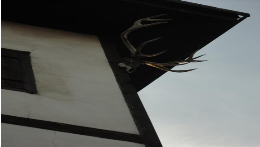
FOTOĞRAF 87: Geyik Boynuzunun Bulunduğu Başka Bir Safranbolu Evi