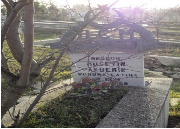
FOTOĞRAF 82: Üzerine Demirden Ay Yıldız Sembolü Konmuş Bir Mezar Taşı