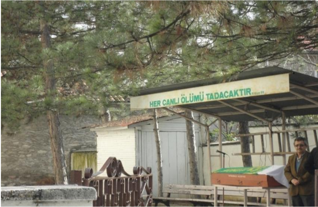
FOTOĞRAF 63: Safranboludan Bir Cenaze Töreni (Cenaze Kadın Olduğu İçin Beyaz Tülbent Örtülmüştür).