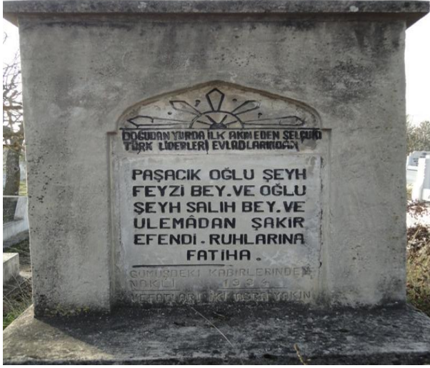
FOTOĞRAF 79: Ailesinin Soy Kütüğünü Belirten Bir Mezar Taşı (Mezarın Nakil Olduğunu ve Tarihini Belirtiyor).