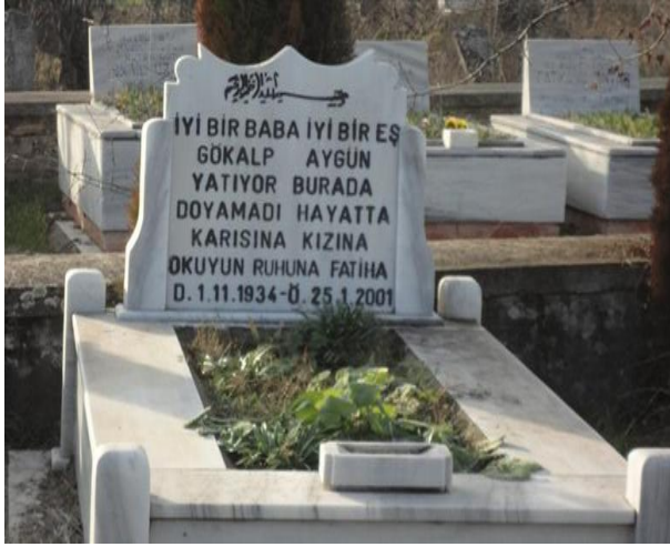
FOTOĞRAF 76: Ailesinden Erken Ayrılan Bir Babanın Eşi ve Kızı Tarafından Yazılan Mezar Taşı