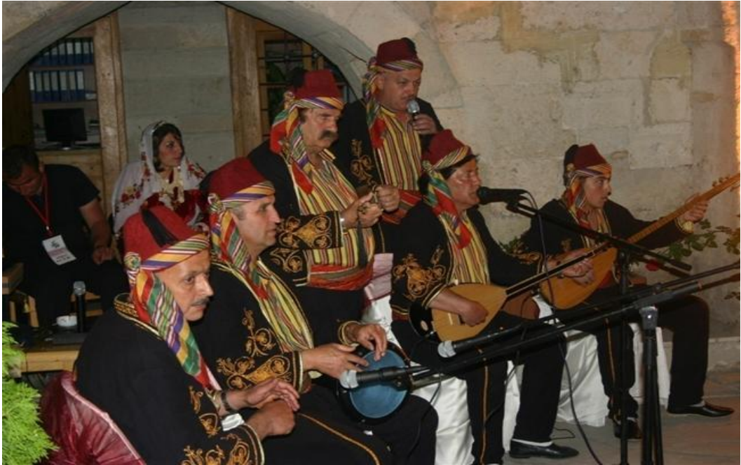
FOTOĞRAF 28: Safranbolu Cinci Hanı'nda Seymen Oyunu Gösterisi 3