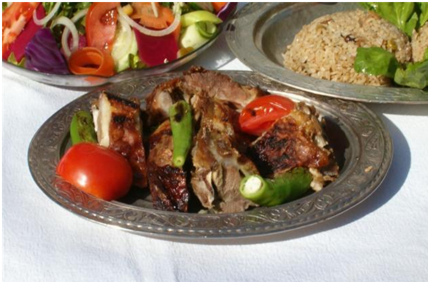
FOTOĞRAF 40: Kuyu Kebabı