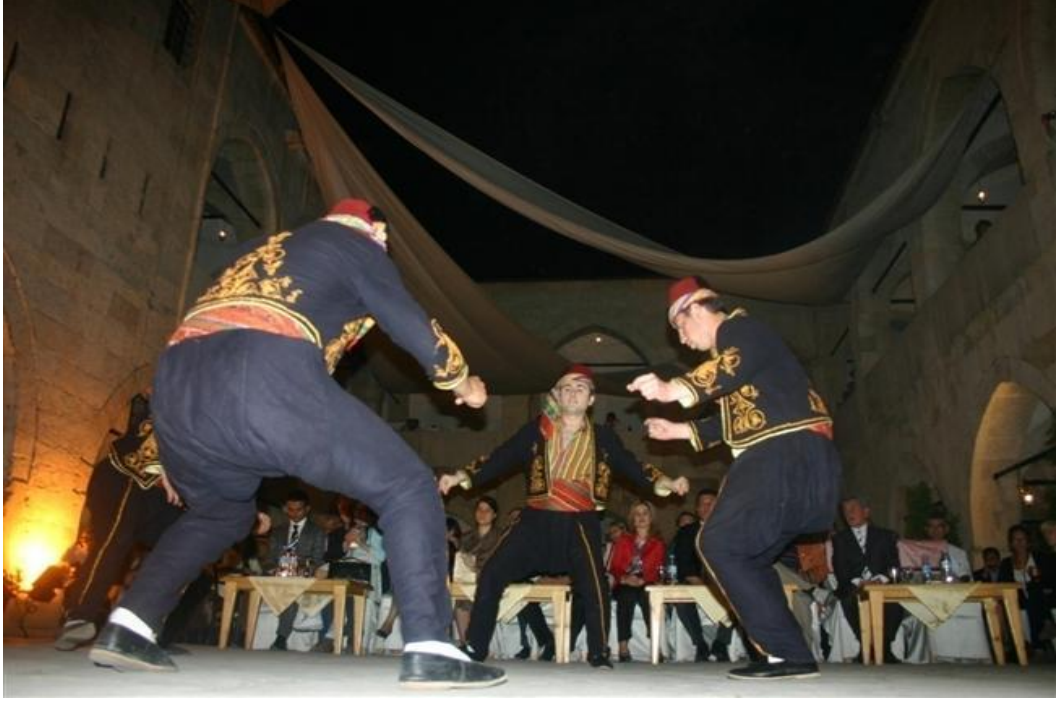
FOTOĞRAF 27: Safranbolu Cinci Hanı'nda Seymen Oyunu Gösterisi 2