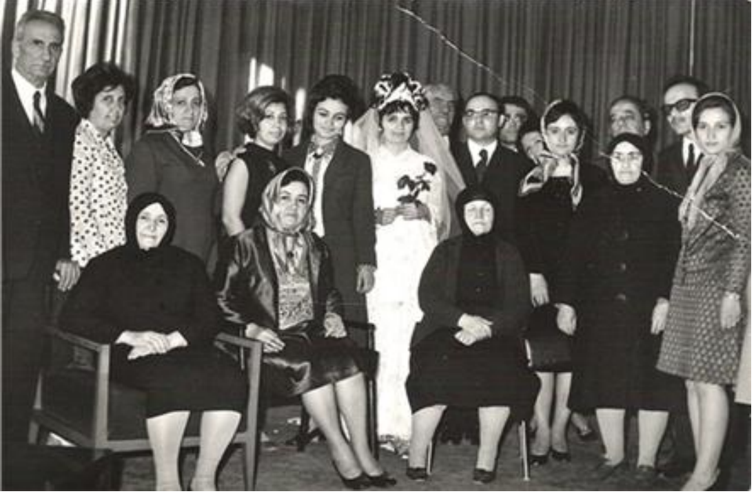
FOTOĞRAF 36: Safranboluya Ait Eski Bir Düğün Fotoğrafı 1