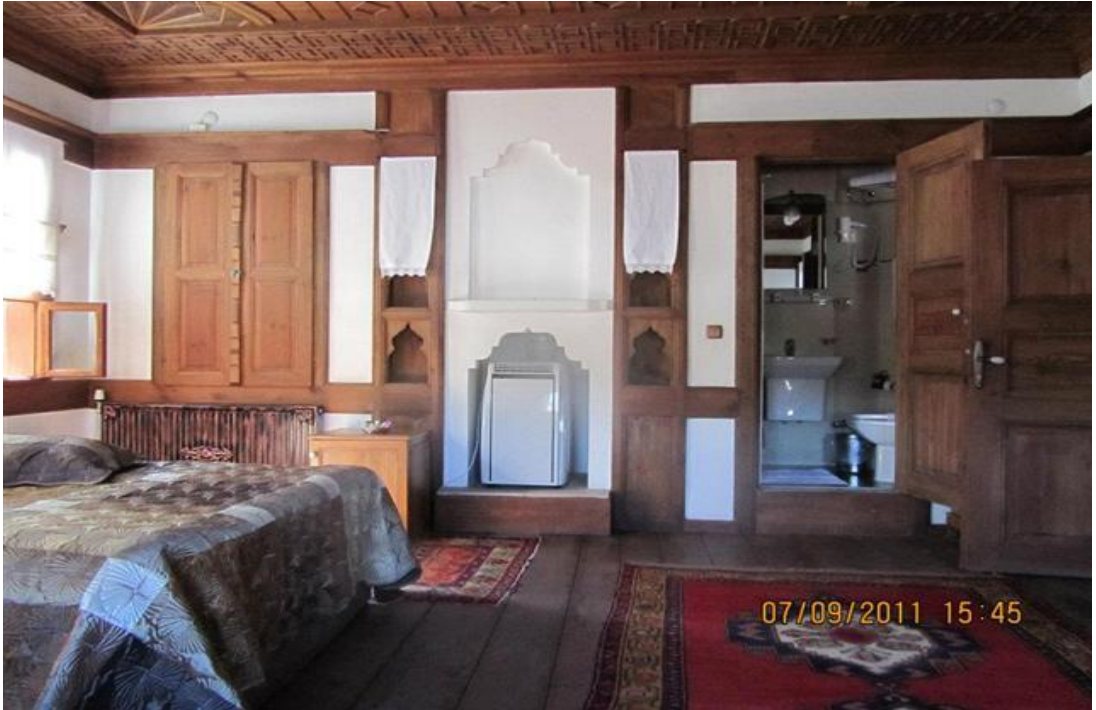
FOTOĞRAF 6: Restore Edilerek Otel Olarak Kullanılmaya Başlanmış Bir Safranbolu Evi