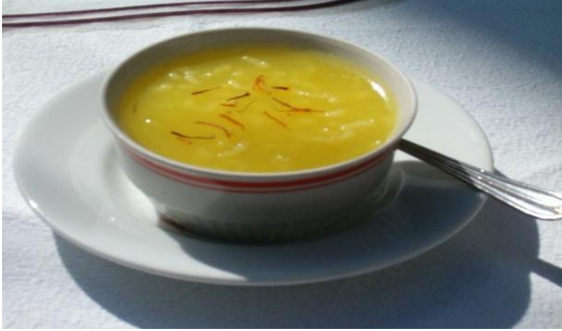
FOTOĞRAF 39: Safranlı Zerde Tatlısı