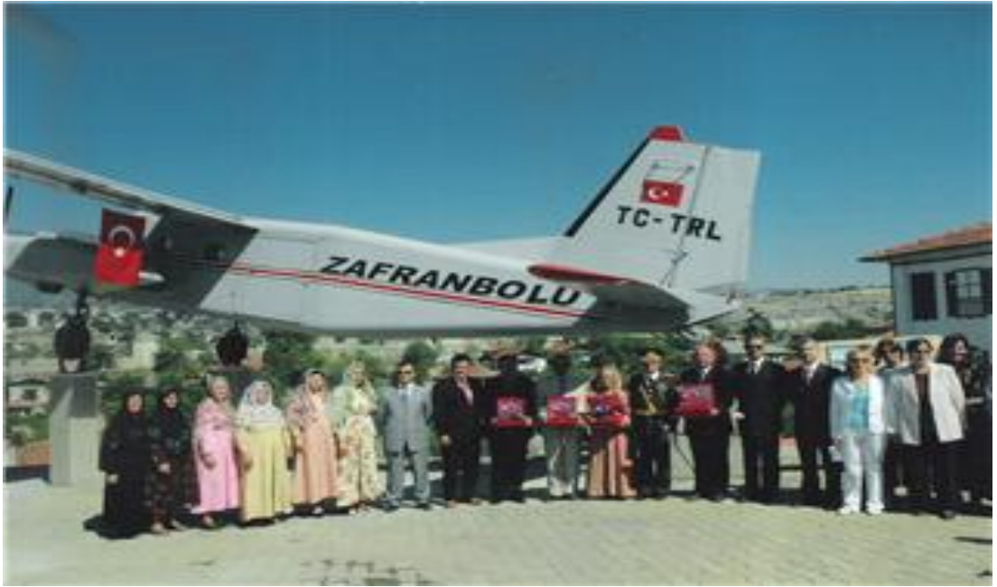
FOTOĞRAF 16: 30 Ağustos 1931 Yılında Safranbolu Halkının Katkılarıyla Hava Kuvvetlerine Hediye Edilen Avcı Uçağı