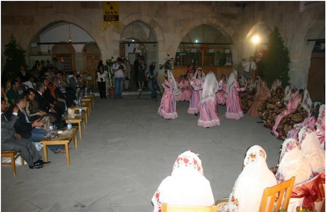
FOTOĞRAF 22: Safranbolu Kına Gecesi Ve Düğünlerinde Oynanan Aç Kapı Oyununun Bindallı (Tefebaş) Giymiş Kızlar Tarafından Canlandırılması 2