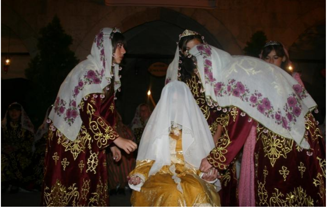
FOTOĞRAF 25: Safranboludan Bir Kına Gecesi Canlandırması, Cinci Hanı'nda Bindallı (Tefebaş) Giymiş Kızlar Kına Yakarken