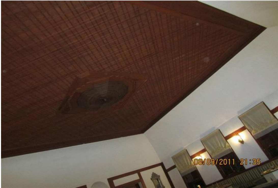
FOTOĞRAF 12: Safranbolu Evlerine Has Tavan Süslemesi