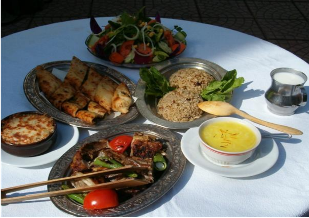
FOTOĞRAF 47: Kuyu Kebabı, İçli Pilav, Safranlı Zerde, Ispanaklı, Kıymalı Bükme, Yayık Ayranı, Mevsim Salatası