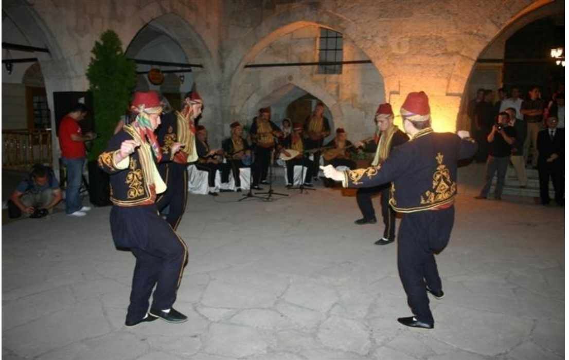
FOTOĞRAF 26: Safranbolu Cinci Hanı'nda Seymen Oyunu Gösterisi 1