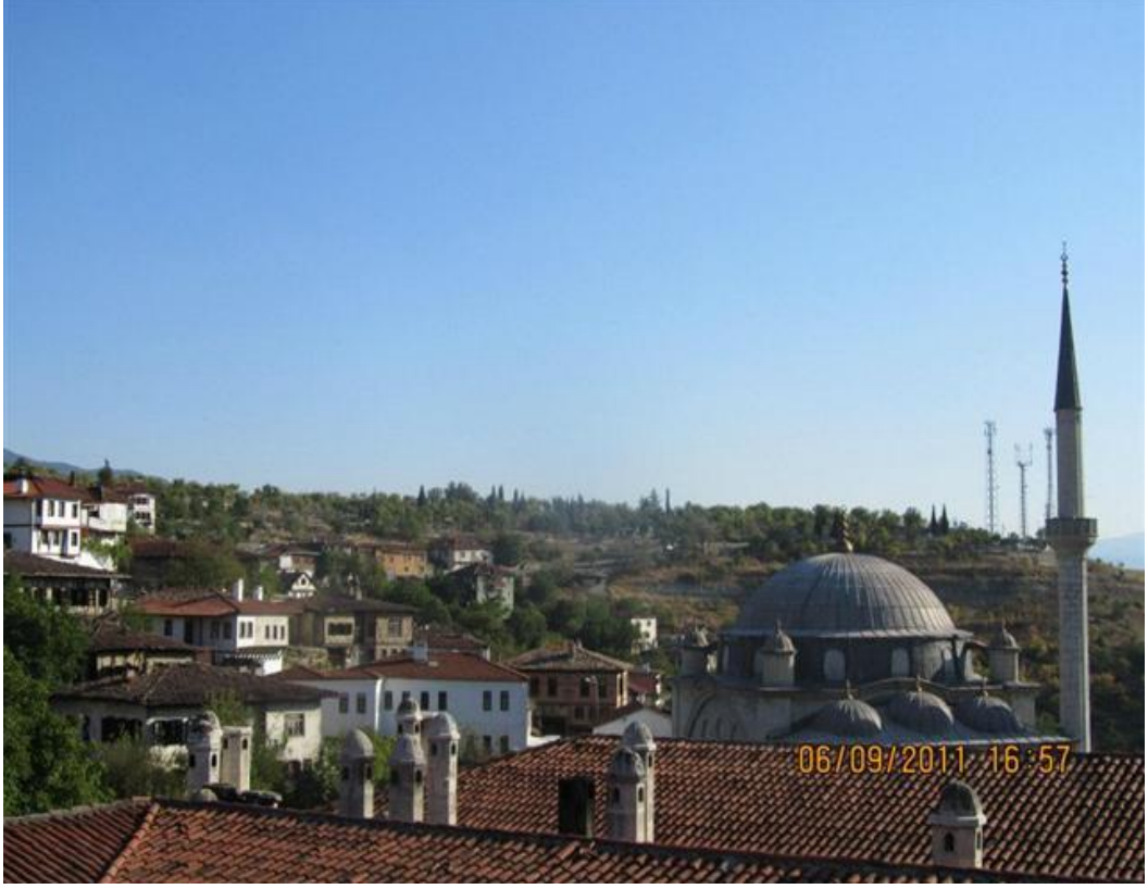
FOTOĞRAF 58: Cinci Hamamı ve Uzaktan Safranbolu Mezarlığı