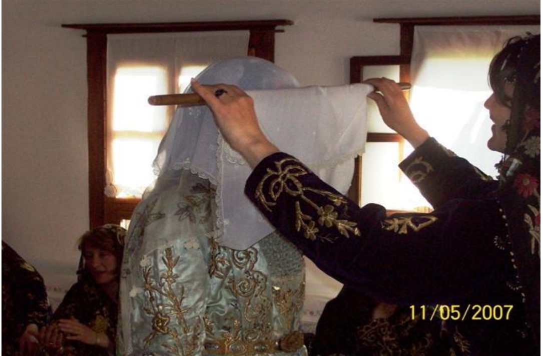
FOTOĞRAF 32: Duvak Serpme 2