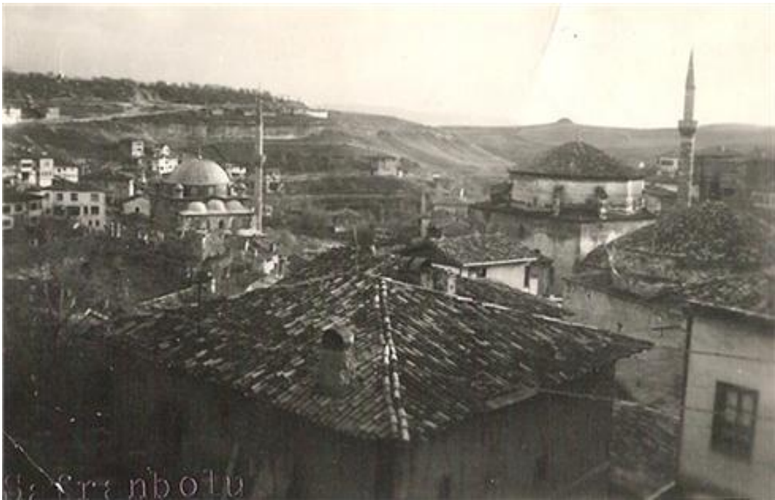
FOTOĞRAF 4: Yıllar Önce Çekilmiş Bir Safranbolu Fotoğrafı 2