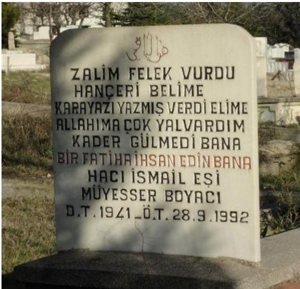
FOTOĞRAF 68: Kaderine İsyân Eden Bir Kişinin Mezar Taşı