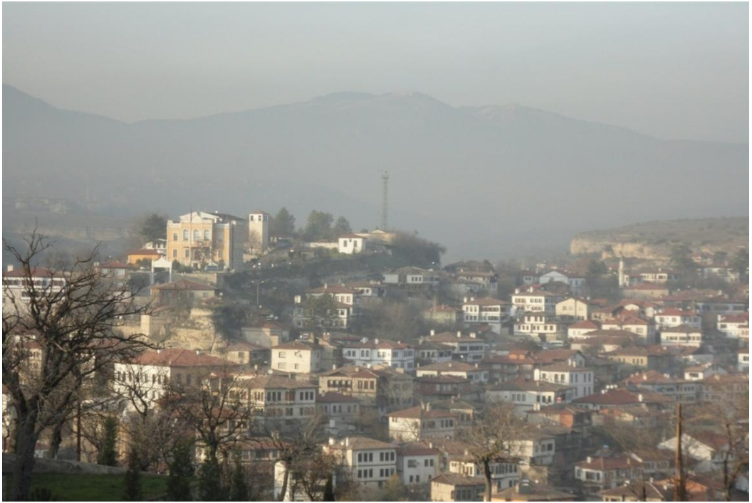
FOTOĞRAF 59: Mezarlıktan Safranbolu'nun Genel Görünümü 1