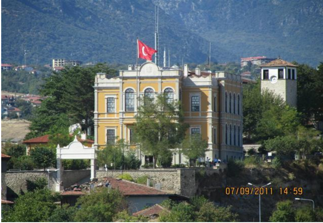
FOTOĞRAF 7: Eski Hükümet Konağı (Günümüzde Kent Müzesi Olarak Kullanılmakta)