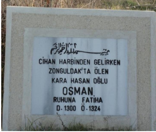
FOTOĞRAF 72: Dünya Savaşından Dönerken Ölen Bir Kişinin Mezar Taşı