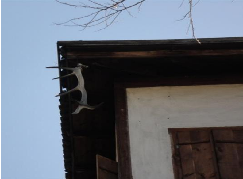
FOTOĞRAF 85: Geyik Boynuzunun Evi Kötülüklerden Nazardan Koruyacağına İnanılarak Asılmış Bir Safranbolu Evi