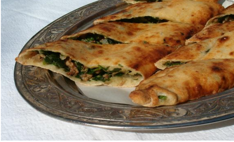
FOTOĞRAF 41: Ispanaklı Kıymalı Bükme