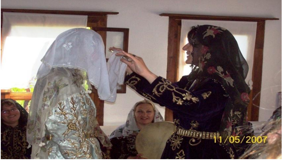
FOTOĞRAF 31: Duvak Serpme 1