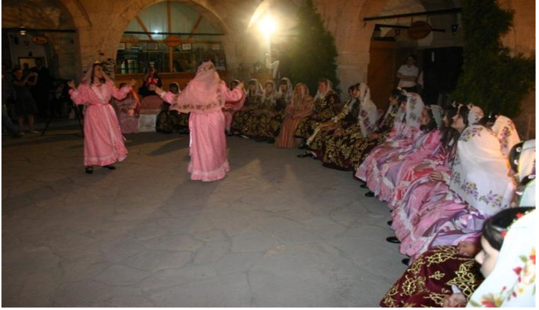
FOTOĞRAF 21: Safranbolu Kına Gecesi Ve Düğünlerinde Oynanan Aç Kapı Oyununun Bindallı (Tefebaş) Giymiş Kızlar Tarafından Canlandırılması 1