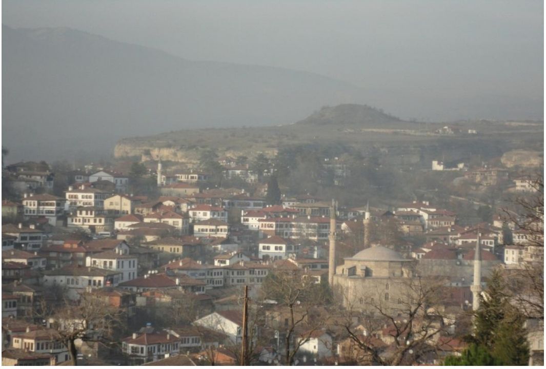
FOTOĞRAF 60: Mezarlıktan Safranbolu'nun Genel Görünümü 2