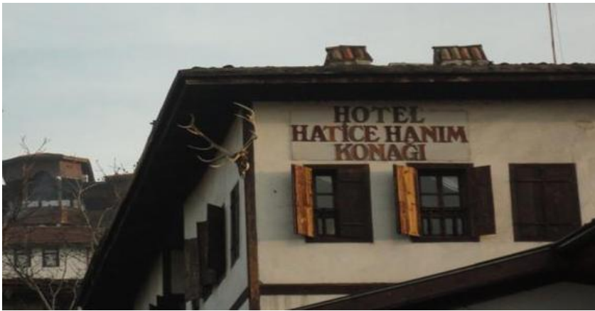
FOTOĞRAF 88: Otel Olarak Kullanılmakta Olan Bir Safranbolu Evi ve Geyik Boynuzu