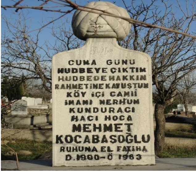
FOTOĞRAF 66: Mesleğini İcra Ederken Ölen İmanın Mezar Taşı