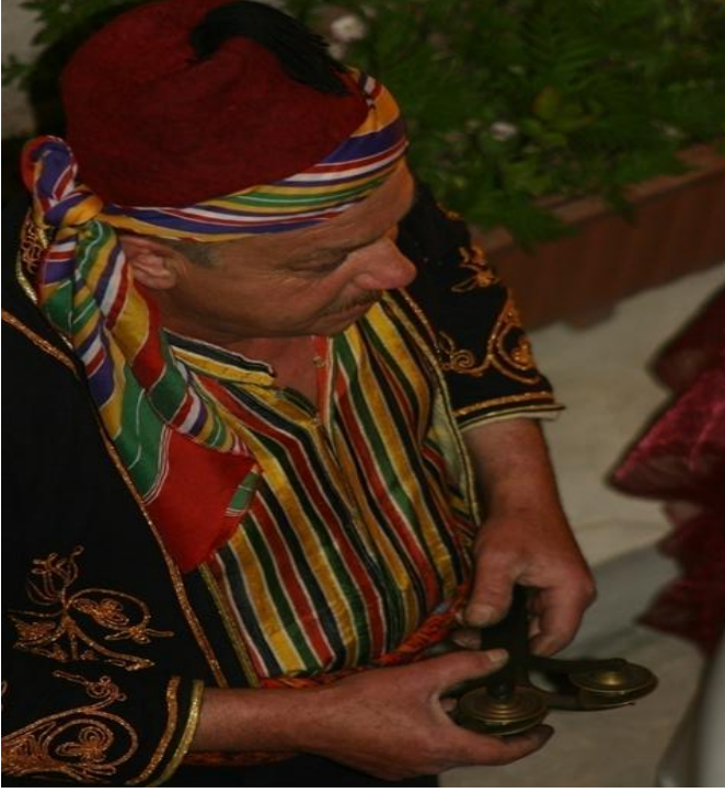
FOTOĞRAF 29: Safranbolu Cinci Hanında Seymen Oyunu Gösterisi 4