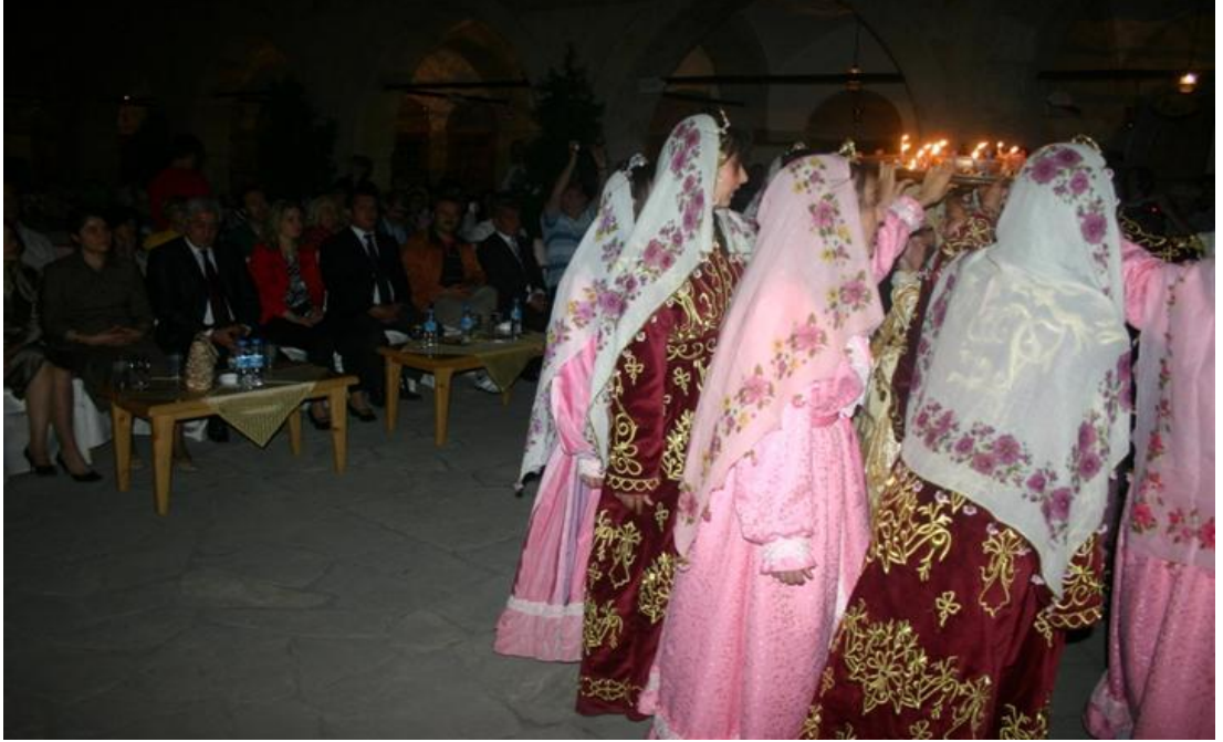
FOTOĞRAF 24: Safranboludan Bir Kına Gecesi Canlandırması, Bindallı (Tefebaş) Giymiş Kızlar Kabem İlahisi Söyleyip Sini Çevirirken