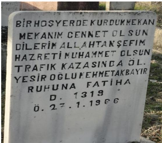
FOTOĞRAF 74: Ölüm Sebebini ve Dinî İnancını Belirten Bir Mezar Taşı