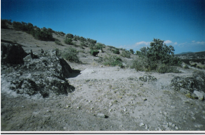
a Parçalanmış sunak