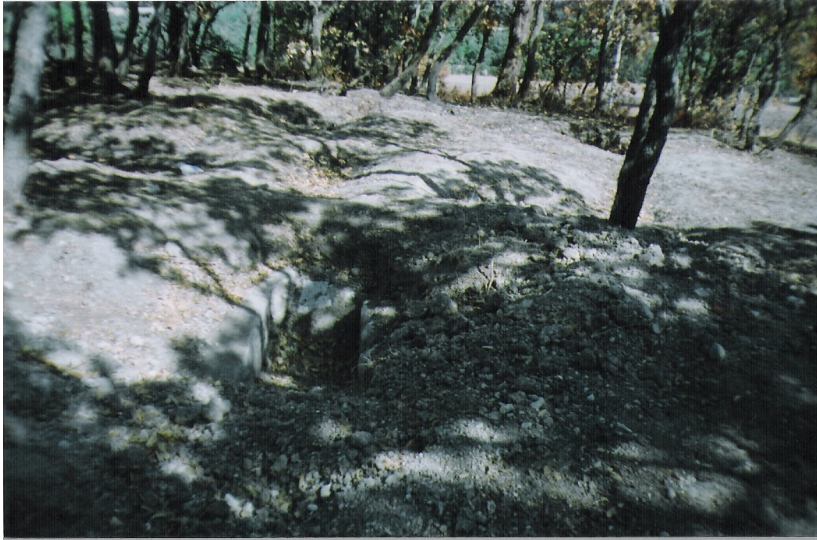
b Geç Roma- Bizans nekropolü