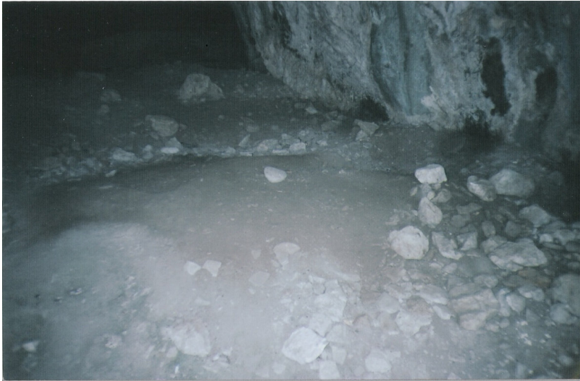
b Karanlık mağara