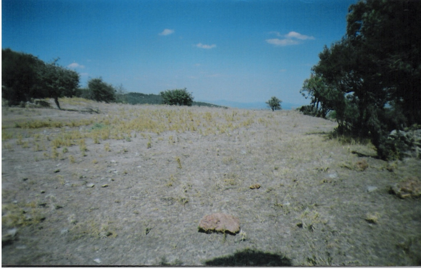
a Yerleşim alanı