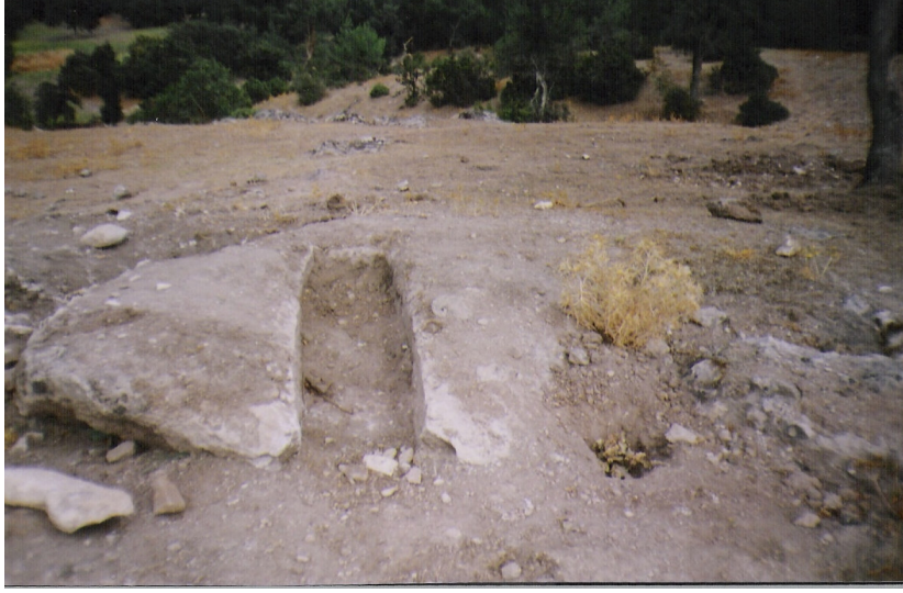
a Parçalanmış sandık tipi bir mezar