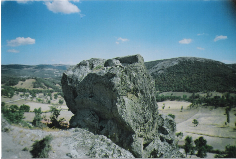
b Kaya üzerine oyulmuş bir mezar yada sunak