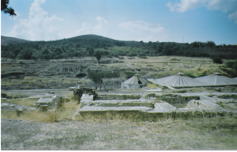
a Allianoi antik kenti kalıntıları