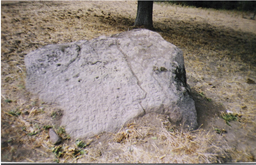
b Aynı alandaki eski Yunanca yazıt