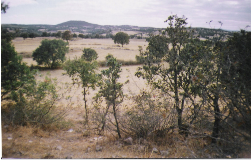
a Yukarı kentten aŐađı kente bakıŐ