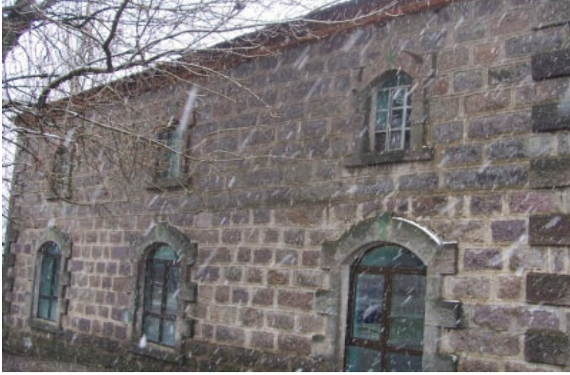
a Gözlüçayır Köyü eski camisi