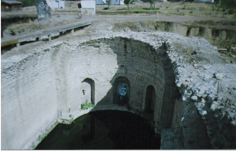
b Allianoi Nymphesi'nin buluntu yeri