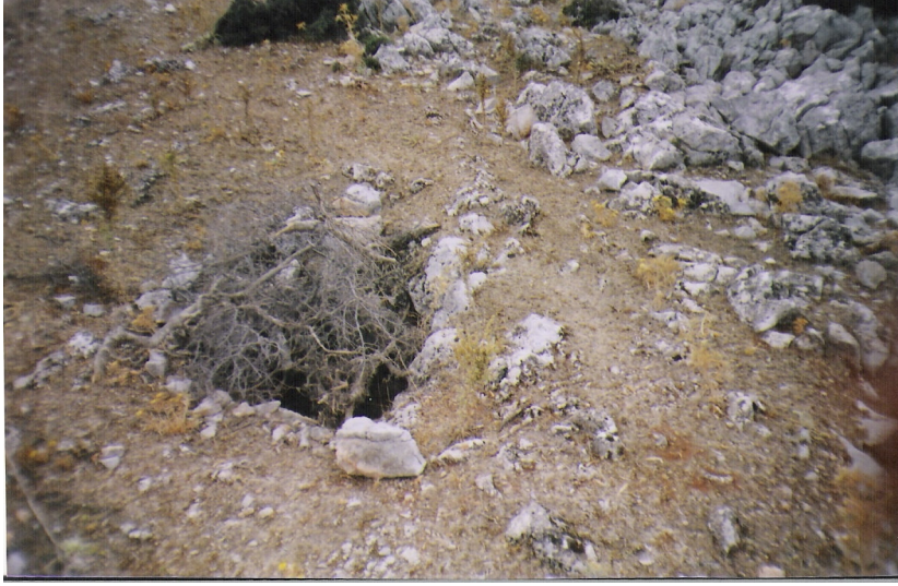
a Kale içindeki sarnıç