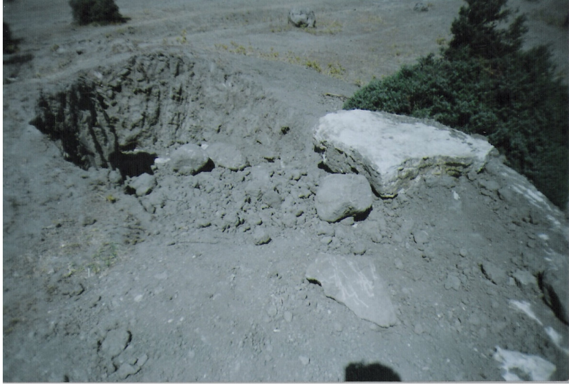
b Tümülüs'ten ayrıntı