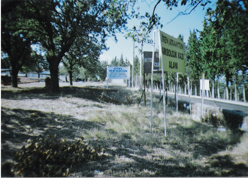
b Ören Tepe, Adramytteion kalıntı alanı