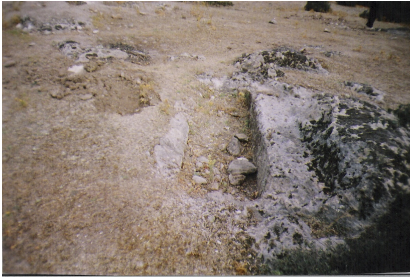
b Sandık tipi mezarlar