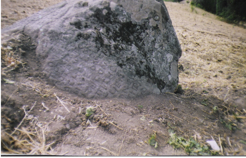
a Ana kayanın doęu yzündeki yazı