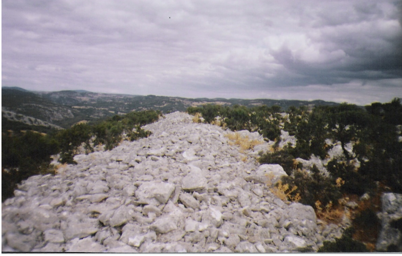
a Kuzey surları