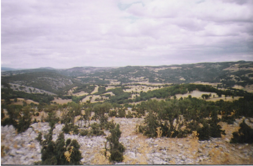
b Kale içinden görünüm