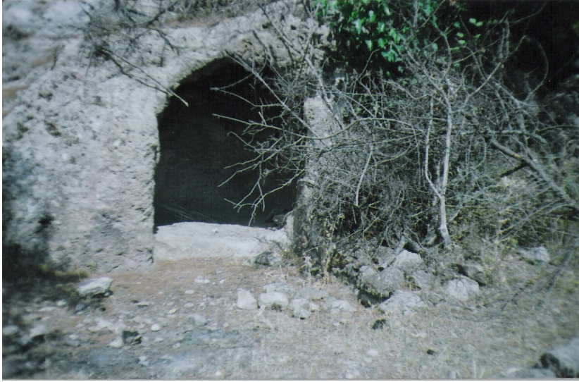
b Asartepe kral mezarı