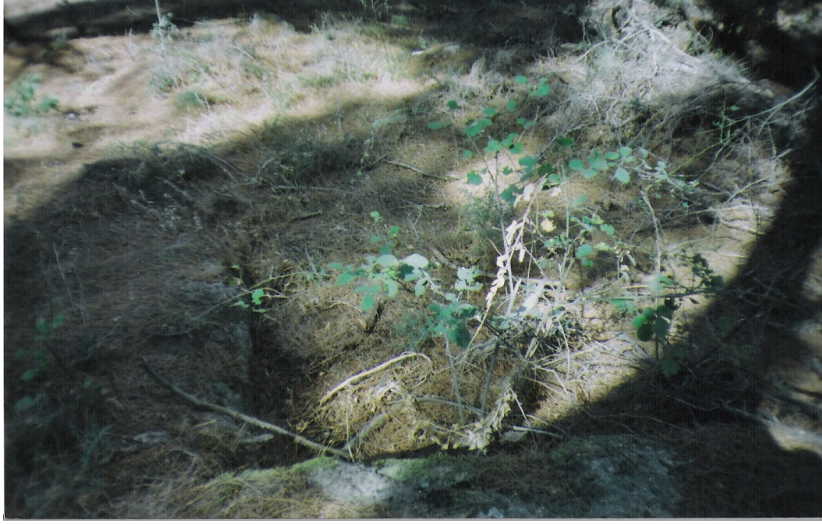
a Asartepe mezarlarından bir örnek