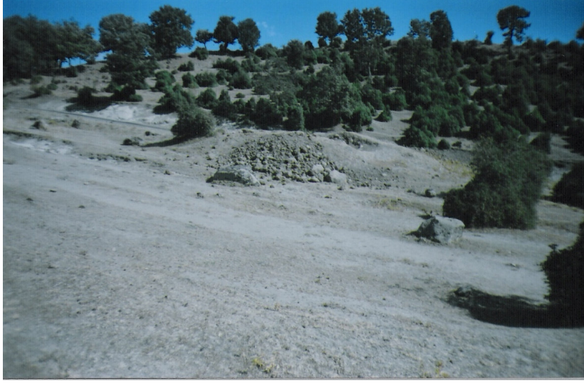
a Okçular Köyü yolu üzerindeki Tümülüs