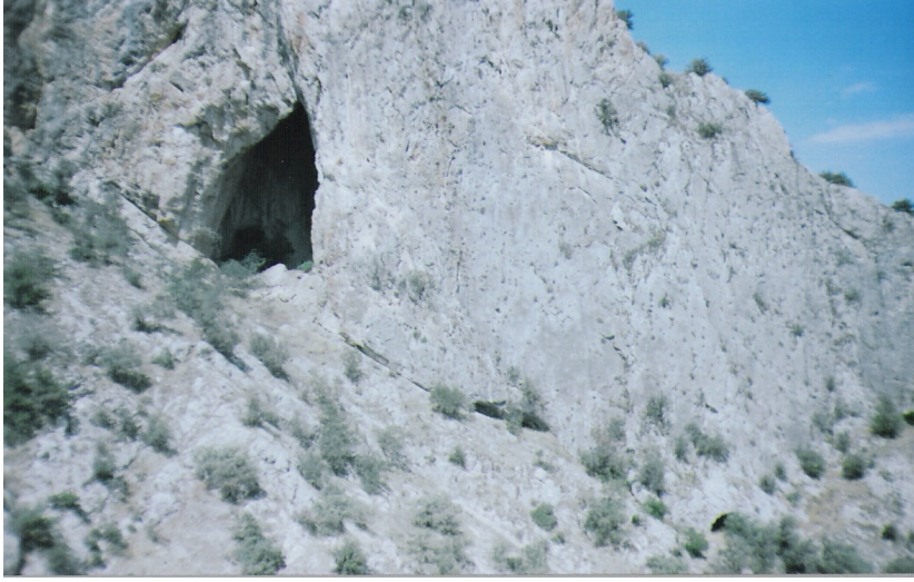
a Genel görünüm