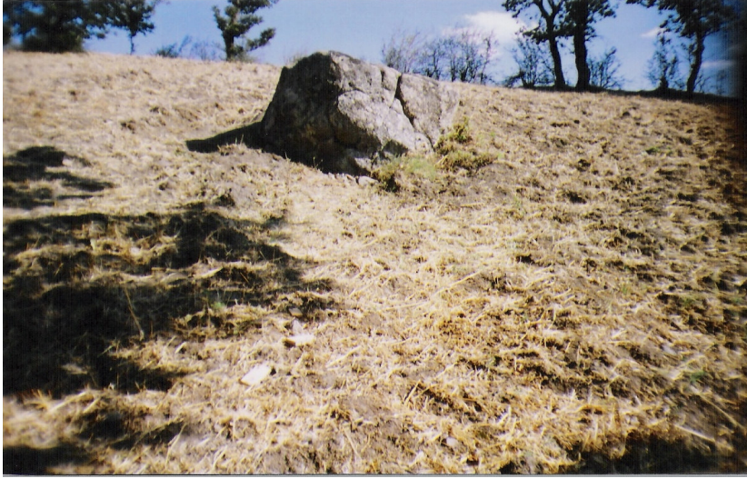
b Ana kayanın kuzey yzü