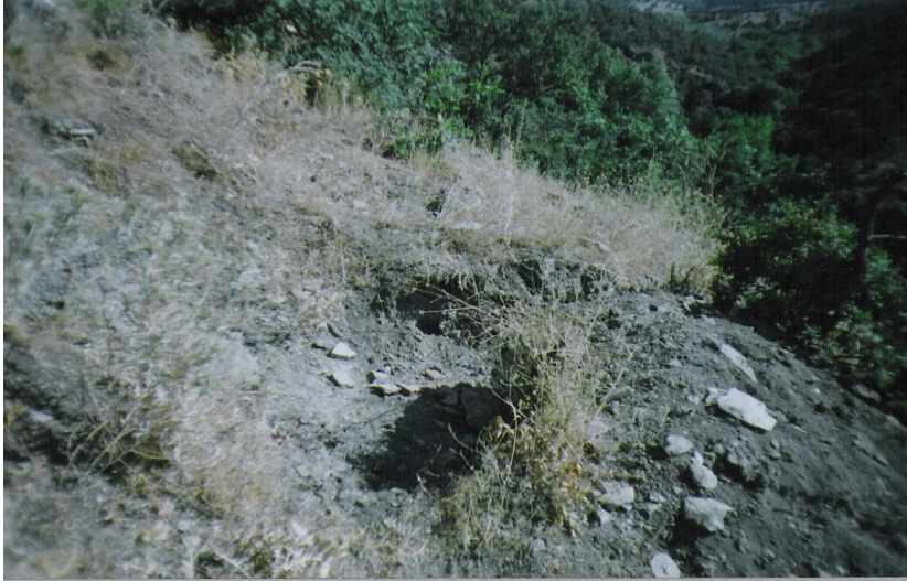
b Akbaba mevki defineci tahribatı