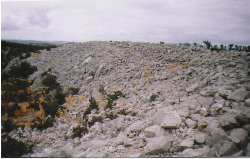
b Güney surları