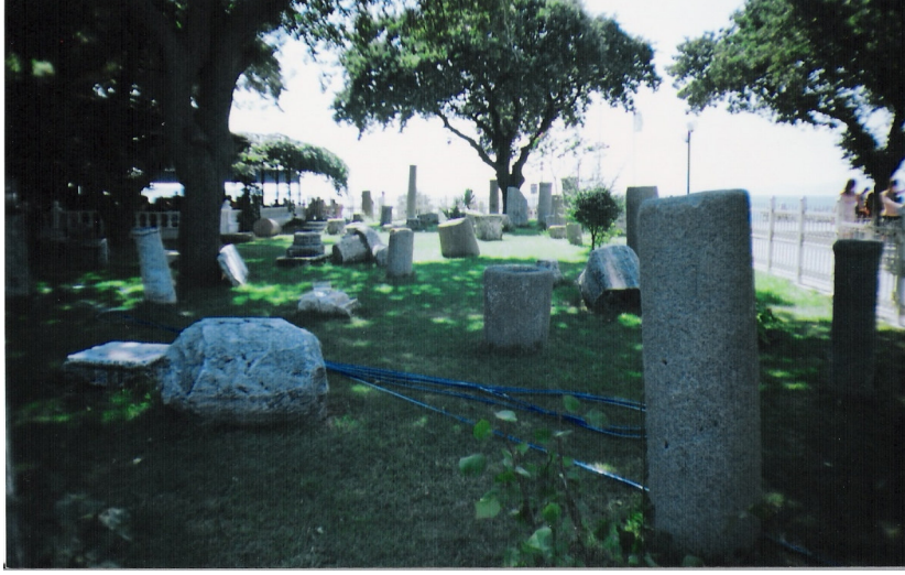
a Ören meydanında sergilenen eserler