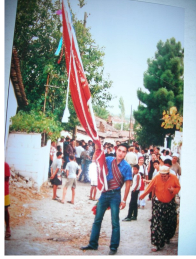
Köy Gençliği ve Bayraktar