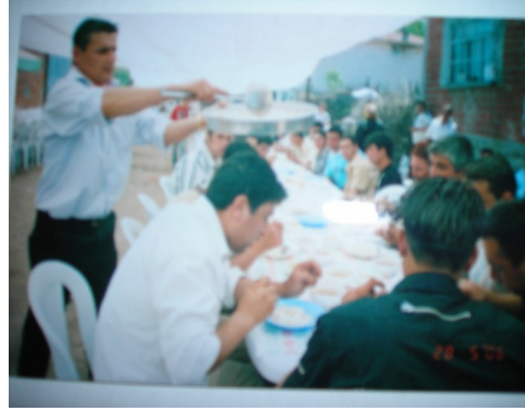
Köy Hayırlarından Görüntüler