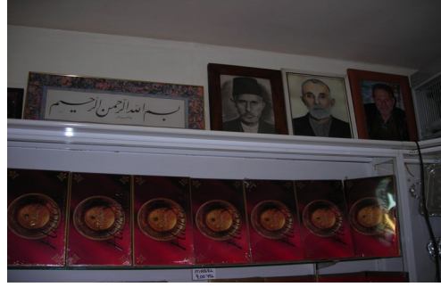
Şekerci Dükkanında Usta Fotoğrafları