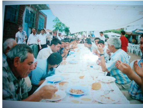
Köy Hayırlarından Görüntüler