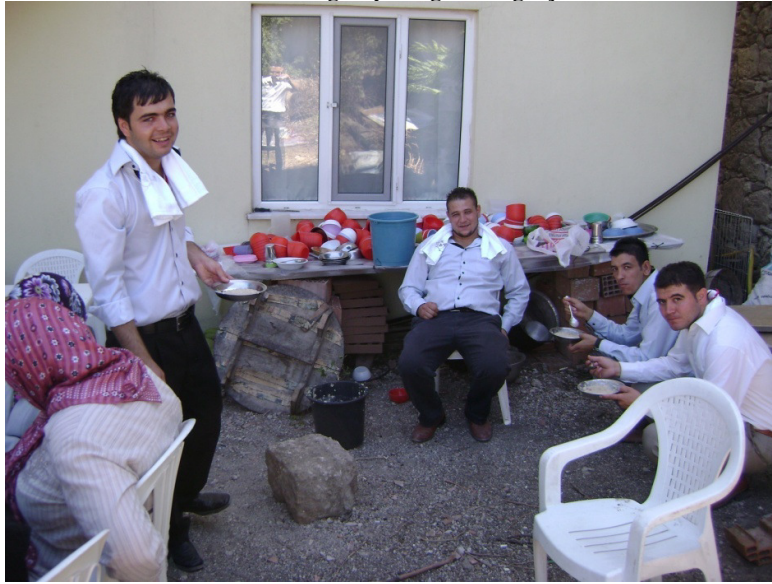
Resim 6: Düğün yemeği ve sağdıçlar