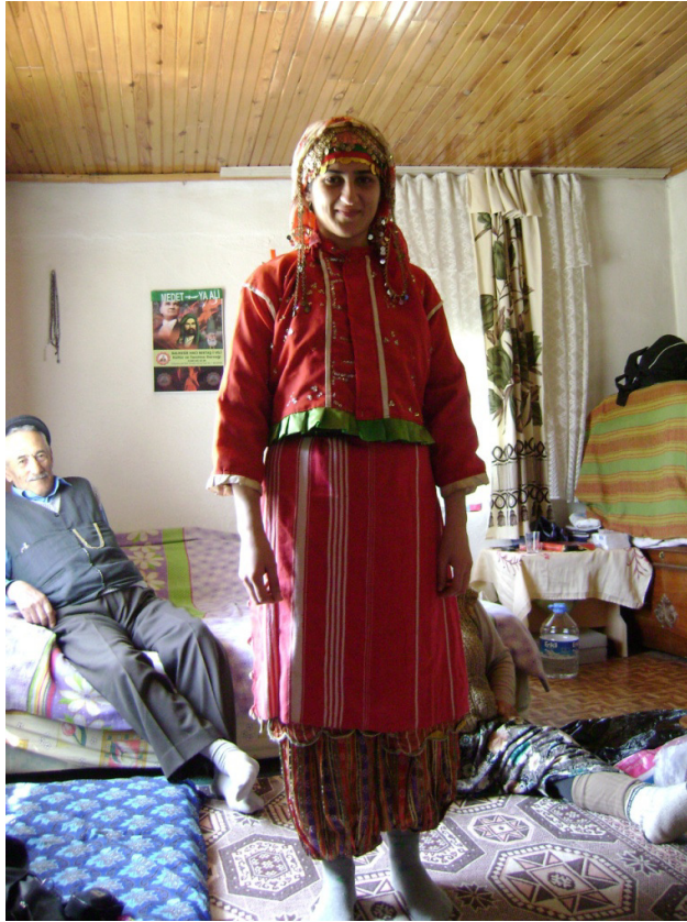
Resim 18: Musahip ceminde kadınların giydiği geleneksel kıyafet (Balıkesir/Soğanbükü Köyü)