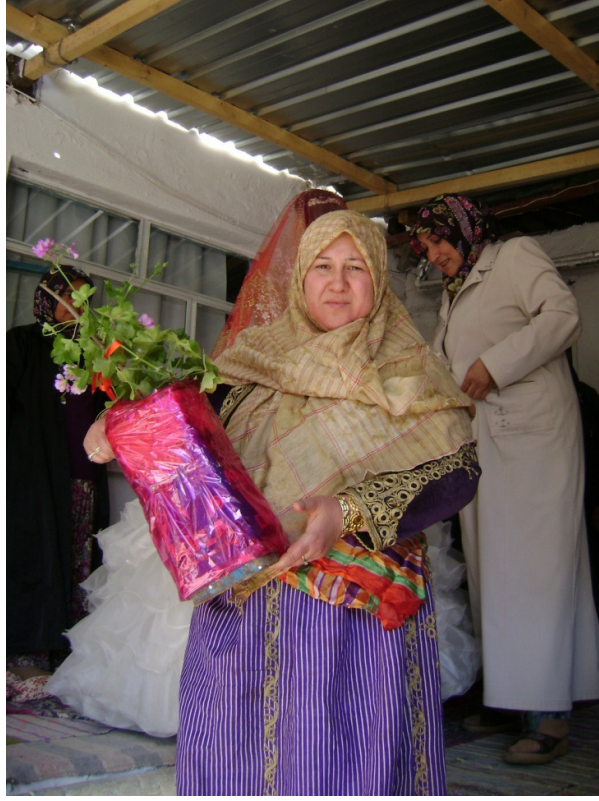
Resim 9: Gelin alımı ve yengeler