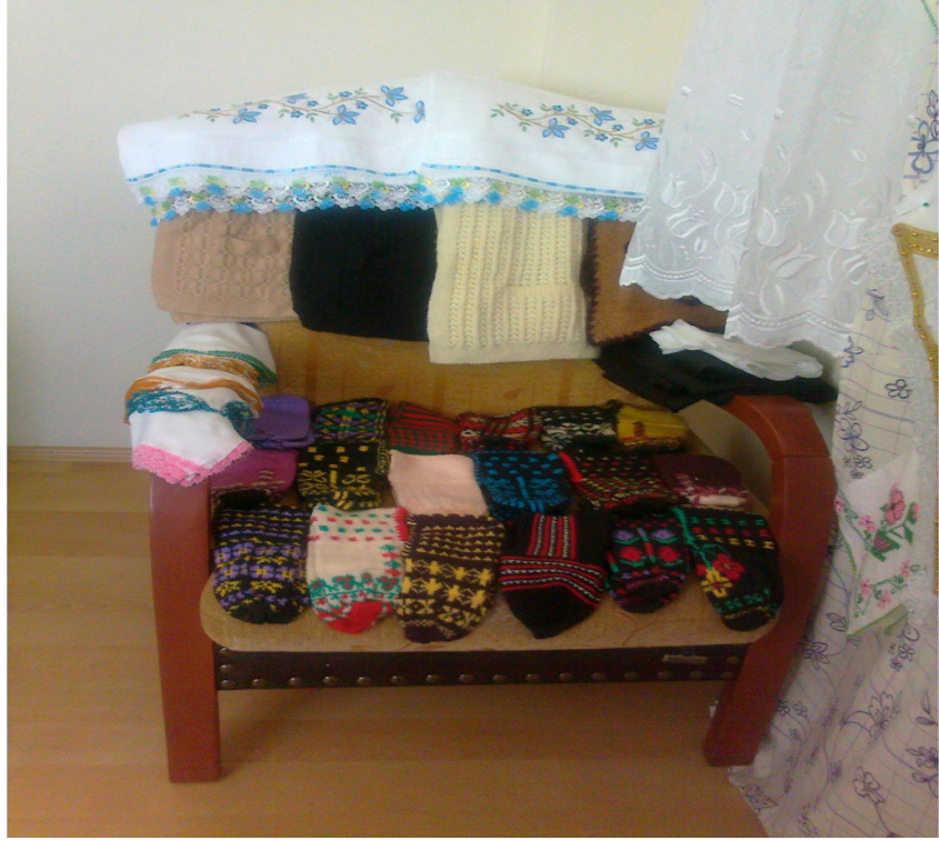
Resim 3: Kız tarafından ođlan evine gelen eyizler