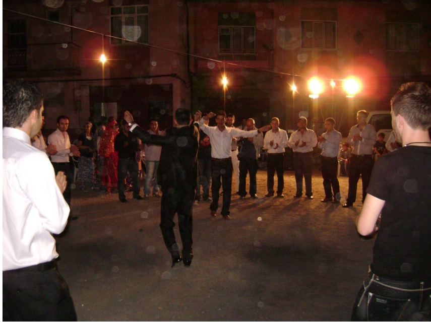
Resim 4: Damat ve sađdıları