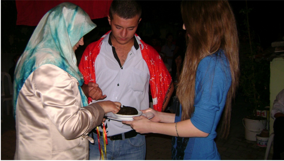
Resim 20: Asker kınası