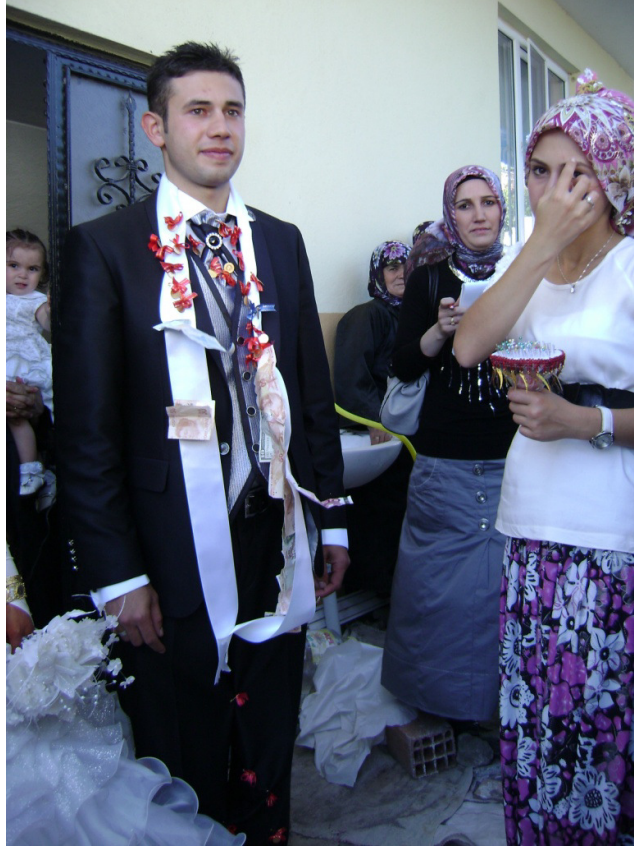
Resim 16: Damadın bacağına sağdıçları tarafından takılan altınlar