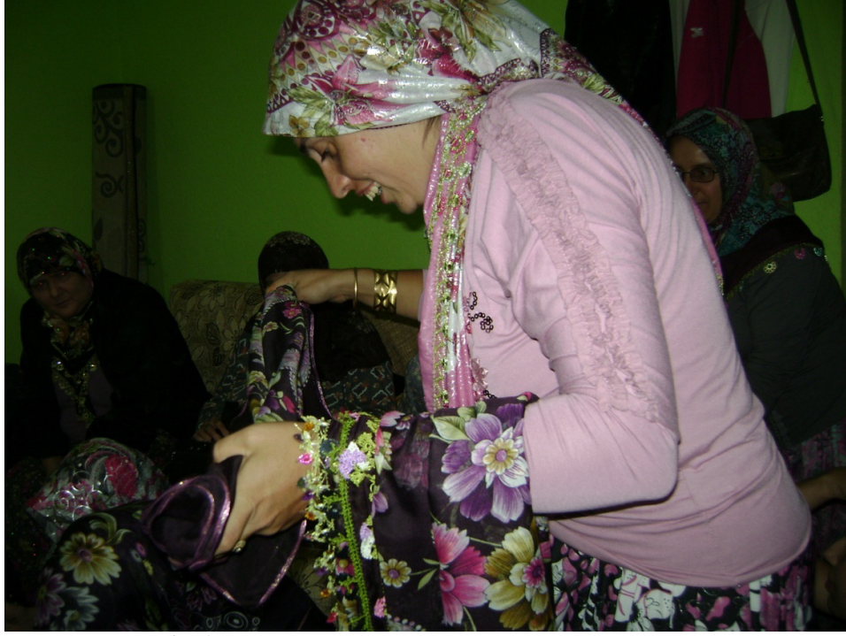
Resim 15: Kımayı yakan yengelere kız anasının yazma atması