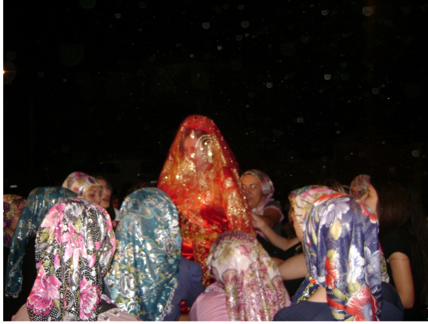
Resim 13: Gelinin sađdıçlarının kınadan sonra mani söyleyerek gelini havaya kaldırmaları