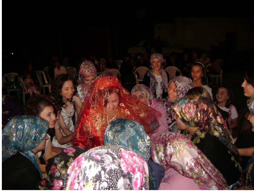
Resim 12: Gelinin sađıçlarının yaptıđı “adilov” uygulaması (Balıkesir-Köylüköy Köyü)