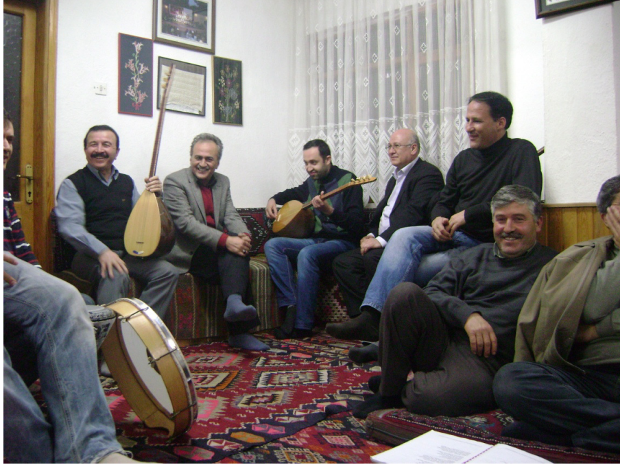
Resim 19: Barana sohbetlerinden bir görüntü