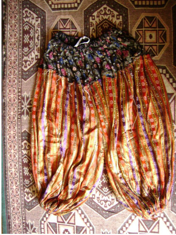
Resim 17: Musahip ceminde kadınların giydiği Fatma Ana'nın donu