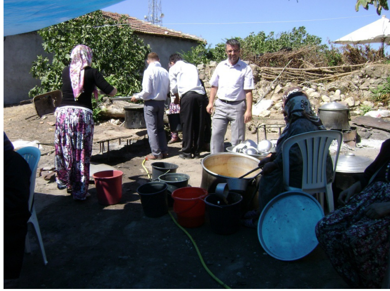
Resim 5: Düğün yemeği ve Sağdıçlar