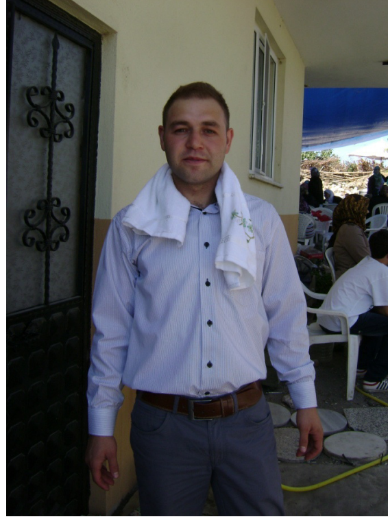
Resim 7: Sađdıçlara verilen havlu