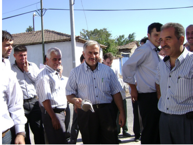
Resim 10: Sađdıç tarafından alman gelin ayakkabısının kayınpedere teslim edilmesi