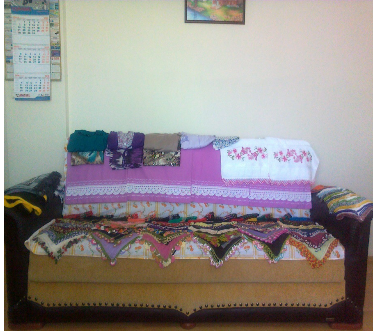
Resim 2: Kız tarafından oğlan evine gelen çeyizler