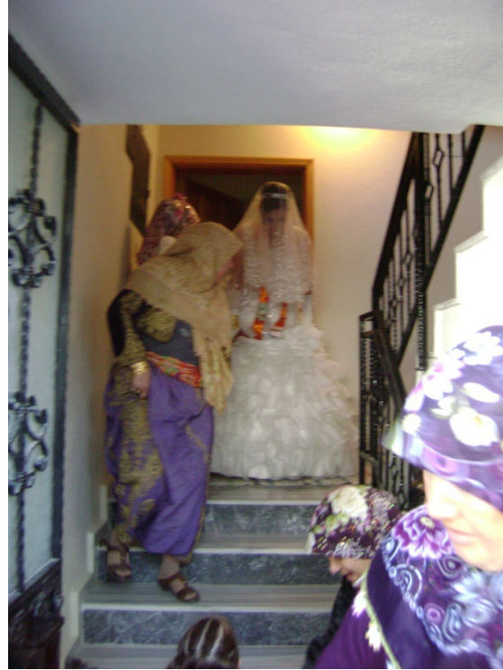
Resim 8: Dügünde ođlan yengesi ve kıyafeti