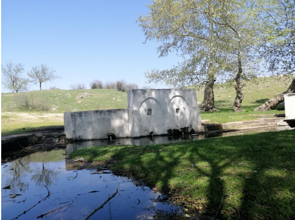
Fotoğraf 26: Bayat Mahallesi'nde Hidirellez Hayrının Yapıldığı Yer