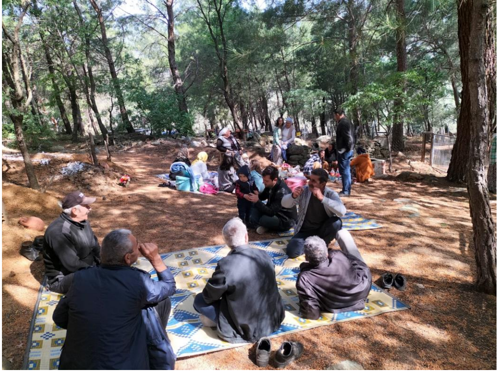
Fotoğraf 36: Mehmetalan Mahallesi'nde 7 Mayıs 2023 Günü Yapılan Mezarlık Ziyareti