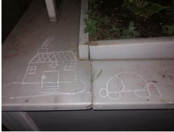
Fotoğraf 2: Hıdırellez Gecesi Ayak Dede Yatırına Çizilen Dilekler