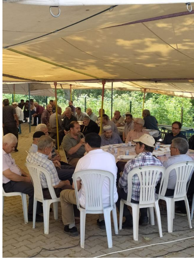
Fotoğraf 42: Karesi Hisaralan Mahallesi'ndeki Köy Hayrında Okunan Mevlit