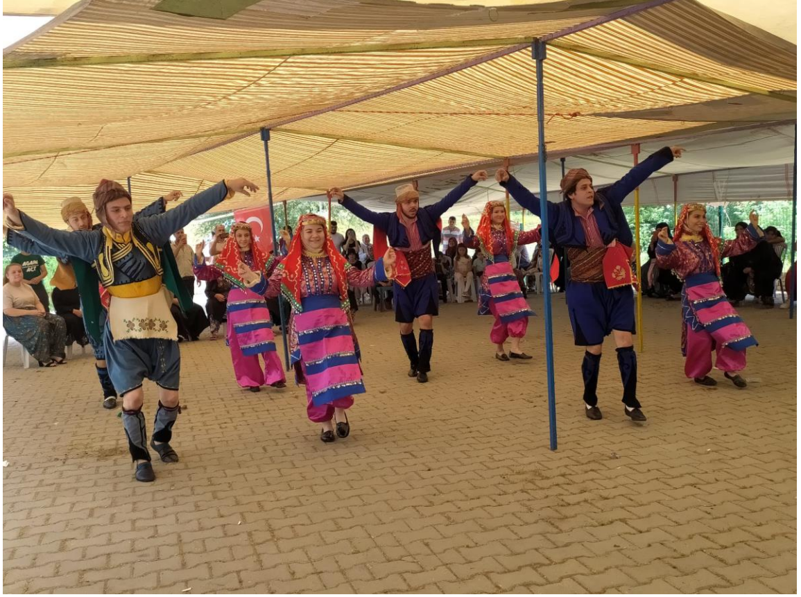
Fotoğraf 43: Karesi Hisaralan Mahallesi'nde Hayırdan Sonra Yapılan Halk Oyunları Gösterisi