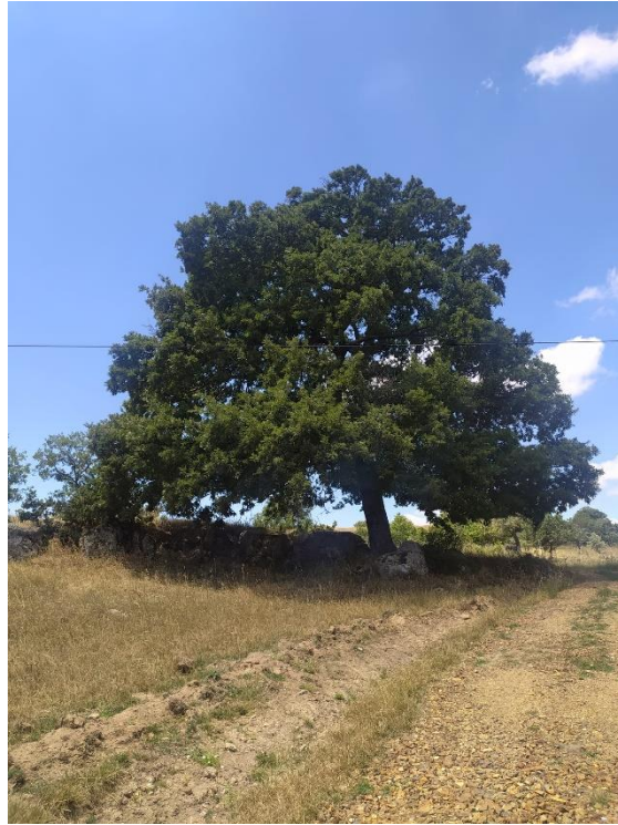
Fotoğraf 44: Karabeyler Mahallesi'nde Yağmur Duasının Yapıldığı Yer