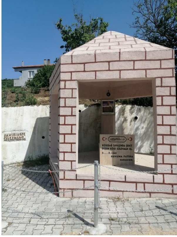
Fotoğraf 27: Bahçedere Mahallesi'ne Bağlı Kavakbaşı'nda Bulunan Süleyman Dede'nin Temsili Yatırı