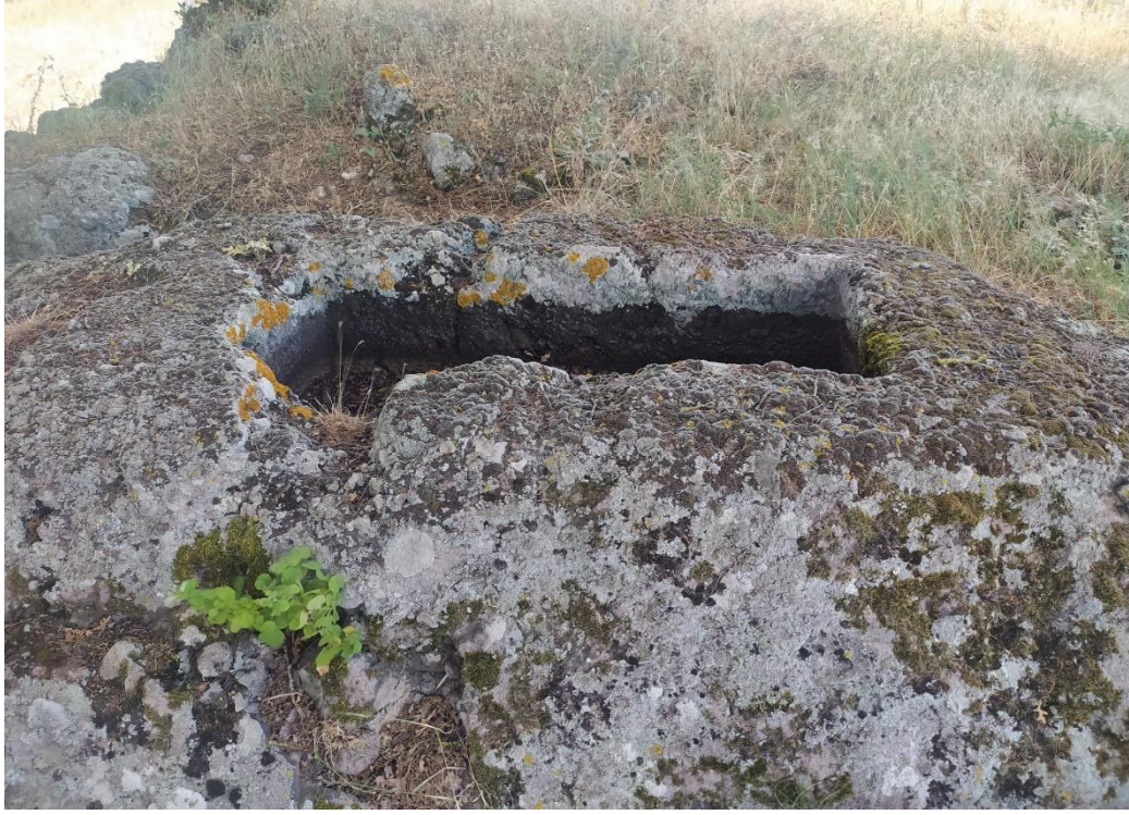
Fotoğraf 45: Karabeyler Mahallesi'nde Etrafında Yağmur Duasının Yapıldığı Taş