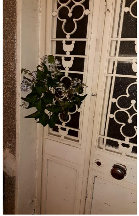
Fotoğraf 50-51: Hıdırellez Gecesi Evlerin Kapılarına Asılan Çiçekler