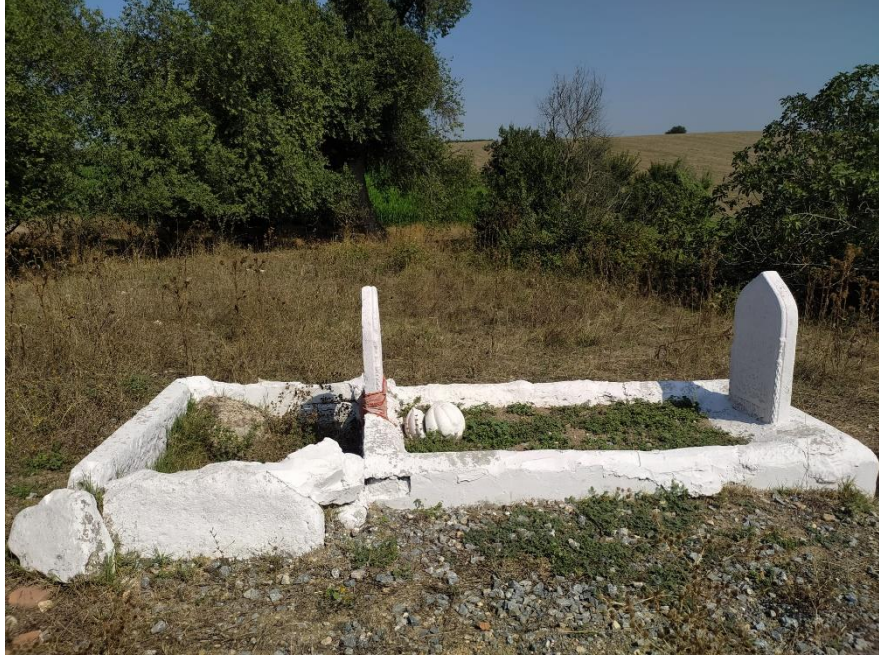
Fotoğraf 23: Kepekler Mahallesi'nde Tekke Denilen Yerdeki Dede Mezarı