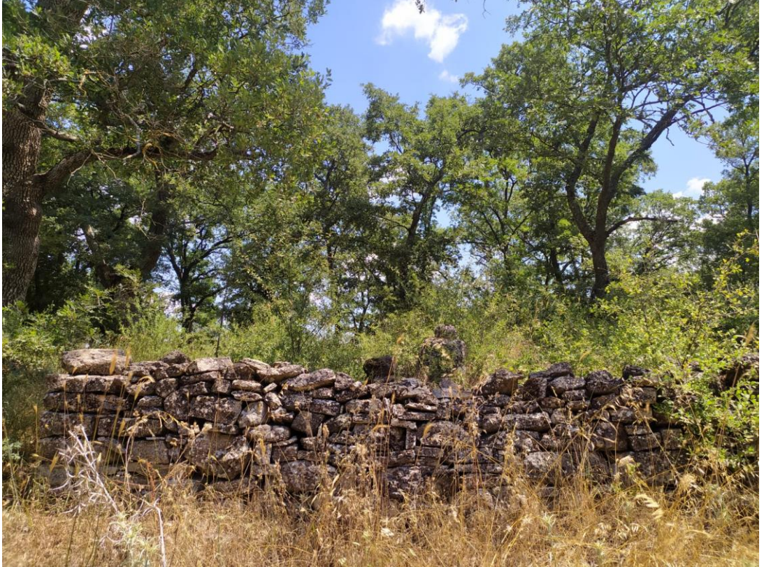
Fotoğraf 24: Sögütçük Mahallesi'nde Mezarlıkta Bulunan Muhammet Dede ve Ümmet Dede Yatırları