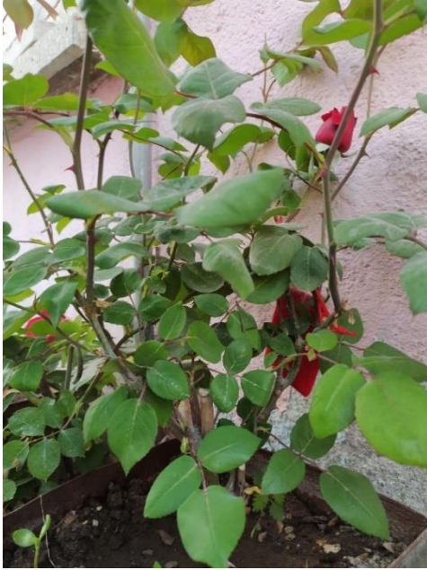
Fotoğraf 46: Hıdırellez Gecesi Güle Bağlanan Para ve Dilek Keseleri