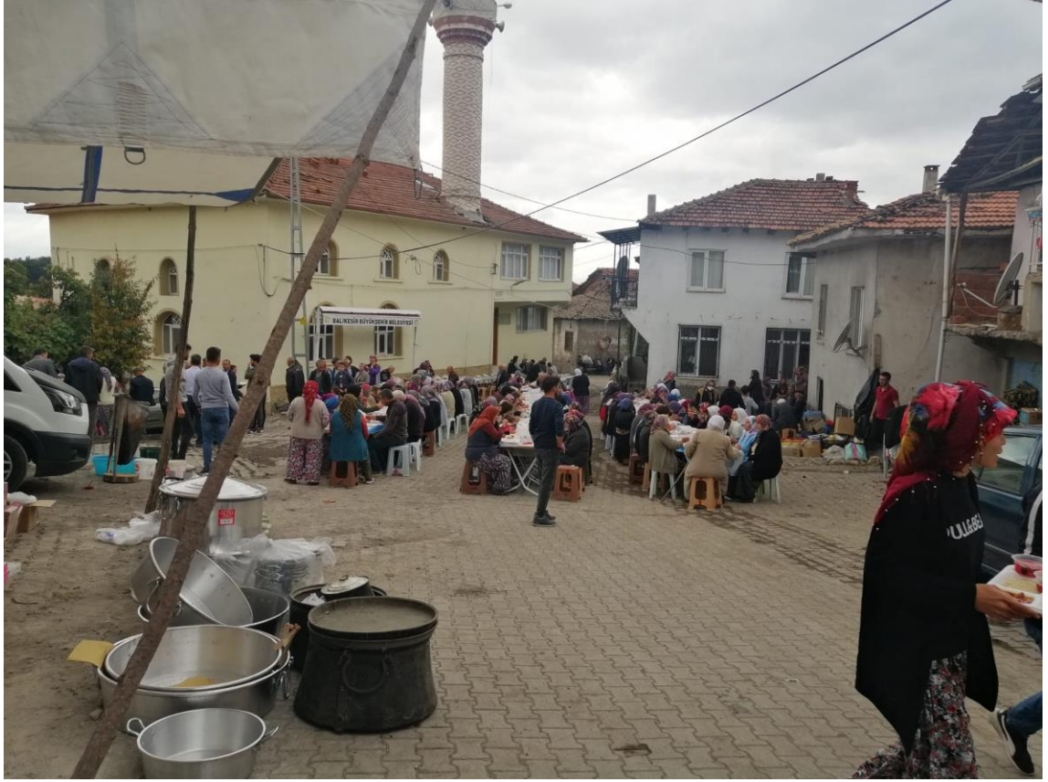
Fotoğraf 39: Sındırgı Hisaralan Mahallesi'nde Yapılan Bir Köy Hayrı