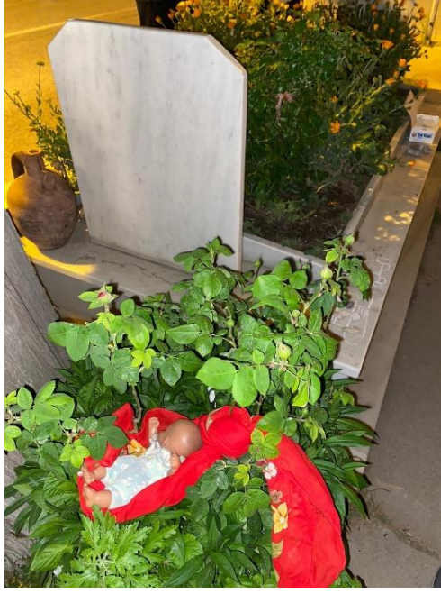
Fotoğraf 4: Ayak Dede Yatırımın Başındaki Gül Ağacına Bağlanan Maket Bir Beşik Ve Bebek