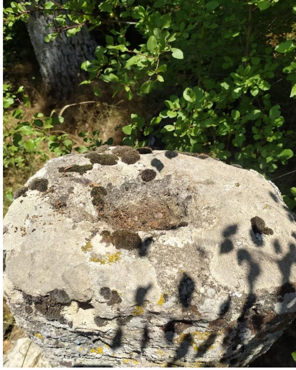
Fotoğraf 25: Muhammet Dede ve Ümmet Dede Yatırlarının Yanındaki Delik Taş