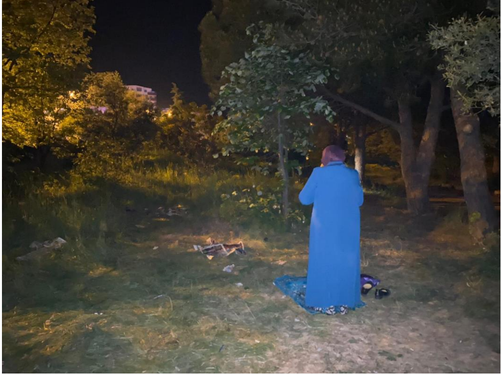
Fotoğraf 15: Bardakkıran Dede Yatırımın Çevresinde Namaz Kılan İnsanlar