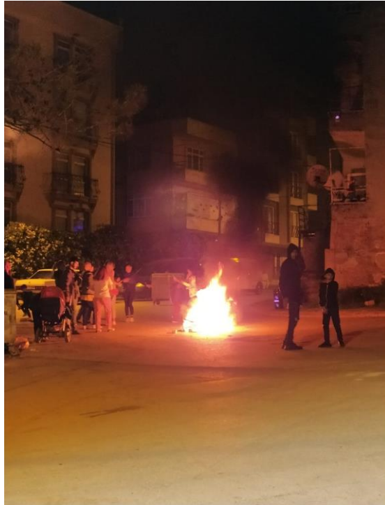
Fotoğraf 49: 05.05. 2022 Tarihinde Dinkçiler Mahallesi'nde Yakılan Hıdırellez Ateşi