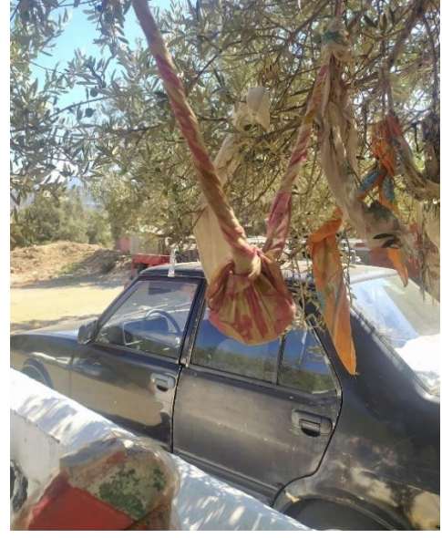
Fotoğraf 32: Çakmak Dedesi'nin Başında Bulunan Ağaca İçine Taş Koyulup Bağlanmış Bir Yazma