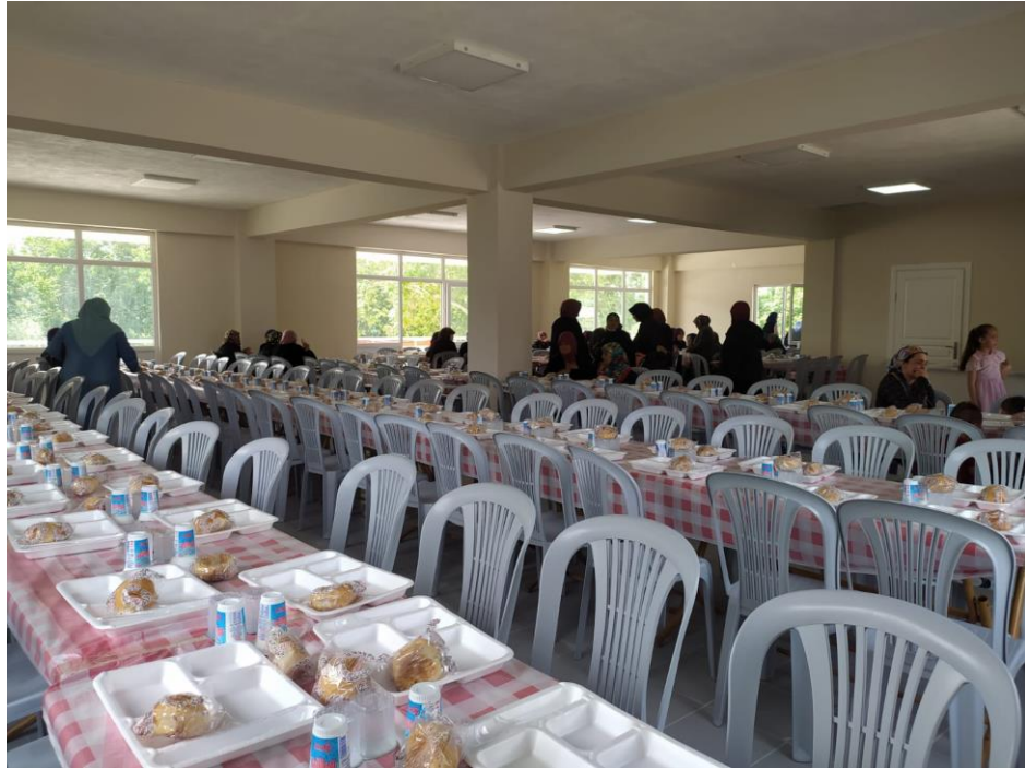
Fotoğraf 40: Karesi Hisaralan Mahallesi'nde Yapılan Bir Köy Hayrı