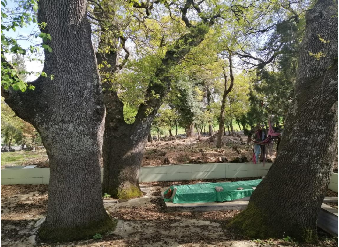
Fotoğraf 20: Türkali Mahallesi'nde Bulunan Uzan Dede Yatırı ve Çevresindeki Ağaçlar