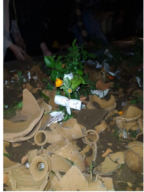
Fotoğraf 8: Bardakkıran Dede Yatırımın Üstündeki Testi Parçaları ve Güle Bağlanan Maket Bebek