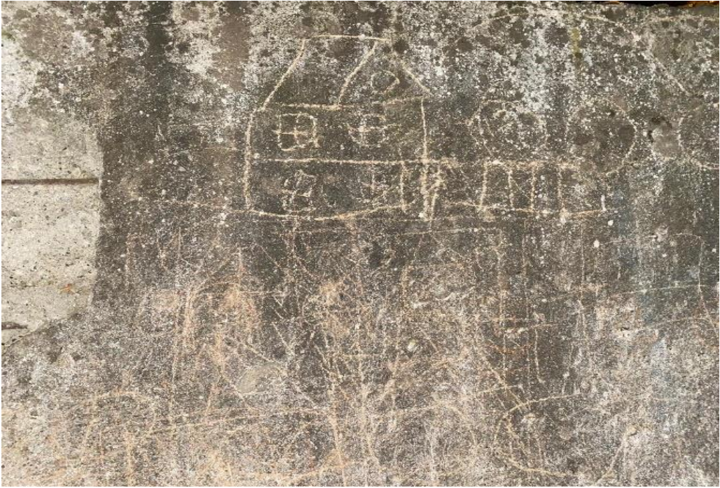
Fotoğraf 13-14: Bardakkıran Dede Yatırının Etrafındaki Duvarlara Çizilen Dilekler