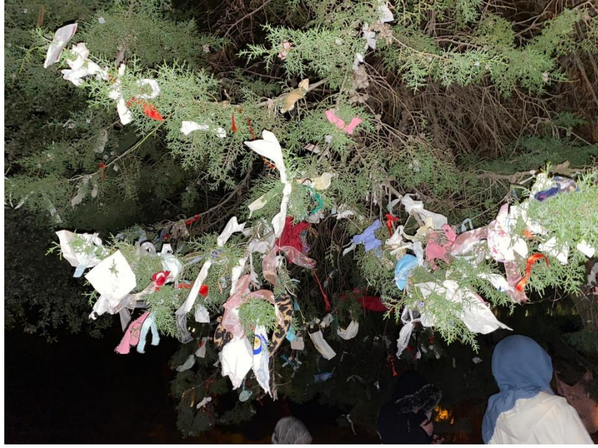
Fotoğraf 9: Bardakkıran Dede Yatırımın Üzerinde Bulunan Ağaca Bağlanan Çaputlar