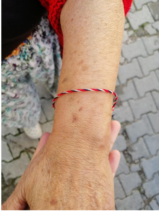
Fotoğraf 48: Doyran Mahallesi'nde Mart Yazgarası/Karası Denilen Dilek İpi