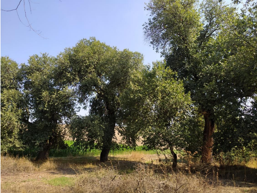
Fotoğraf 22: Kepekler Mahallesi'nde Hıdırellez Hayrının Yapıldığı Tekke Denilen Yer