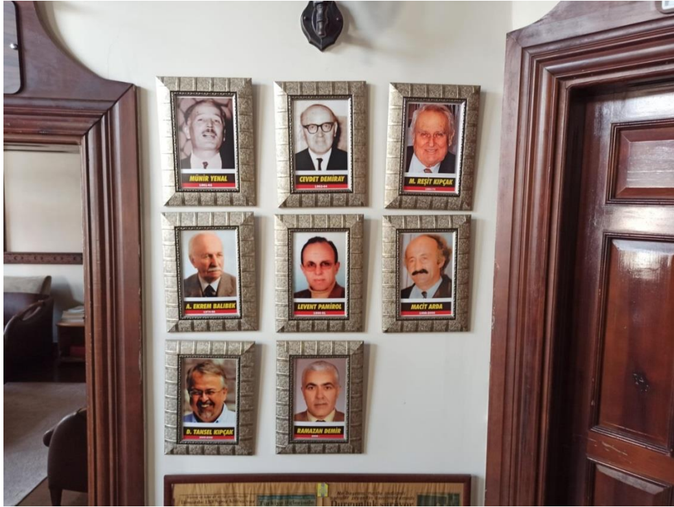
Fotoğraf 13: Balıkesir Gazeteciler Cemiyeti Başkanlarına Ait Fotoğraflar