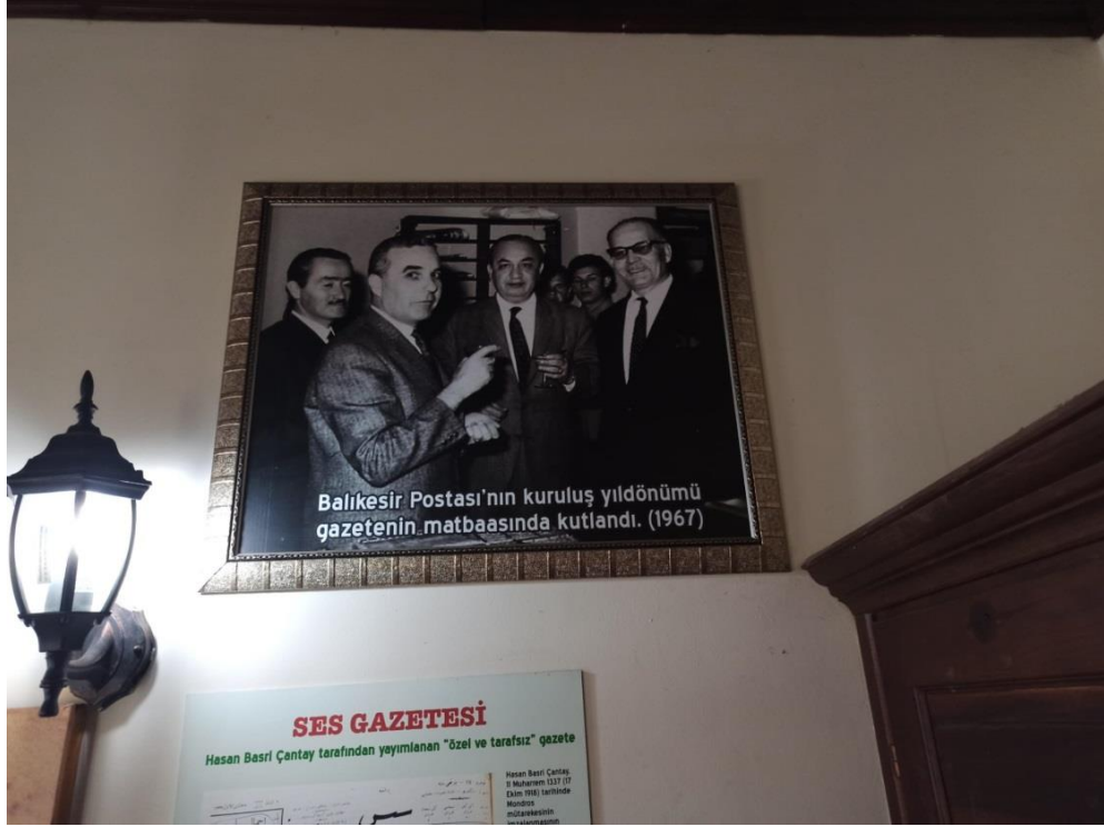
Fotoğraf 12: Balıkesir Postası'nın Kuruluş Yıldönümü Ait Bir Fotoğraf (1967)