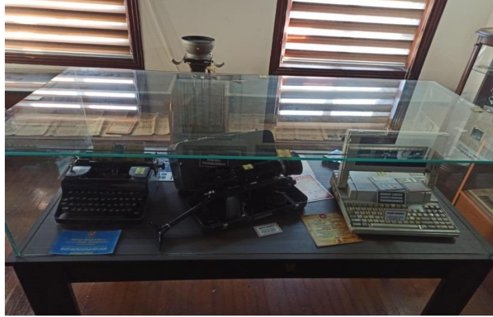
Fotoğraf 6: Balıkesir Gazeteciler Cemiyeti'nden Ulaşılan Fotoğraflar (Dönemin Gazetelerinde Kullanılan Daktilolar)