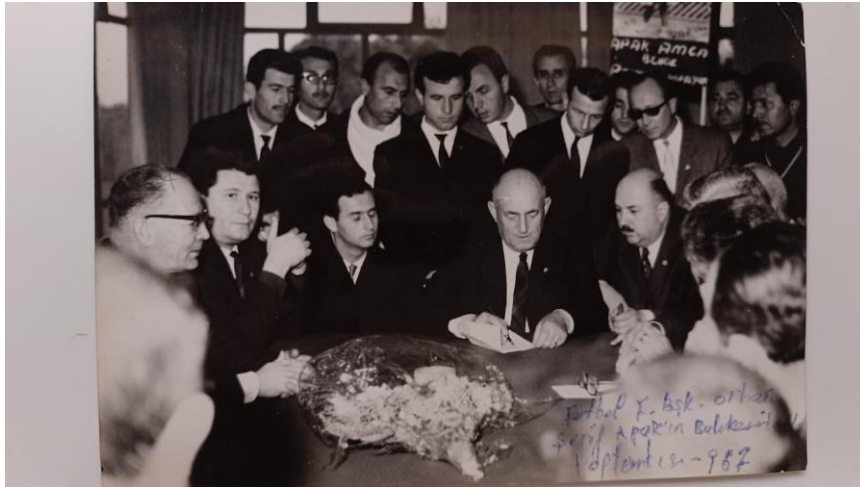
Fotoğraf 42: Futbol Fedarasyonu Baskanı Orhan Şerif Apak Tarafından Düzenlenen Toplantıya Ait Bit Fotoğraf (1967)