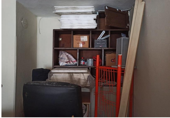
Fotoğraf 7: Balıkesir İnsancıl Kitabevi'nde Bulunan ve 1957 Yılında Yenal'ın Ofis Olarak Kullandığı Oda, Koltuğu ve Kitaplığı