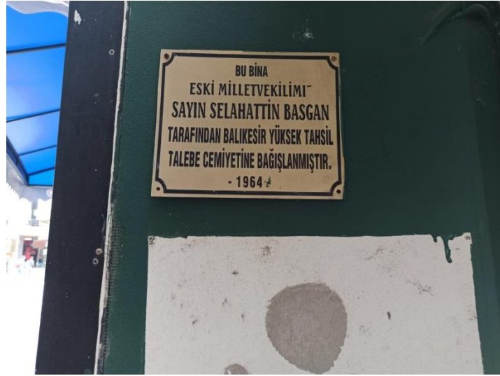
Fotoğraf 24: Balıkesir Postası Gazetesinin Basımevi: Balıkesir Türkpazarı Matbaası