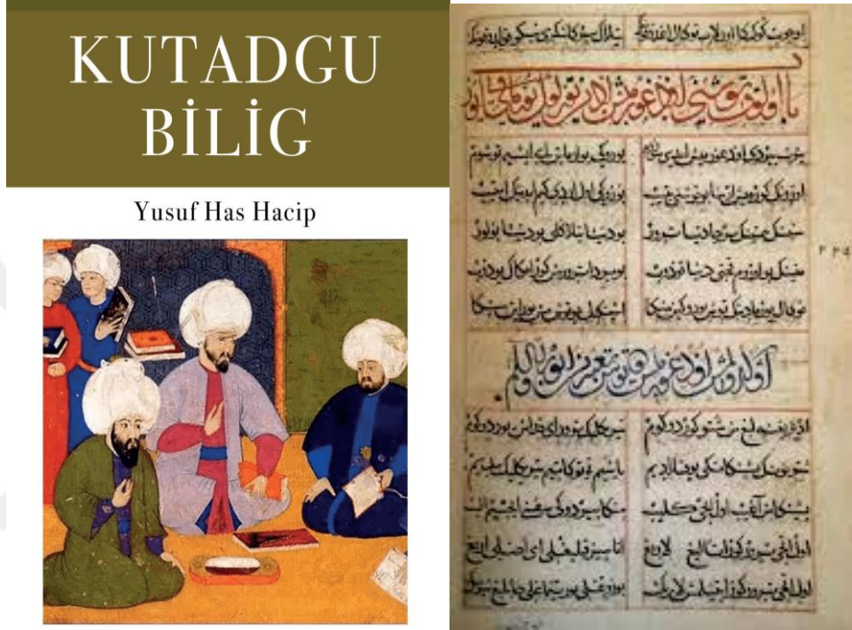
Şekil 3. Kutadgu Bilig'den bir kesit

olduğunu ve bu özelliklerin nasıl kazanılması gerektiğiyle ilgili tavsiyeler vermektedir (Yıldırım, 2018, s. 48).