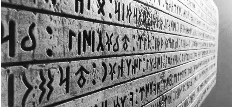
Şekil 2. Orhun Yazıtları