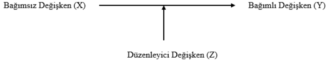
Şekil 1. Düzenleyici Değişkenin İlişkisel Yapıya Etkisi

düşürebileceği ve bu değişkenler arasındaki ilişkinin duygusal dayanışmanın alacağı değere göre değişebileceği öngörülmektedir.