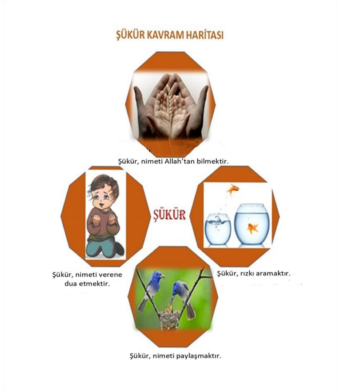
Şekil 4. Şükür ile İlgili Kavram ve Zihin Haritası Örneği