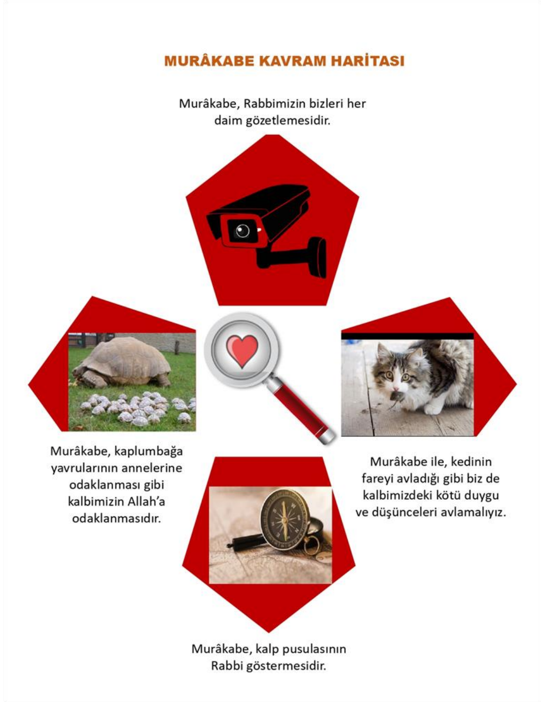
Şekil 2. Murâkabe ile İlgili Kavram ve Zihin Haritası Örneği