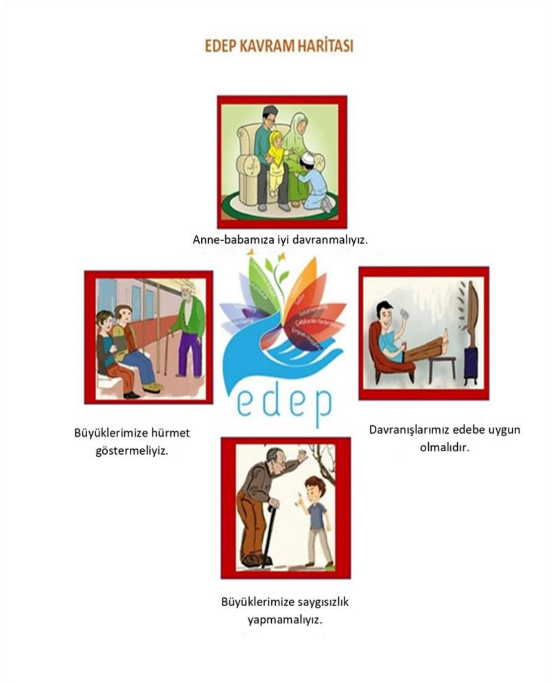
Şekil 1. Edep ile İlgili Kavram ve Zihin Haritası Örneği