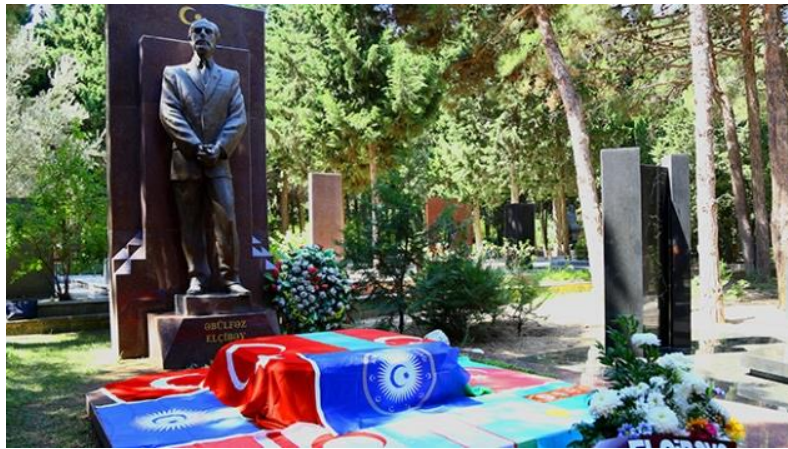
Şekil 8: Elçibey'in Mezarı (Bakü)

Elçibey'i Gülhane Askerî Tıp Akademisi'nde (GATA) bulunduğu sürede Mesut Yılmaz, Devlet Bahçeli gibi birçok Türk devlet adamı da ziyaret etmişti. Elçibey'in tedavisi GATA'da gerçekleştiriliyordu. Doktor Elçibey'in durumunun ne kadar ağır olduğunu farkındaydı. Fakat bu durumu Elçibey'e nasıl söyleyebileceğini bilmiyordu. Elçibey'in sağlığı ile ilgili tüm gerçekleri duymak istediğini söylemesi üzerine artık kendisinin son zamanlarına yaklaştığını ona söylemek zorunda kaldı. 60 gün kadar süren uğraşlara rağmen sağlık durumu daha da ağırlaşan Elçibey 22 Ağustos 2000 günü saat 8.30 civarında hayata gözlerini yumdu. Aynı gün Elçibey'in naaşı, Türk Hava Kuvvetlerine ait bir uçakla Esenboğa Havalimanı'ndan kendi ülkesi Azerbaycan'a uçuruldu. Ertesi gün Elçibey'in naaşı Bakü'ye getirildi. İlk olarak İlimler Akademisinde bir cenaze töreni yapıldı. Elçibey'in naaşı ailesi, devlet adamları ve tüm sevenlerinin katıldığı büyük bir kalabalık tarafından Devlet Mezarlığına defnedildi (Bilgin, 2016, s. 212).