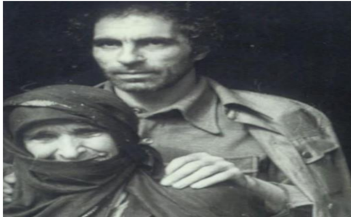
Şekil 2: Elçibey ve Annesi Mehrinisa Hanım