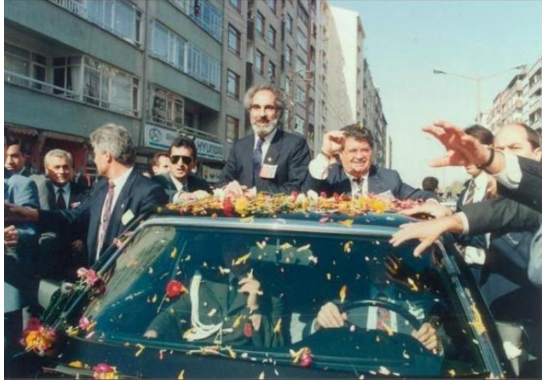
Şekil 6: Turgut Özal ve Elçibey Halkı Selamlarken