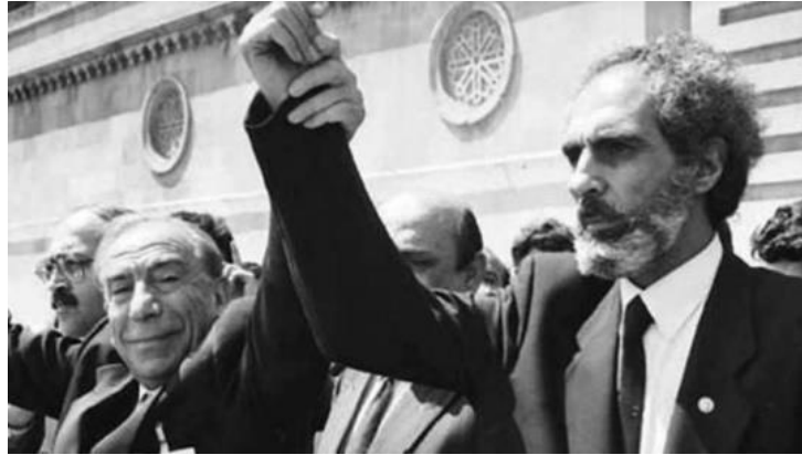
Şekil 5: Elçibey, Alparslan Türkeş ile Birlikte

yaptığı konuşmalarında başkanlık seçimlerin yapılacağını ifade etmiş, bu da parlamenter demokrasiden yana olan AHC'nin tepkisine yol açmıştır. AHC'ye göre bu koşullarda var olan sistem uygun değildir. Çünkü öncelikle denge-denetim mekanizmasının oluşturulması gerekmektedir. Seçimler yapılsa da başkanın yönetimde güçlü olmasına imkân vermeyecek ayrıca onun totaliter bir eğilimde olabilmesine zemin hazırlayabilecektir. Yüksek Sovyet muhalefet tarafından getirilen tüm eleştirilere karşın 7 Haziran 1992'de seçimlerin yapılmasına karar verilmiştir. AHC bu gelişmelerden sonra seçimlere katılacağını ve aday olarak Ebülfez Elçibey'in yarışacağını açıklamıştır. Elçibey'in aday olacağını ilan edilmesiyle Yüksek Sovyet Başkanı Yakup Memmedov, İtibar Memmedov, İlyas İsmayılov, Nizami Süleymanov ve Rafik Abdullayev'in seçimlerde Cumhurbaşkanı olabilmek için adaylıkları ilan edilmiştir. Ülkenin içinde bulunduğu kargaşa durumu seçimlerin de sıkıntılı bir süreçte yapılacağını göstermiştir (Cafersoy, 2001, s. 42-43).