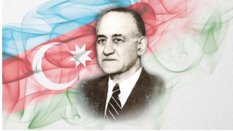
Şekil 1: Mehmet Emin Resulzade