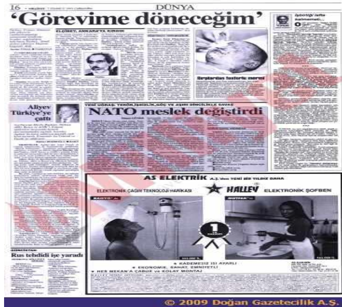
Şekil 8: Elçibey Keleki’deyken Çıkan Haberler

Elçibey Keleki’de bir süre kaldıktan sonra Haydar Aliyev’in Cumhurbaşkanı olacağıyla ilgili iddiaların ortaya atılması üzerine, bu iddiaların asılsız olduğunu göstermek için Bakü’ye dönmeye karar vermiştir. Onun geri dönmesini istemeyen güçlerin planları vardı. Elçibey’in Bakü’ye döneceği uçağa saldırıda bulunuldu (A. Samedbeyli, 2019, s. 249). Aynı zamanda Elçibey’in Yaşadığı Keleki köyü de abluka altına alınmıştı (Bilgin, 2016, s. 191). Olacakları gören Elçibey Keleki’de kalmanın en doğru karar olduğunu düşündü. Bir süre Keleki’de zor şartlarda yaşadı. Keleki’den başka yerde yaşamayı düşünmemesinin nedeni ise gideceği yerdeki insanların da zarar görmesini istememesindendi (Halilova, 2017, 351).