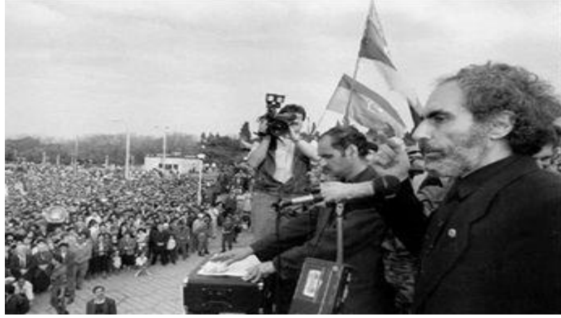
Şekil 6: Elçibey Miting Konuşması Yaparken

basında kendisiyle ilgili hiciv içerikli bir çizimi de özgürlükler bağlamında değerlendirerek tepki göstermemiştir (Sert, 2020, s.183).