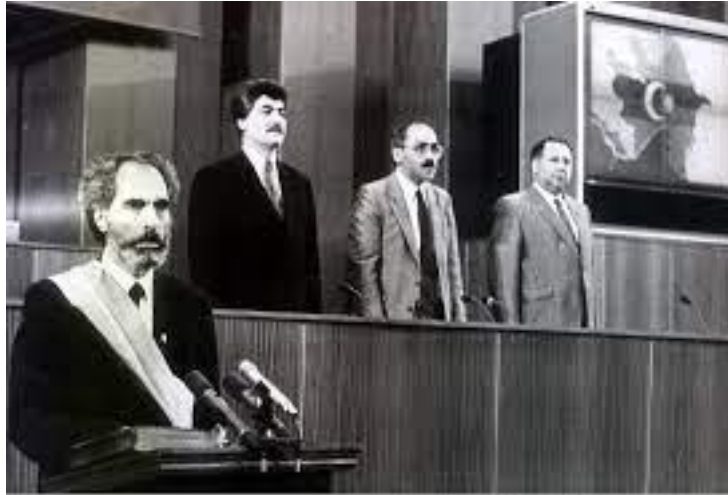
Şekil 3: Elçibey Mecliste

ve civarında saldırılara başlamıştır (Cafersoy, 2001, s. 23). Bu saldırılarda SSCB adeta kadın, çocuk ayırt etmeksizin onlarca insanı resmen katletmiştir. Bu olay Azerbaycan tarihine “Kara Yanvar” olarak geçmiştir (Güler, 2006, s. 73). 20 Ocak olayları halkta çok büyük infial yaratmış ve iktidara karşı protestolara sebep olmuştur. Tüm bunlar Azerbaycan halkının azatlık direnişlerini yavaşlatsa da tamamen sonunu getirememiştir. SSCB yaptığı bu saldırılarla hem Azerbaycan’ın direncini kıracak, hem de bağımsızlık iddiasındaki diğer halkların da ses çıkarmasının önüne geçecektir (Bilgin, 2016, s. 107-108). Bunun sonucunda SSCB hükümeti, Bakü’de AHC ile masaya oturmak zorunda kalmıştır. Gelen heyetin amacı, mevcut düzeni devam ettirmek ve AHC’nin çalışmalarına son vermektir. Ama Elçibey’in sükûnetini koruması ve itidalli davranması onların beklediği gibi olmamış AHC pozisyonunu korumaya devam etmiştir. 30 Eylül 1990 tarihinde yapılan seçimlerde AHC 31 koltukla meclise girmiştir (Tahirzade, 2017, s. 484).