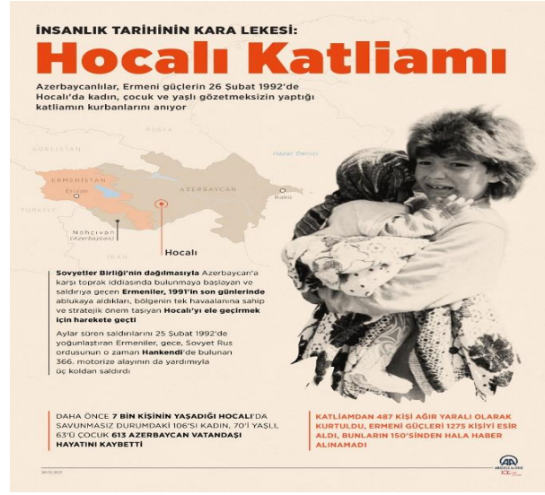
Şekil 4: Hocalı Katliamı