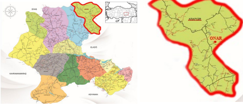
Şekil 1: Malatya, Arapgir ve Onar kırsal yerleşiminin haritadaki konumu (URL 7 ve URL 8'den yararlanılarak hazırlanmıştır).

Arapgir ilçesine 15 km mesafede bulunan Onar kırsal yerleşimi, ana yolun 5 km doğusunda yer almakta olup Malatya'ya da 100 km uzaklıktadır (Şekil 1, Şekil 2). Malatya'nın 6360 sayılı kanunla büyükşehir olarak kabul edilmesinin ardından köy statüsünden çıkararak mahalle olarak nitelendirilen Onar'ın eskiçağ tarihiyle ilgili ayrıntılı bilgi bulunmamasıyla birlikte, Roma dönemine kadar Malatya ile paralel biçimde gelişen bir tarihi geçmişe sahip olması muhtemel görülmektedir (URL 6; Özman, 2016: 1). Yerleşim, adını köyün kurucusu olan Şeyh Hasan Onar'dan almıştır (Sis ve Çeçen, 2016: 414). Anadolu kültürünün canlı ve etkin bir unsuru olan Alevi kültür ve inanışlarıyla öne çıkan bu alanda, kadim geleneklerin yaşatıldığı “Büyük Ocak Cemevi (Şeyh Hasan Onar Zaviyesi)” ile “Şeyh Bahşiş Cemevi (Küçük Ocak Zaviyesi)” adında iki önemli dini yapı bulunmaktadır.