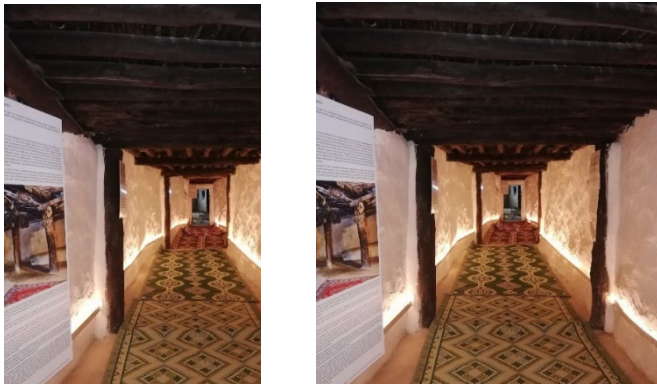
Şekil 5: Büyük Ocak Cemevi (Şeyh Hasan Onar Zaviyesi) giriş (koridor) mekânından görüntüler (Çöp, 2019; Aydoğdu, 2020).