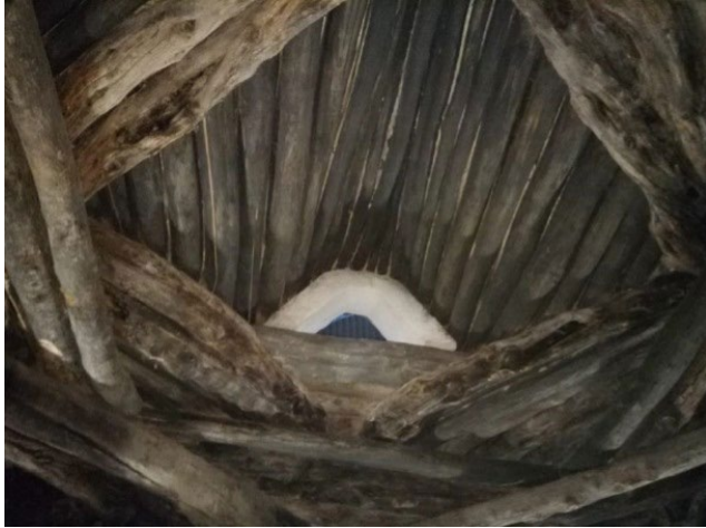
Şekil 11: Şeyh Bahşiş Cemevi (Küçük Ocak Zaviyesi) sır lokma penceresi (Şancı, 2021:282).

Şeyh Bahşiş Cemevi, plan ve mekânsal düzenleme açısından mütevazı bir yapı olarak değerlendirilebilir. İbadetin gerçekleştiği mekân ve buna ulaşan koridor dışında herhangi bir yan mekân tespit edilmemiştir. Ancak yapının özgün işlevinin zaviye olması nedeniyle başka mekânlarının da olabileceği fakat bunların günümüze ulaşamadıkları da düşünülebilir. Genel olarak ibadet işleviyle kullanım yoğunluğunun az olduğu gözlemlenmiştir. Buna rağmen çeşitli onarımlarla, malzeme ve yapım tekniği açısından özgüne uygun şekilde günümüze kadar ulaşabilmiştir.