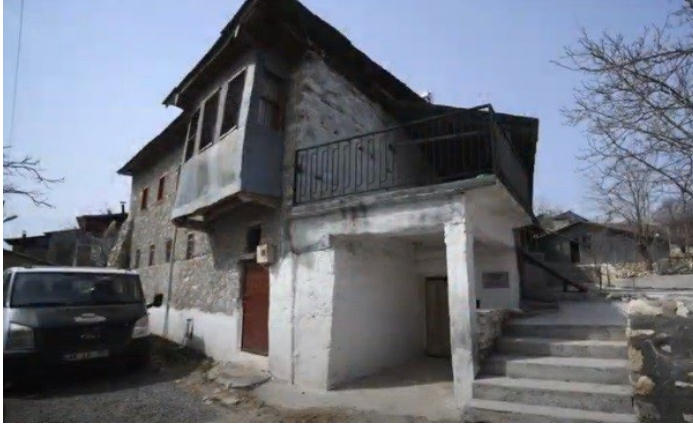
Şekil 4: Büyük Ocak Cemevi (Şeyh Hasan Onar Zaviyesi) (URL 10).