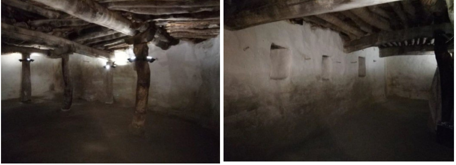
Şekil 10: Şeyh Bahşiş Cemevi (Küçük Ocak Zaviyesi) iç mekânından görüntüler (Şancı, 2021:281).