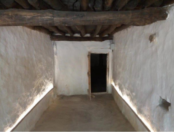
Şekil 9: Şeyh Bahşiş Cemevi (Küçük Ocak Zaviyesi) giriş mekânı (Şancı, 2021:280).