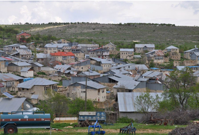
Şekil 2: Onar kırsal yerleşiminin genel görünümü (URL 9).