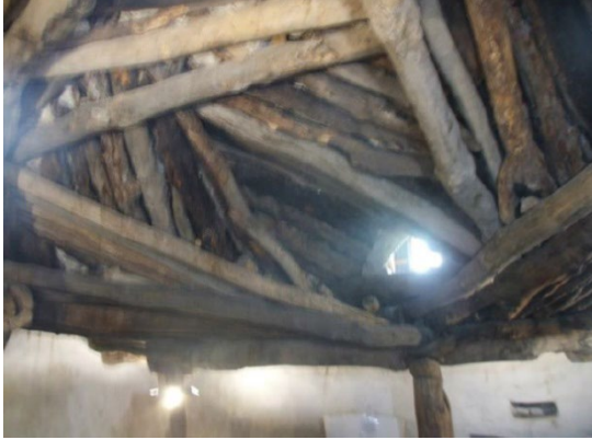
Şekil 7: Büyük Ocak Cemevi (Şeyh Hasan Onar Zaviyesi) tüteklikli örtüsü ve sır lokma penceresi (Şancı, 2021:279).

Büyük Ocak Cemevi (Şeyh Hasan Onar Zaviyesi), günümüzde ibadet amacıyla aktif olarak kullanılmasının yanı sıra Alevilik kültürüne ve geleneğine ilgi duyan turistler tarafından da ziyaret edilmektedir. Bu nedenle yapı içerisinde, Alevilik öğretisine dair bilgiler veren ve bu inancın ayinlerini tanıtmayı amaçlayan çeşitli etkinlikler de gerçekleştirilmektedir. Bu bağlamda turizm işlevinin hem yapının hem de Aleviliğe dair somut olmayan değerlerin korunması ve sürdürülmesi açısından önemli bir yeri olduğunu belirtmek mümkündür.