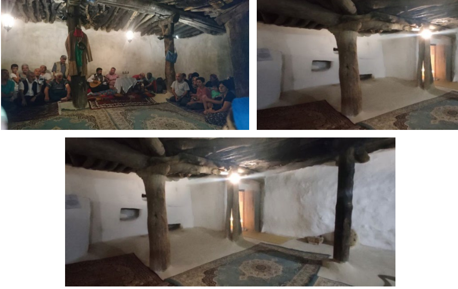
Şekil 6: Büyük Ocak Cemevi (Şeyh Hasan Onar Zaviyesi) ibadet mekânından görüntüler (Çöp, 2019; Altın, 2021).