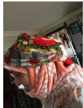
Fotoğraf 25- 26- 27- 28- 29: Baş Bağı