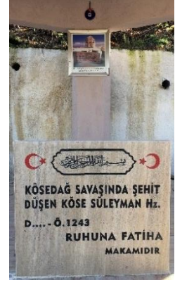
Fotoğraf 40- 41- 42: Kavakbaşı Mahallesi Köse Süleyman Anıtı