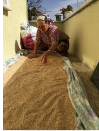
Fotoğraf 32- 33- 34- 35- 36- 37 Kaynak Kişiler