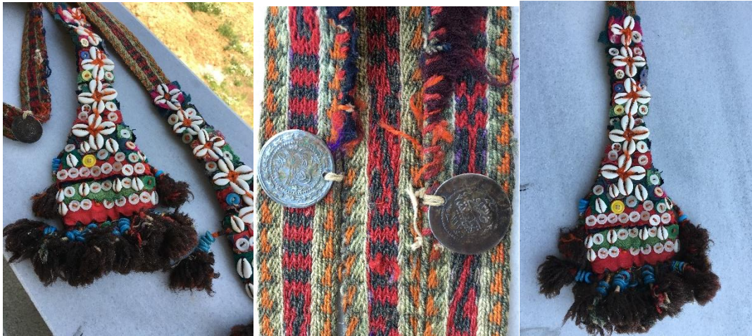
Fotoğraf 18- 19- 20: Geleneksel Giysi Oluk Bağı