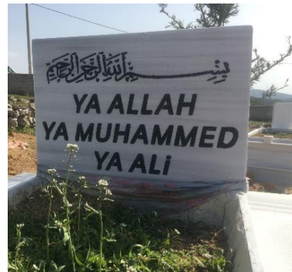
Fotoğraf 46- 47- 48- 49- 50- 51- 52- 53: Mezarlık Görüntüleri 234