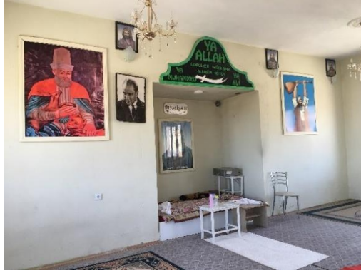
Fotoğraf 9- 10: Yaylacık Mahallesi Şehit Hayrettin Karabıyık Cemevi İçi