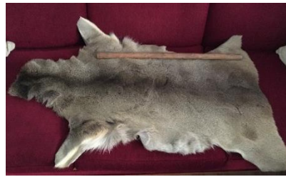
Fotoğraf 13: Cem Dedesi Mustafa Oğuz'a ait olan Geyik Derisi Post ve Tuba Ağacı'ndan yapılma Erkân