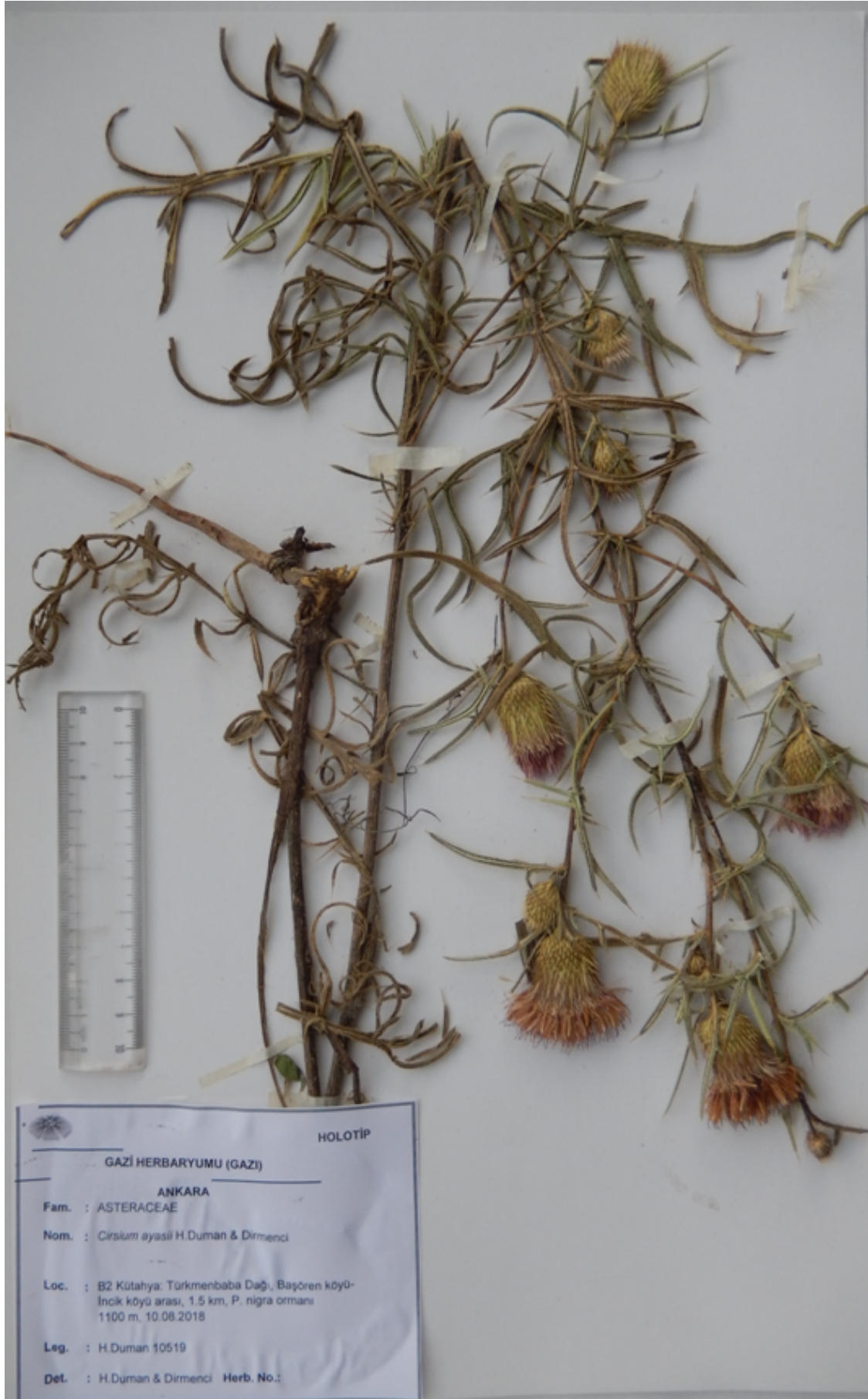
Şekil 2 (Figure 2) Cirsium ayasii Holotip (Holotype) örneęi