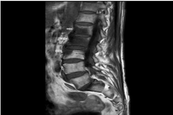
Resim 2. Postkontrast T1 AG yağ baskılı SPIR görüntülerde; L1 ve L3 vertebra korpus anterior kesiminde, L2'de vertebral korpus tamamında ve L2-3, L3-4 ve L5-S1 disk aralıklarında kontrast tutulumu, anterior paravertebral yumuşak dokularda enflamasyona işaret eden kontrastlanma alanları ile uyumlu görünüm.

Bruselloz ön planda düşünüldü. Daha öncesinde serolojik test sonuçları negatif olan hastanın serumu daha yüksek oranda dilüe edilerek çalışıldı ve 1/640 titrede pozitif saptandı (Resim 3).