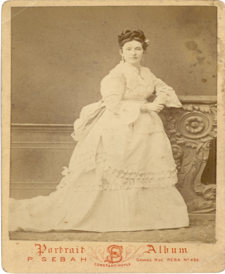
EK1: Saliha Sultan (Atatürk Kitaplığı Koleksiyonu)