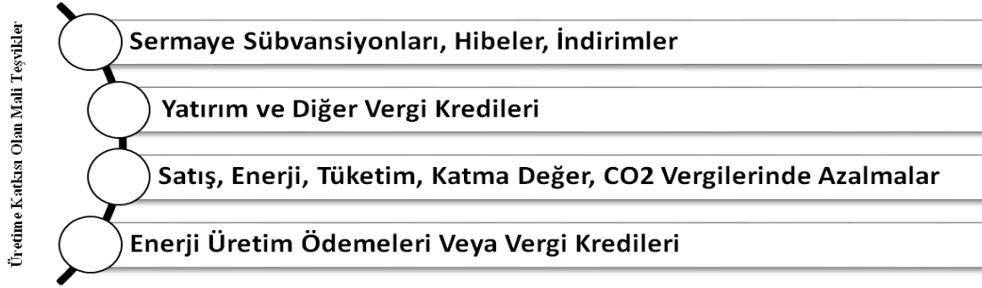
Şekil 3: Üretime Katkısı Olan Mali Teşvikler

Tablo 4’te yatırım sübvansiyonları, hibeler ve indirimleri uygulayan ülkeler kategorisinde Türkiye, üst orta gelirli ülkeler içerisinde yer almaktadır. Diğer mali teşvik politikası olan yatırım ve diğer vergi kredileri yatırım vergi muafiyetleri olarak adlandırılmaktadır. Bu muafiyetler projelerin vergi yükünü azaltmaktadır. Bu muafiyetler kurulu üretim kapasitelerine bağlı oldukları için öncelikli olarak projelerin genel performansını arttırmayı hedeflemektedirler.