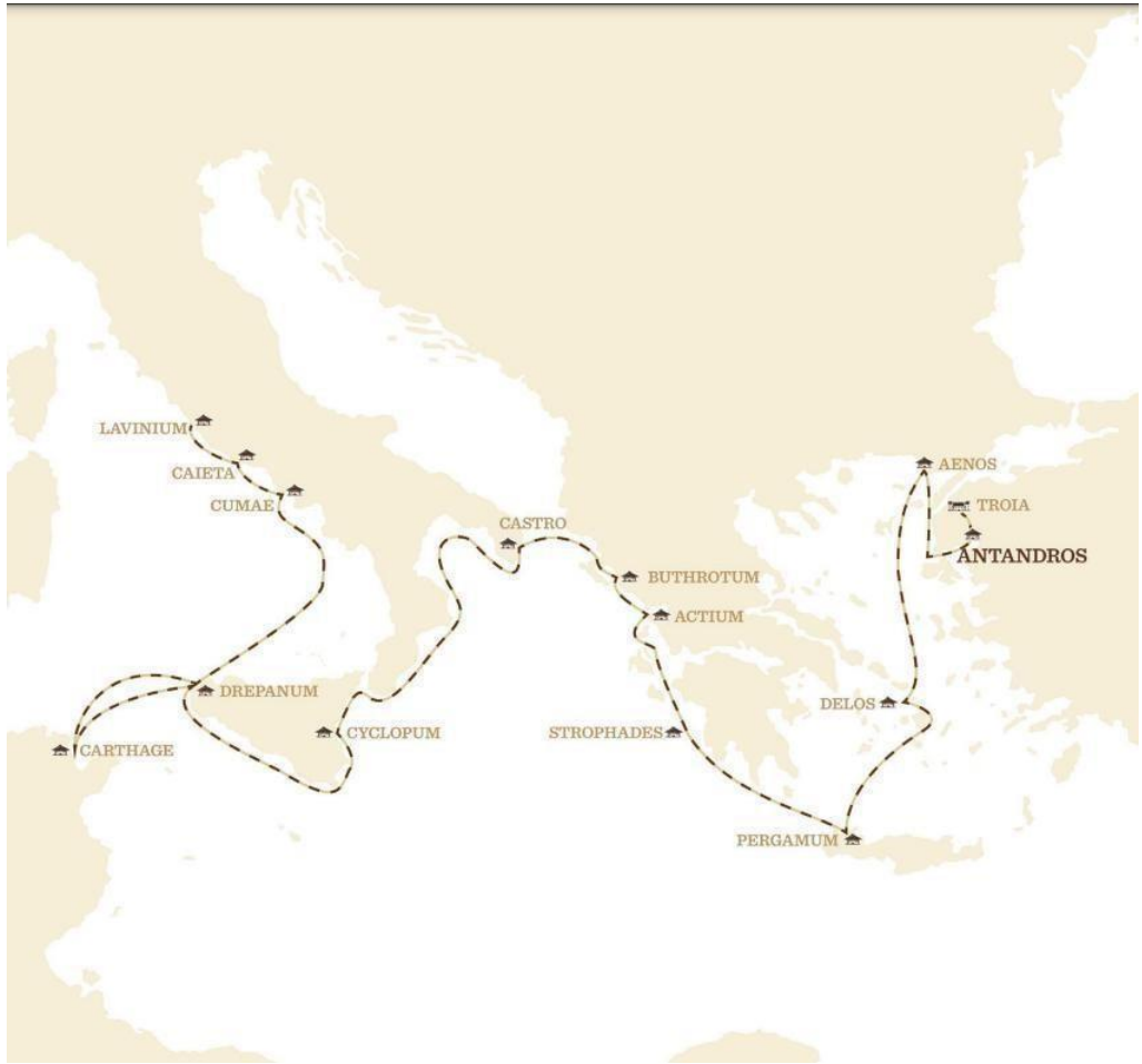
Şekil 1. Aeneas'ın Yol Güzergahı

limanlara uğramışlardır. Özellikle Kartaca, Aeneas'ın yolculuğunda hem siyasi hem de mitolojik açıdan önemli bir durak olmuş; Kraliçe Dido ile yaşanan olaylar efsanenin dramatik boyutunu güçlendirmiştir. Yolculuğun ilerleyen aşamalarında Aeneas, İtalya kıyılarındaki Cumae'de Apollon kâhini Sibylla'dan kehanet almış ve Lavinium'a ulaşarak kaderini gerçekleştirmiştir. Lavinium'da başlayan savaşlar ve Turnus ile yapılan mücadeleler sonucunda Aeneas, Troya soyunun İtalya'da kök salmasını sağlamış; bu süreç, Roma'nın mitolojik köken anlatısının temelini oluşturmuştur. Böylece Aeneas Efsanesi, Troya'dan İtalya'ya uzanan çok merkezli bir kültürel ve coğrafi aktarımı temsil etmektedir (Vergilius, 2022, s. 25-460).