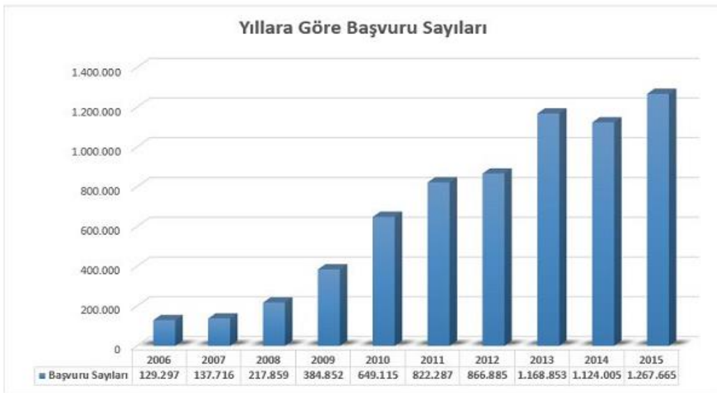
Şekil 2. BİMER Kapsamında Alınan Başvurularla İlgili İşlem Sayıları