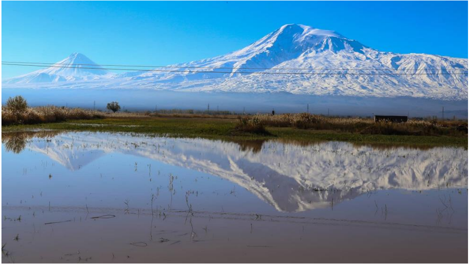
Şekil 3: Ağrı Dağı ve Sulak Alanlar

5137 m'yi bulan yüksekliğiyle çevreye egemen olan Ağrı Dağı'nın doğal yapısının, yöre uygarlıkları üzerine çok yönlü etkisi olmuştur. Bu etki, bölgenin ekonomik yapısına, sanata ve dine de yansımıştır. Dağın eteklerindeki lav ve tüf tabakalarıyla örtülü kesiminde, yer yer tarih öncesi dönem insanın taş araç-gereç yapımında kullandığı obsidiyen taşlarına rastlanır. Dağın 1500-3500 m'ler arasındaki yükselti kuşağında geniş otlakların bulunması, yörede yaylacılığın gelişmesi için çok uygun bir doğal ortam oluşturmuştur. Bu nedenle, yörede yaylacılık çok eski devirlerden beri önemini koruyan bir faaliyettir (Şimşek ve Alim, 2009:10).