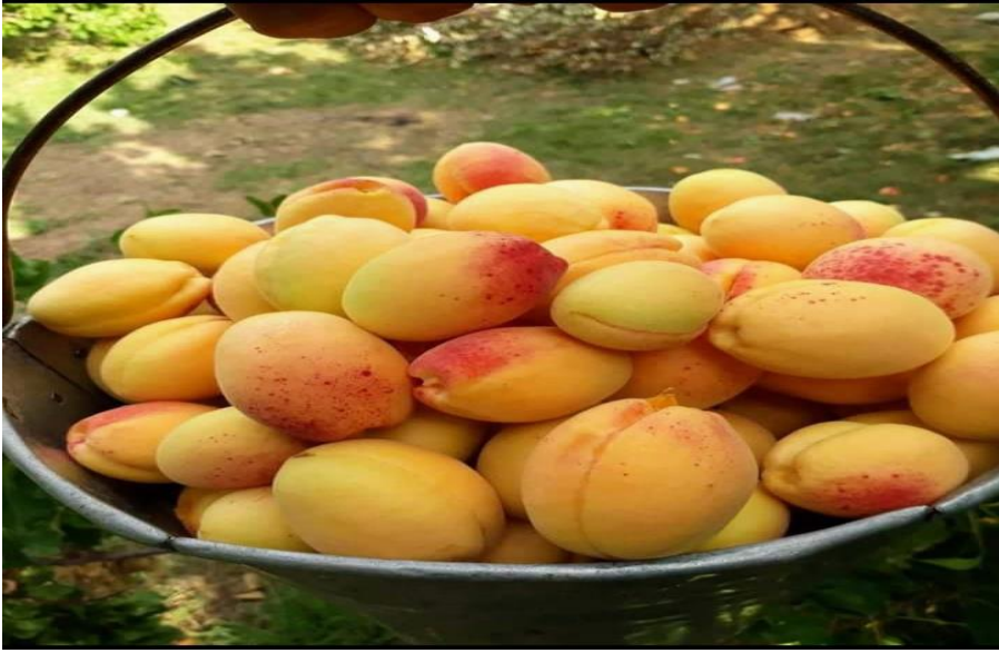
Şekil 5: Iğdır Şalağı Kaysısı

Birçok medeniyete tanıklık etmiş olan Iğdır ilinde halı, kilim, çorap ve oya örücülüğü gibi el sanatları yaşatılmaya çalışılmaktadır. Iğdır'ın kültür zenginliği mutfak kültürüne de yansımıştır ( https://www.atlasdergisi.com ).