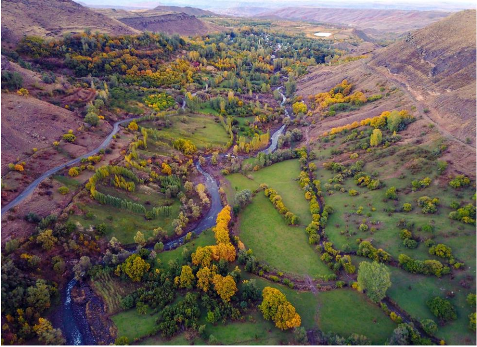
Şekil 4: Üçkaya Vadisi

Iğdır'da bulunan vadiler, çayırlıklara yaylalar turizm potansiyelinin en önemli elemanları arasındadır. Şekil 4'te Üçkaya Vadisi görseli yer almaktadır.