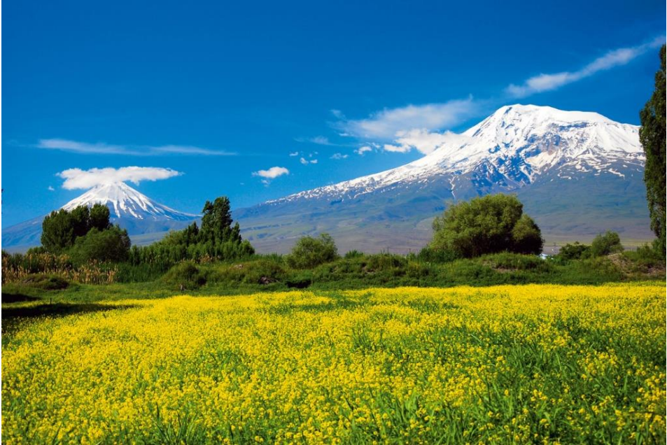
Şekil 2: İlkbahar Mevsiminde Ağrı Dağı

Ağrı Dağı heybetli görünümünün yanı sıra doğa sporları, dağcılık, yamaç paraşütü, flora fauna gözlemciliği, dini turizm, kış turizmi, dağ bisikleti, eko turizm gibi pek çok turizm türünün yapılabileceği bir potansiyele sahiptir. Ayrıca, Nuh Tufanı ile ilgili pek çok kaynak Ağrı Dağı'nı işaret etmektedir. Hz Nuh İslamiyet, Hristiyanlık ve Yahudilik din mensupları için kutsaldır. Bu nedenle Ağrı Dağı dini turizm potansiyeli de olan kutsal bir dağdır (Bayat, 2018:41-43).