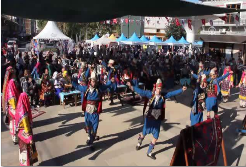
Foto 11: Uluslararası Yağcıbedir Halı, Kültür ve Sanat Etkinliklerinden Bir Kare