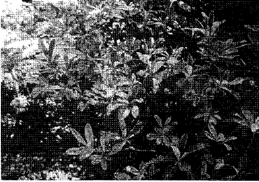
FOTO : Rhodendron luteum birliğinden bir görünüş

Ormangülü birliğinin saptandığı yer, Balıkesir İli Burhaniye İlçesinin, yaklaşık 15 km. kadar kuzeydoğusunda Dutluca Köyünün 2 km. kadar güney-güneydoğusunda yer alan Sankaya Tepenin kuzeybatı eteklerinden kaynaklanan Kanlı Derenin yukarı havzasındadır. Söz konusu vadi tabanında 350-250 m. yükseltiler arasında 1-1,5 km. boyunca Kestane birliğiyle karışık ve onun alt florası olarak takip edilir.