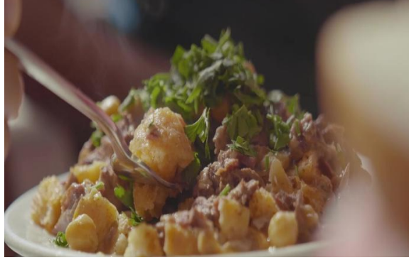
Şekil 15. Tirit