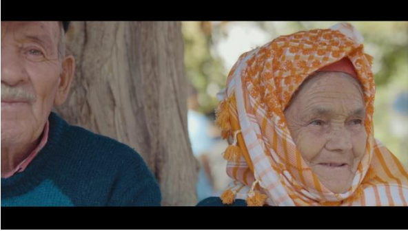
Şekil 8. Yaşlı Çift