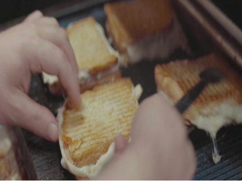
Şekil 14. Susurluk Tostu