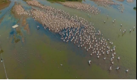
Şekil 20. Kuş Gözlemciliği