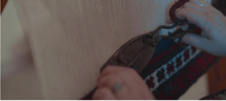
Şekil 13. Yağcıbedir Halısı

Düz anlam: Dilsel iletiyle birlikte kullanılan görsel unsurlardan ilki Şekil 13.'de gösterilmektedir. Bakıldığında Balıkesir'e özgü Yağcıbedir halısı dokuyan bir kadın görülmektedir. Elleri bakıldığında kadının yaşlı olduğu tahmin edilebilir. Ardından, Şekil 14. Susurluk tostu, şekil 15. Tirit (yöresel yemek), şekil 16. yeşil zeytin, şekil 17. Höşmerim ( yöresel tatlı), sırasıyla hızlı bir şekilde gösterilmiştir.