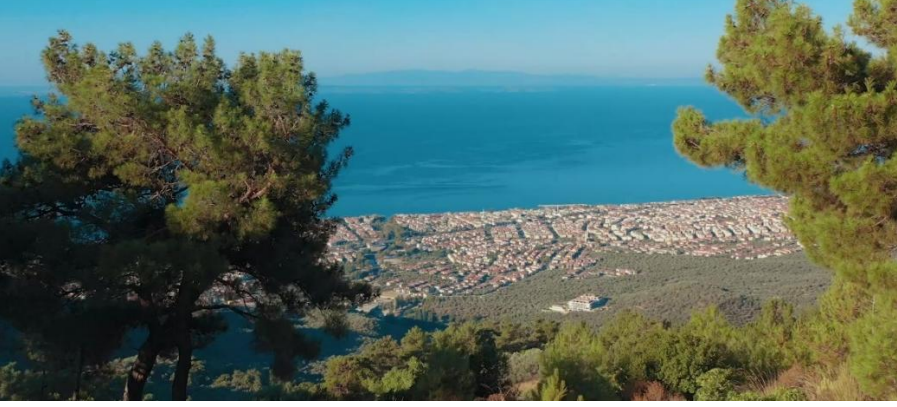
Şekil 2. Manzara

Düz anlam: ‘Bir şehir hayal edin!’ iletişiyle verilen karelerden diğeri ise Şekil 2.’de gösterilmektedir. Eşsiz bir manzara karesi, yeşil ağaçlar, masmavi deniz ve kıyı kesimlerde yoğunlaşmış yerleşim alanları, şehre ait bir görüntü olarak tanıtım filminde yer bulmaktadır. Balıkesir’in bir sahil kenti olduğunu gözler önüne seren bu karede, denizin cezbedici mavi tonu yoğun bir şekilde kullanılmıştır.