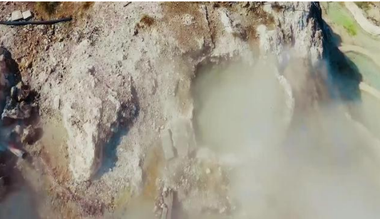
Şekil 18. Doğal Kaynak