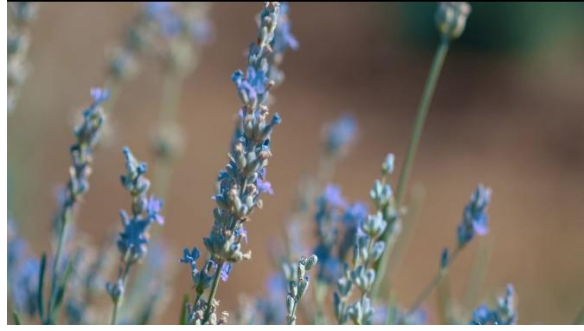
Şekil 21. Endemik Bitki