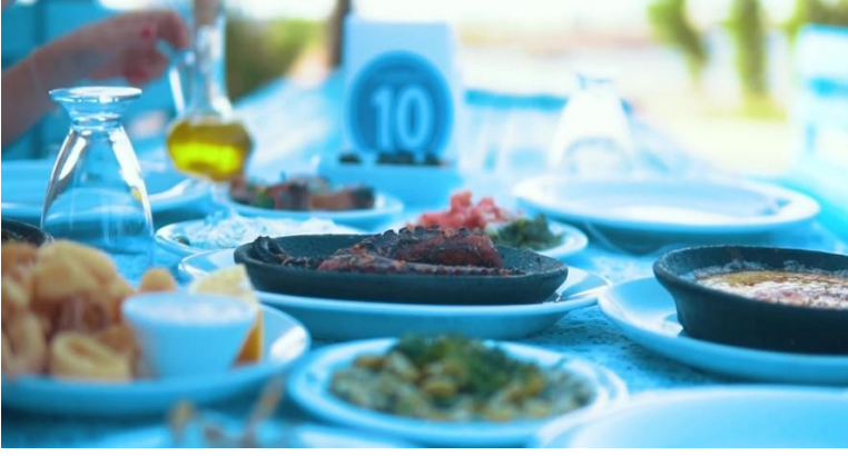
Şekil 5. Yemek Masası

Yan anlam: Muhteşem manzara karesinin ardından izleyicilere sunulan tarım arazisiyle, şehrin bereketli topraklarına vurgu yapıldığı söylenebilir. Bunun yanı sıra, görselde sadece bir çiftçi görülmekte, bu da üretimin daha çok bireysel ve dolayısıyla makineleşmemiş doğal bir üretim olduğuna vurgu yapmaktadır. Diğer taraftan bu kareden hemen sonra bir yemek masasına yer verilmiştir. Art arda verilen bu iki kare, ‘tarladan sofralarınıza’ mesajı verirken yine doğallığa bir gönderme yapmaktadır. Şehrin sahip olduğu plaka koduna gönderme yaparken, masanın flu şekilde sunulması gelip yakından görülmesinin, yaklaşmanız gerektiğinin bir ifadesi olarak düşünülebilir. Aynı zamanda, yemeğin açık havada bir restoranda olması da, benzer işletmelerin varlığı hakkında bilgi verirken, oldukça sosyal keyifli bir şehir imajı yaratıldığı mesajı verilmektedir. Masada bulunan zeytinyağı, şehrin coğrafi işaretli ürünlerinden biri olarak karede yerini almaktadır. Buradan hareketle, şehirde zeytinyağının doğal bir ürün olarak varlığına dair ipuçları verilmektedir. Nitekim ilerleyen karelerle birlikte zeytin ve zeytinyağına tekrar yer verildiği görülmektedir. Masadaki tabaklarda yer alan deniz ürünleri ise şehrin gastronomisinde deniz ürünlerinin önemine ve tuttuğu yere bir atıf olarak değerlendirilmiştir. Son olarak masada bardağın ters bir şekilde duruyor olması yemeğin başlangıç aşamasını işaret ederken, daha söylenecek çok şey var bu daha başlangıç mesajını verdiği söylenebilir.