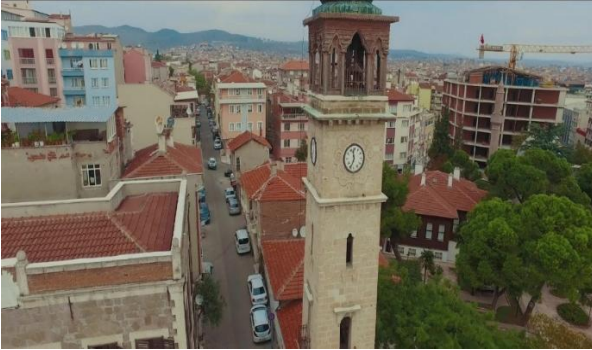
Şekil 10. Saat Kulesi