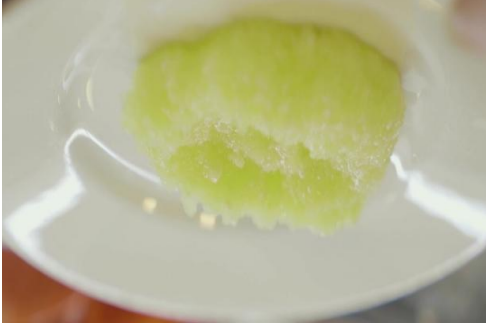
Şekil 17. Höşmerim