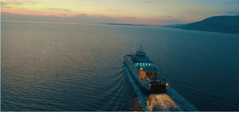
Şekil 12. Deniz Otobüsü

Dilsel ileti: “Balıkesir coğrafi işaretli ürünleriyle, özgünlüğünü tescillerken, kimliğini oluşturan bu öğelere gerekli desteği sağlayarak, imzasını gelecek nesillere aktarmayı hedefler.” iletişi şehre ait bir vizyondan bahsederken, özgünlüğüne vurgu yapmaktadır. Eş zamanlı olarak sunulan görsel unsurlar da, kültürel değerler ve şehre ait coğrafi işaretli ürünlere ağırlık verilmiştir.