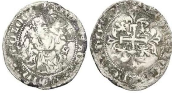
Şekil 2. Umur Bey'in Napoli Gigliati'sinden Kopyalanarak Kesilmiş Sikkesi

Balat ve Ayasuluk limanlarında, beyliklerin kendi adlarına para kestirdikleri darphaneler bulunmaktadır. Bu darphanelerde sadece kendi paralarını değil, aynı zamanda İtalyan şehir devletleri ile ortak kullandıkları gigliati adlı paraları da kesmektedirler. Ancak, bu gigliatiler, Napoli'de Anjou Hanedanı tarafından bastırılan paraların birebir kopyasıdır ve üzerlerinde Latince yazı bulunmaktadır.