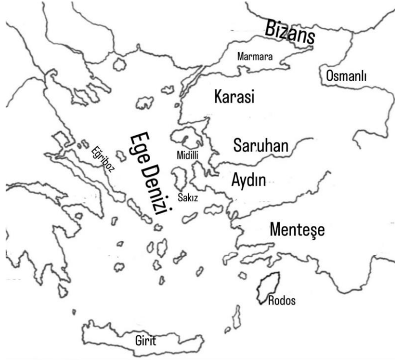
Şekil 1. Batı Anadolu Beylikleri

Anadolu'daki Türkmen gruplar ise Moğol istilasından kaçarak kendilerine kalıcı bir yurt arayışına girerek Bizans-Selçuklu sınırına doğru uç bölgelerine itilmiştir. Anadolu halkının uç bölgelere gelmesiyle uç beyleri daha da güçlenmiş ve yavaş yavaş Selçuklu egemenliğinden koparak bağımsızlık kazanmaya başlamışlardır. Bu uç bölgeler artık Türkmen gruplar için yeni faaliyet alanları haline gelecek ve Bizans mülkleri üzerinde gaza ve cihat anlayışıyla hareket eden Türkmenler, birer siyasi teşekkül haline gelecekler ve dönem tarihçilerinin yazınlarında bunların izi sürülebilecektir. Zaman içerisinde Batı Anadolu'da, Balıkesir merkezli Karesioğulları, Manisa merkezli Saruhanoğulları, Birgi-İzmir merkezli Aydınoğulları ve Muğla merkezli Menteşe oğulları bağımsız beyliklere dönüşerek denizcilik geleneğini benimseyeceklerdir. (Emecen, 2021, s. 253-254).