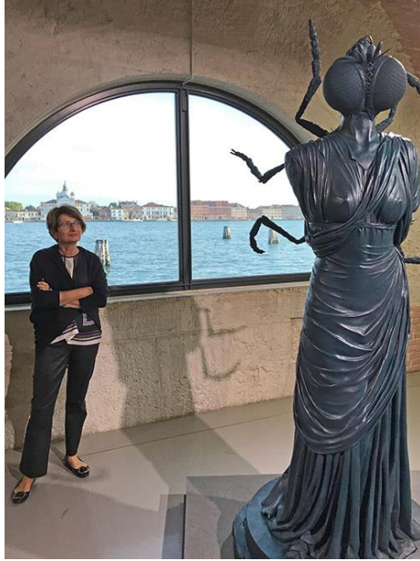
Tablo 7: Damien Hirst, "Metamorphosis", 2016, Bronz Heykel, 211.6x88.2x88.7cm.

betimlediğini açıklamıştır (Fortenberry ve Morrill, 2018: 127). Arachne aslında otoriteye karşı çıktığı için cezalandırılmıştır. Günümüzde de sanatçıya göre otoriteye karşı çıkmak bir (özellikle kadın olarak) Arachne ile aynı kaderi paylaşmaktır. Bu yüzden antik Yunan'dan günümüze bu imge pek de değişmemektedir (Tablo 7).