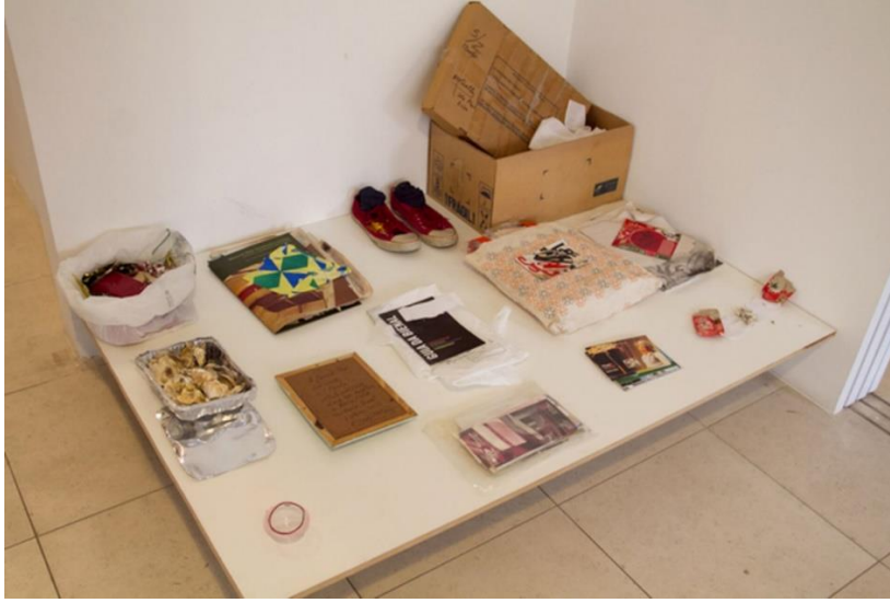
Tablo 5: David Medalla, "Cosmic Pandora Micro-Box", 2010, Yerleştirme.

kişisel ve sıradan nesnelere ile değiştirmiştir. Bu da sanatçının bir erkek gözüyle mitsel bir figürü yeniden çağdaş ve feminist bir biçimde yorumlanması olarak tanımlanabilir (Tablo 5). Patricia Watwood'un 2011 yılında yaptığı "Pandora" adlı resim ise Pandora karakterinin günümüz sanatında yeniden uyarlanmasıdır. Bu yeni Pandora imgesinde mitsel karakter yine kadındır fakat sandığı açtığı yer (dünyaya kötülüğün dağıldığı) bir endüstri şehri olarak betimlenmiştir. Sanatçı, Pandora'nın üzerinde oturduğu elektronik atıklar ve bunların üzerinde durduğu kafatası ile kötülük kavramını sanayileşme ve teknolojiyle ilişkilendirmiştir (Zeller, 2016: 276). Eski mitsel bir hikâye klasik bir resim tekniğiyle ele alınsa da resimde mitsel anlatı biçimi günümüzün sorunsalları ile ilişkilendirilmiştir. Pandora'nın kutusunun açılmasıyla yayılan kötülük aslında günümüzün kontrolsüz bir şekilde ilerleyen teknolojisi ile eş tutulmuştur (Tablo 6).