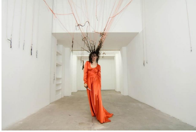
Tablo 1: Nezaket Ekici, "Atropos", 2006, Performans.

fotoğraftaki kızın gerçekliği ile çelişmektedir. Böylelikle duruş aynı bile olsa genç kız figüründeki doğallık ve nesnellik Venüs'ün eski anlamını yitirmesine yol açmıştır (Fortenberry ve Morrill, 2018: 33).