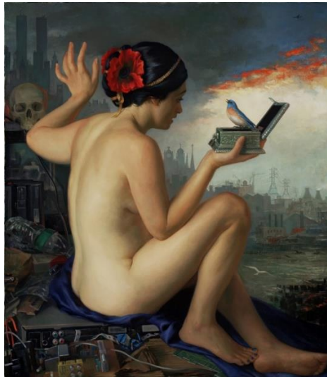
Tablo 6: Patricia Watwood, "Pandora", 2011, Tuval Üzeri Yağlıboya, 76.2x66 cm.

Güncel bir sanatçı olan Damien Hirst, "Arachne" adlı Antik Yunan mitolojisindeki kadın karakteri modern bir heykel biçiminde yorumlamıştır. Arachne, Antik Yunan mitolojisinde sıradan dokumacı bir köylü kızyiken, tanrıça Athena ile dokuma konusunda yarışa girdiği için cezalandırılıp örümceğe dönüştürülen bir kadın karakterdir. Hirst'ın "Metamorfoz" adlı heykelinde Arachne mitine gönderme yapılmaktadır. Sanatçı bu mitsel kadın figürünü örümcek yerine sineğe dönüşen bir formda betimlemiştir. Arachne'yi sineğe çevirmesinin sebebini kadın figürünün kurban rolünde olduğunu bu sebeple sinek imgesiyle örümceğin kurbanı olarak